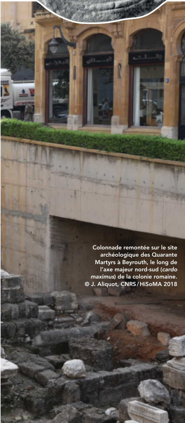
Colonnade remontée sur le site archéologique des Quarante Martyrs à Beyrouth, le long de l'axe majeur nord-sud ( cardo maximus ) de la colonie romaine.

Poids commercial en plomb au nom de la cité de Beyrouth, avec l'image du fondateur de la colonie traçant le sillon primordial ( sulcus primigenius ).