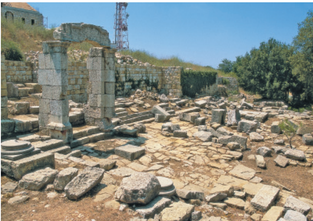
L'esplanade culturelle et le temple de Junon Reine.

L'intérêt des vestiges et la proximité de Beyrouth, distante d'une quinzaine de kilomètres, expliquent que de nombreux voyageurs, antiquaires et savants ont décrit le site à l'Époque moderne, en y relevant à l'occasion des inscriptions. L'histoire de la découverte remonte à la visite du voyageur italien Giovanni Mariti en 1767. À la suite des explorations du XIX e siècle, surtout profitables aux études épigraphiques, le père jésuite Sébastien Ronzevalle entreprend des fouilles de grande envergure, subventionnées par l'Académie des inscriptions et belles-lettres, tandis que la mission allemande de Baalbek relève le plan du grand temple en 1902. Dès lors, l'idée s'impose que Deir el-Qalaa est un site de pèlerinage isolé de tout habitat en même temps qu'un authentique haut-lieu phénicien semblable aux lieux de culte en plein air du pays de Canaan. Cette interprétation