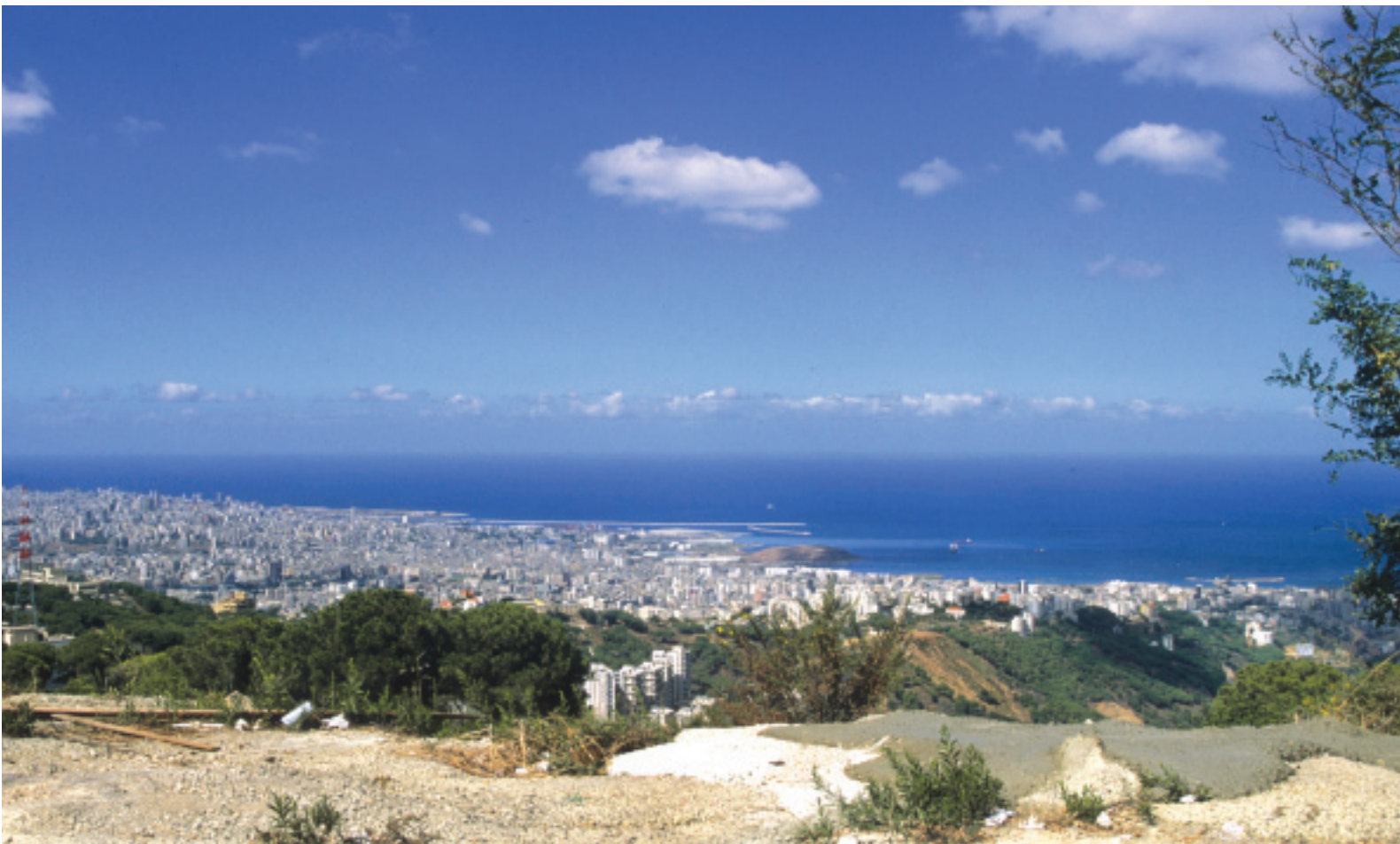
Vue de Beyrouth depuis Deir el-Qalaa.

Sur les hauteurs de Beyrouth, le site romano-byzantin de Deir el-Qalaa est dominé par les ruines d'un temple imposant dédié au dieu Jupiter Balmarcod et associé à une agglomération antique. Les vestiges conservés sur place livrent des informations irremplaçables sur les monuments religieux de la montagne libanaise et sur les cultes pratiqués en Phénicie sous l'Empire romain.