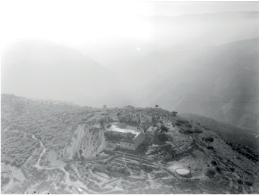
Deir el-Qalaa, vue aérienne oblique du site et du monastère moderne prise de l'ouest par l'Armée française du Levant en 1936.

toujours débattue se fonde sur la présence, bien réelle, de dizaines de sanctuaires romains dans l'arrière-pays des cités de la côte phénicienne et sur l'assimilation, discutable, de la culture des fidèles de ces sanctuaires à celle des Cananéens de la Bible et à celle des Phéniciens. Elle pose le