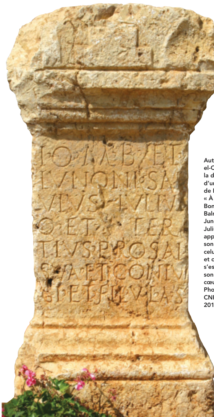
Autel votif de Deir el-Qalaa portant la dédicace latine d’un citoyen romain de Beyrouth : « À Jupiter Très Bon Très Grand Balmarcod et à Junon, Salvius Julius, également appelé Tertius, pour son propre salut, celui de son épouse et celui de ses fils, s’est acquitté de son vœu de bon cœur. »

Tel qu’il est transcrit en grec et en latin, le nom de Balmarcod est bien sûr sémitique, contrairement à celui de Junon Reine. Il se compose d’un premier élément correspondant à la transcription du nom de Baal, le grand dieu oriental de l’orage, et d’un second élément tiré de la racine rqd , « sauter », « danser ». Cependant, la majorité des dédicaces qui lui sont adressées montrent surtout que, sous l’Empire romain, Balmarcod a été assimilé à Jupiter et que la nomenclature latine a été adoptée pour redéfinir son domaine d’activité : le sigle IOMB ( Iuppiter Optimus Maximus Balmarcodes ) a ainsi été forgé sur le modèle de celui qui