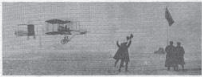
La grande aventure de l'aviation commence, en France, dans les années 1908-1909. Au cœur de ce nouvel espace mental, un pionnier, Henry Farman, est le premier aviateur à voler durant un kilomètre en circuit fermé, le 13 janvier 1908.

et diffusent le modèle d'un homme nouveau, rapide, aventureux, ouvert sur le progrès (Caron 1985 : 357). Ils ont, entre eux, des « affinités structurales » (Bourdieu 1981 : 133-167) et composent des mouvements sociaux, nés les uns des autres, qui modifient en profondeur « l'âme et le corps ». Symbolisant l'esprit nouveau, ils créent, à l'intérieur d'une époque « enfiévrée de progrès », une révolution mécanique et industrielle mais aussi physique et morale (Weber 1986).