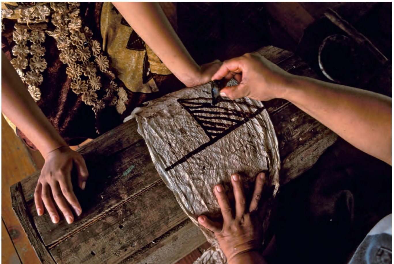
fig. 4 Peinture sur tissu aux îles Tonga.