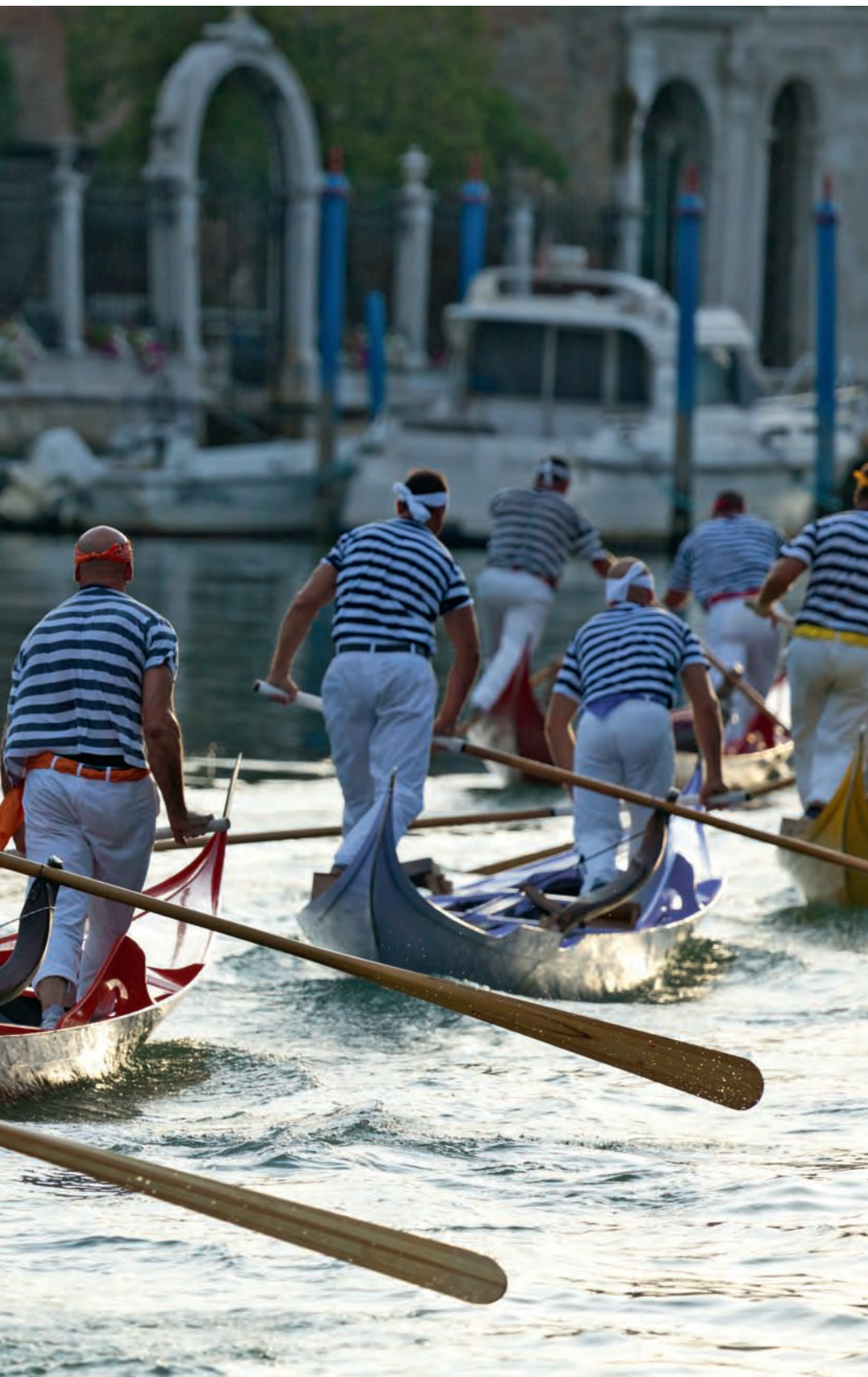
fig. 7 Carlo Morucchio, Volalonga de Venise , 2012.