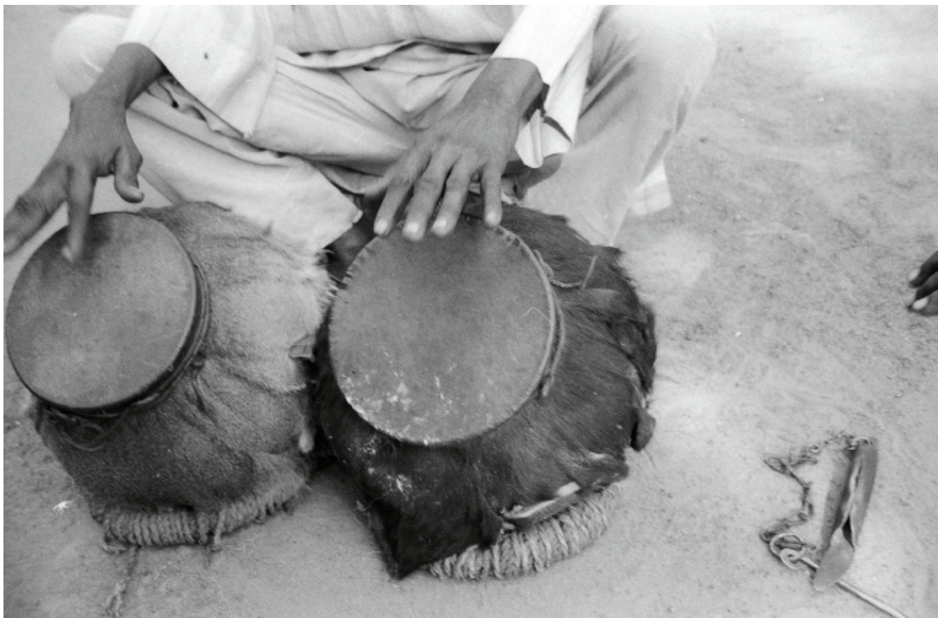
fig. 6 Timbales kolobi composées de jarres en poterie recouverte de peau, Bénin, village de Pira, population itcha (sous-groupe yoruba), 1998.

les designers actuels. C'est dire que, si la recherche de la beauté fonctionnelle telle que la définissait Leroi-Gourhan rapproche les artisans préhistoriques (ou les artisans touaregs) de nos modernes designers, le rapprochement se justifie moins si l'on doit admettre que la beauté des outils tient aussi à l'économie des gestes qui les ont produits. En effet, il est peu probable qu'un designer se soucie de la gestuelle de l'artisan qui devra fabriquer les outils qu'il conçoit puisqu'il s'agira d'objets fabriqués en série, et par des machines.