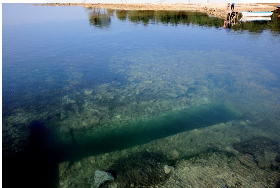
Fig. 6. Vivier de la baie de Busuja (Poreč). Vue d'un des bassins depuis la surface.