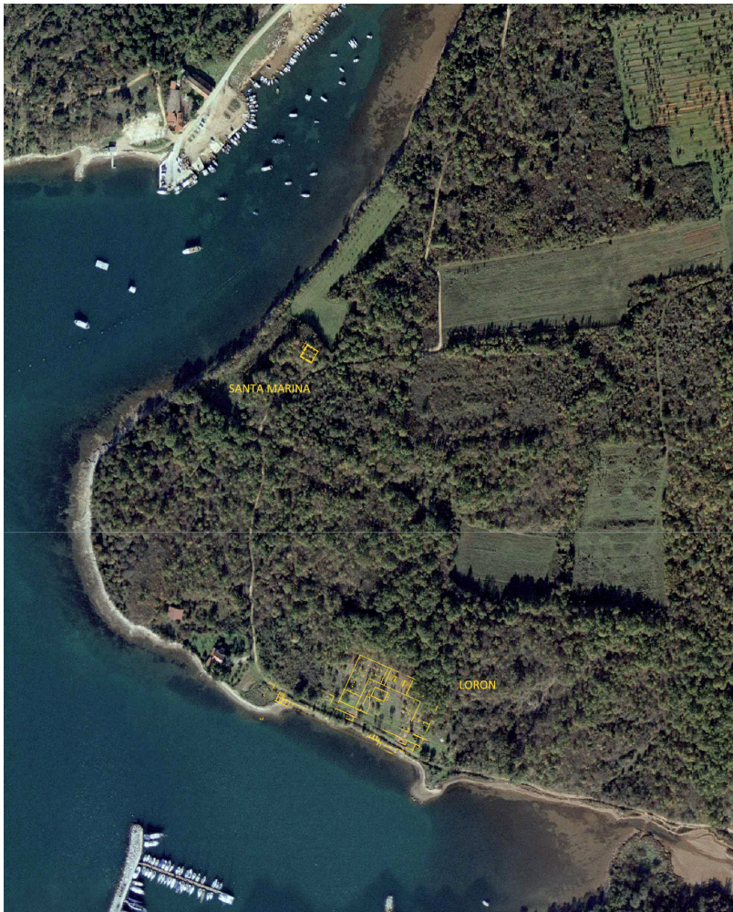
Fig. 1. Localisation des secteurs d'études (villa de Santa Marina au nord et atelier de Loron au sud) sur l'orthophotographie du promontoire (CAO C. Taffetani).

Les résultats obtenus dans le cadre d'un nouveau programme de recherche conduit par le centre Camille Jullian de l'université d'Aix Marseille, l'École française de Rome et le musée territorial du Parentin, avec le soutien du ministère de la Culture croate et du ministère français des affaires étrangères confirment l'existence d'un important ensemble résidentiel, interprété comme une villa établie en terrasse jusqu'à la mer, sur la rive nord du promontoire 6 . Depuis la citerne, cet ensemble s'étend sur au moins 50 m d'est en ouest, avec une façade maritime longue de plus de 100 m du nord au sud, soit une superficie estimée à 5000 m 2 . Bien que l'essentiel des structures soit actuellement masquées par le couvert boisé, les opérations de fouilles (2014-2016) et de prospections (depuis 2012) montrent que les édifices suivent un plan d'ensemble, présentant les mêmes orientations, à l'exception de la citerne qui est légèrement décalée (fig. 1).