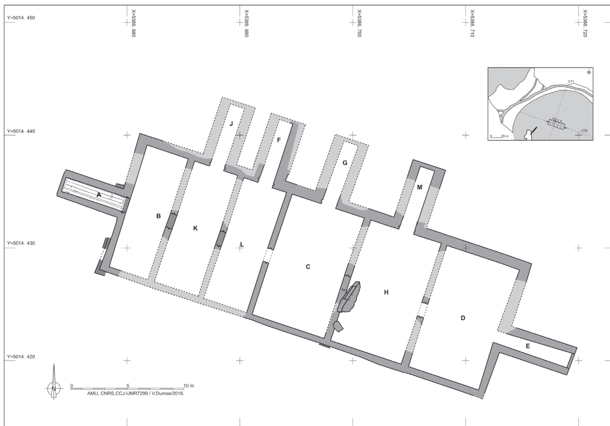
Fig. 5. Vivier de la baie de Busuja (Poreč). Plan de masse (V. Dumas, CCJ/AMU-CNRS).