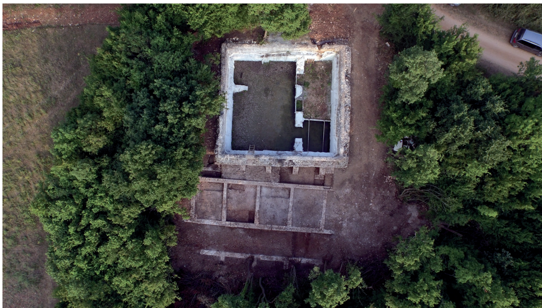
Fig. 2. Villa de Santa Marina. Vue verticale du secteur de la citerne. La citerne, fouillée en 2014, est partiellement recouverte pour protection.