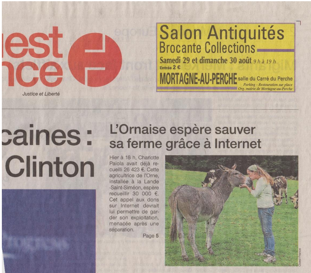
Figure 1 : Extrait de la une de l'édition ornaise de Ouest-France du 27 août 2015

Voici la une à l'origine de cette étude de cas (fig. 1). L'histoire de l'agricultrice divorcée qui nous intéresse commence d'un point de vue des sources mobilisées le 27 août 2015 alors qu'elle se trouve dans une situation financière difficile. En effet, dans l'article de cette même édition, on apprend que suite au divorce de cette agricultrice avec son ex-mari et associé, l'exploitation agricole est en redressement judiciaire et qu'elle doit rassembler de l'argent pour démontrer à l'institution judiciaire la viabilité de son entreprise : 30 000 euros pour sauver son cheptel, 50 000 euros pour relancer l'activité. Des amis et confrères lui suggèrent de solliciter du financement participatif via le site dédié KissKissBankBank . Le 26 août 2015, à 18h00, elle avait collecté 26 423 euros (4). L'opération réussit partiellement dans un premier temps puisque 36 238 euros sont récoltés le 29 août 2015 (5), et finalement 48 840 € le 1 er septembre 2015. S'ajoutent 6 000 euros reçus par voie postale. L'agricultrice dispose grâce au financement