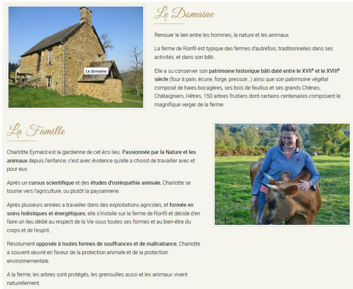
Figure 2 : Capture d'écran de la présentation de l'exploitation agricole et de la trajectoire de l'agricultrice sur le site internet de l'entreprise

C'est donc d'autres espèces de capitaux qu'elle active pour pérenniser son capital économique menacé, notamment son capital culturel. Sur cette capture d'écran du site de l'exploitation agricole (fig. 2), on voit la mise en avant du capital culturel certifié grâce à son cursus scientifique en ostéopathie animale, sans mention de diplôme mais signifié par l'emploi d'un vocabulaire académique. On lit la revendication de l'agriculture paysanne, qui renvoie à :