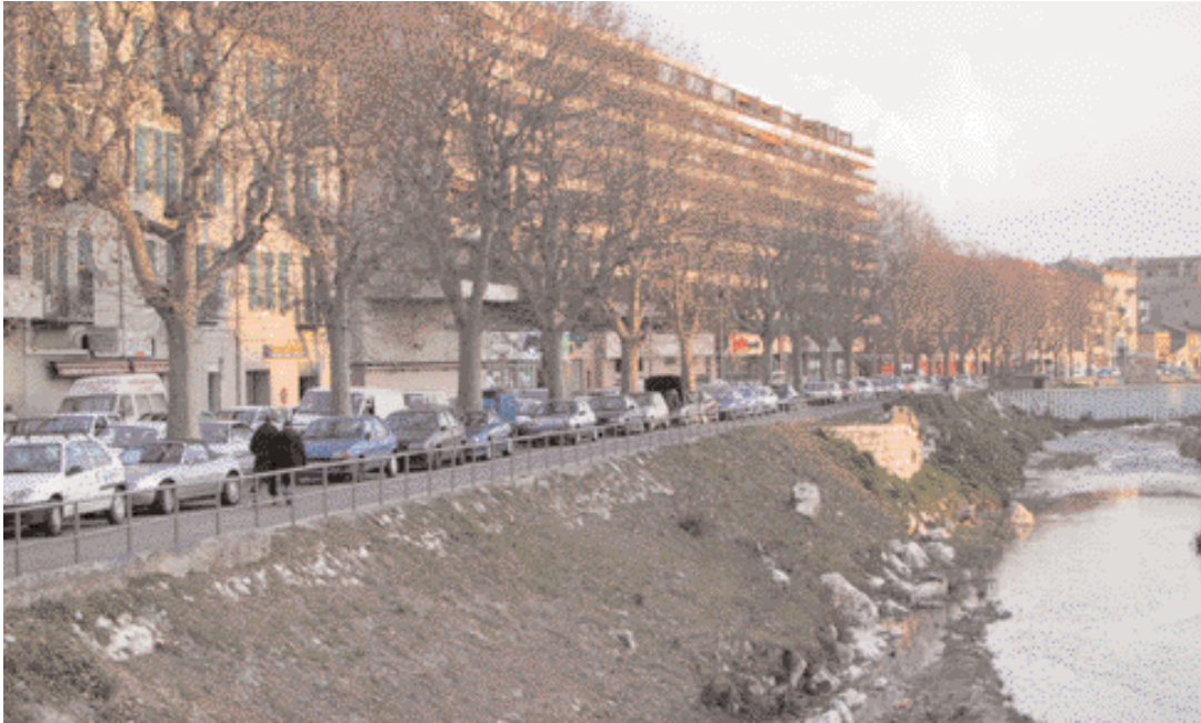
Le Paillon - Nice

in order to improve preparing for such a situation. It has been designed by being based on the case of Nice, the fifth largest city in France, and through which two rivers flow, namely the Var to the west, and the Paillon to the East, these rivers being subject to frequent spates and floods. The tool, developed on the basis of information passed on by the various departments of