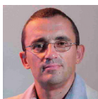
AUTEUR Lionel Maltese TITRE Professeur associé, Kedge Business School