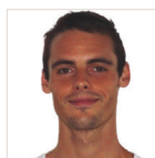
AUTEUR Mickaël Terrien TITRE Doctorant en science de gestion, université de Caen Basse-Normandie

La mise en place de la taxe à 75 % sur la part des salaires supérieure à un million d'euros par an a suscité de nombreuses réactions dans le secteur du football professionnel. Si son impact est clair sur la rentabilité des clubs, elle peut également agir sur la présence (ou non) de joueurs de talents ainsi que sur l'incertitude du résultat.