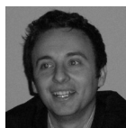
AUTEUR Lucien Veran TITRE Professeur agrégé en science de gestion, université Aix-Marseille