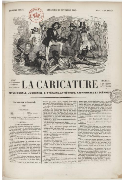
Édouard Ourliac, La Première Tragédie de Goethe , Journal des enfants , octobre 1838, p. 116 (collection privée) & La Partie d'écarté , La Caricature , 28 novembre 1840, p. 1 (Gallica).

Or, dans ce périodique, les textes d'Ourliac côtoient les œuvres d'Alphonse Karr (connu par sa participation aux Guêpes et à Figaro ), ou encore de Louis Desnoyers. À la faveur de ce cercle émulateur, sont nés des récits dont le rôle fut majeur dans la régénération des productions narratives destinées aux jeunes gens. Les aventures rocambolesques avant l'heure, invraisemblables, s'y multiplient. Il n'est à cet égard pas étonnant de constater que c'est Desnoyers, auteur qui a collaboré, entre autres, au Figaro , au Corsaire , à La Caricature ou encore au Charivari , qui est l'inventeur du personnage du « garnement », de cet « enfant terrible » bien éloigné des modèles se voulant moralisateurs, avec son personnage alors célèbre de Jean-Paul Choppart 49 . Si l'on en croit les nombreuses rééditions, y compris récentes (la dernière date de 1995, dans la collection des « Classiques roses » de Castermann au titre significatif), il avait alors engendré une œuvre suffisamment moderne pour qu'elle traverse les siècles et puisse encore nous séduire. Ourliac n'a pas connu cette fortune, mais ses productions dramatiques ne le méritaient pas moins. Il n'est sans doute pas le seul, et peut-être est-ce en ce Journal des enfants , qui répandait des œuvres pouvant à première vue paraître anodines, produites par des auteurs aujourd'hui oubliés, que s'est inventée cette indéfinition propre à ce que nous nommons aujourd'hui la « littérature de jeunesse ».