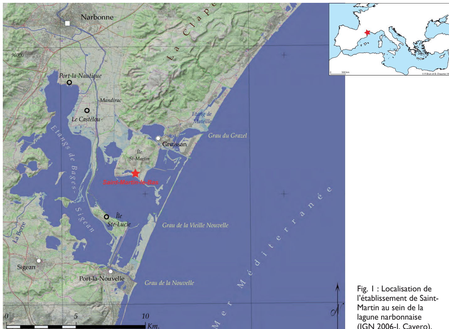
Fig. 1 : Localisation de l'établissement de Saint-Martin au sein de la lagune narbonnaise (IGN 2006-J. Cavero).