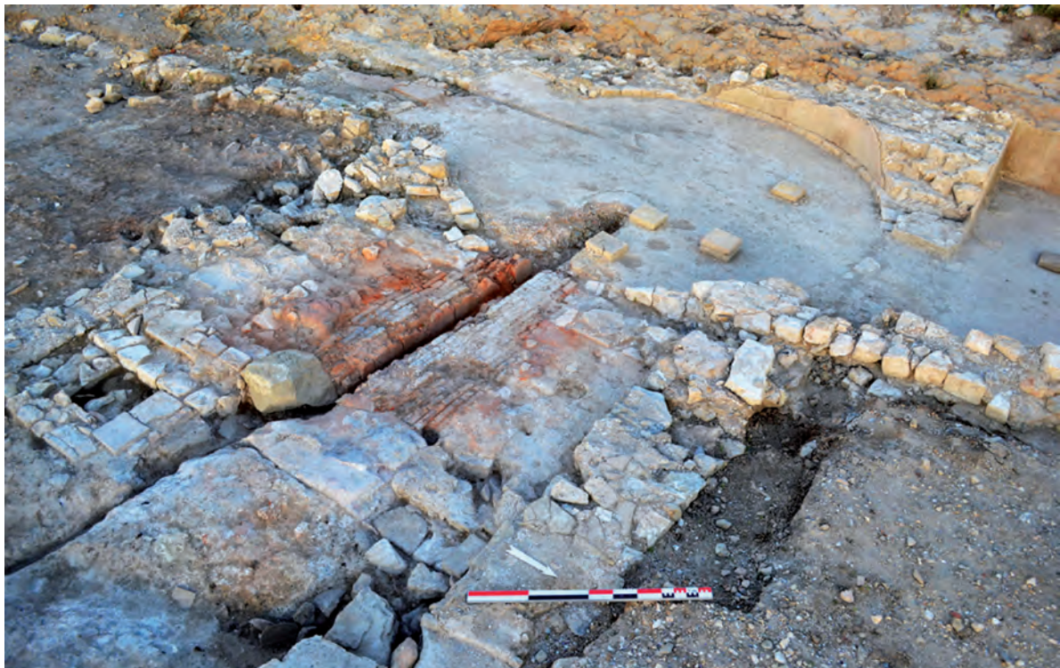
Fig. 8 : Le praefurnium et le caldarium des thermes ouest.