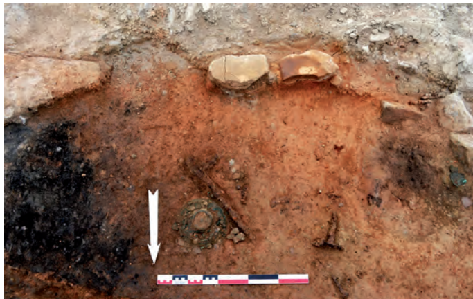
Fig. 5 : Vue des objets en place sur le sol de la pièce PCE210.

(15 à 21 m 2 ), équipées d'un sol en terre. Celles-ci étaient séparées par des cloisons en torchis couvertes sur chaque face d'un enduit de chaux 6 . La mise en évidence de l'utilisation simultanée d'architectures en terre et en grand appareil constitue un acquis important en raison de son originalité. De plus, la découverte, dans l'une des pièces (PCE210), d'un ensemble remarquable d'objets (balance, règle en os, balsamaire en bronze, nombreux jetons en os et en verre, aiguille en bronze) associés à des vases de stockage ( dolia et amphores), scellés par l'effondrement d'un pan de mur, indique vraisemblablement que ce sous-sol était dévolu à des activités économiques, voire commerciales (fig. 5). L'utilisation de ces pièces date principalement du II e siècle, leur abandon pouvant être daté au plus tard dans le courant du III e siècle. 7