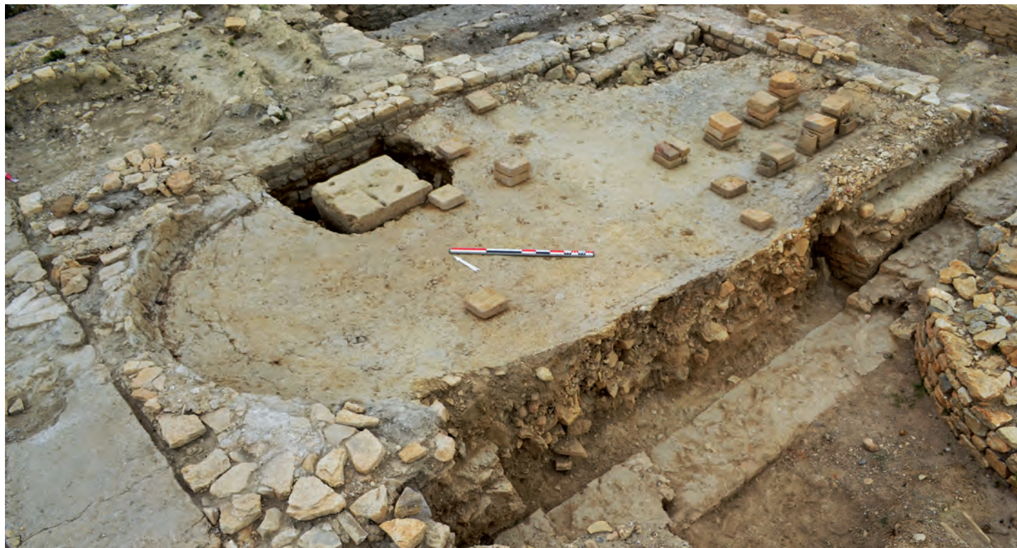
Fig. 6 : Le caldarium des thermes est.

convient de souligner le fort arasement de l'ensemble des niveaux supérieurs de cette parcelle.