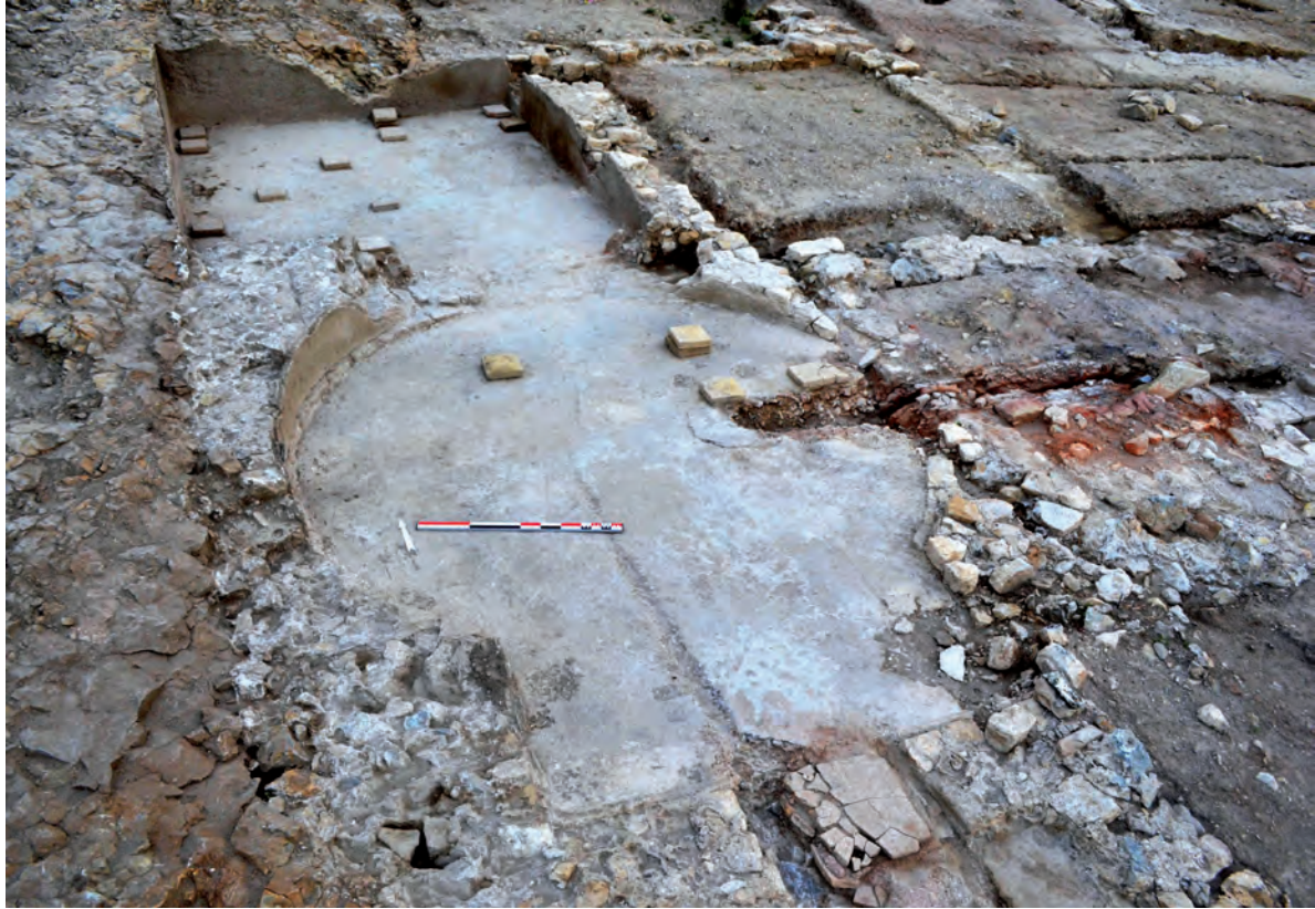
Fig. 7 : Vue générale des thermes ouest.