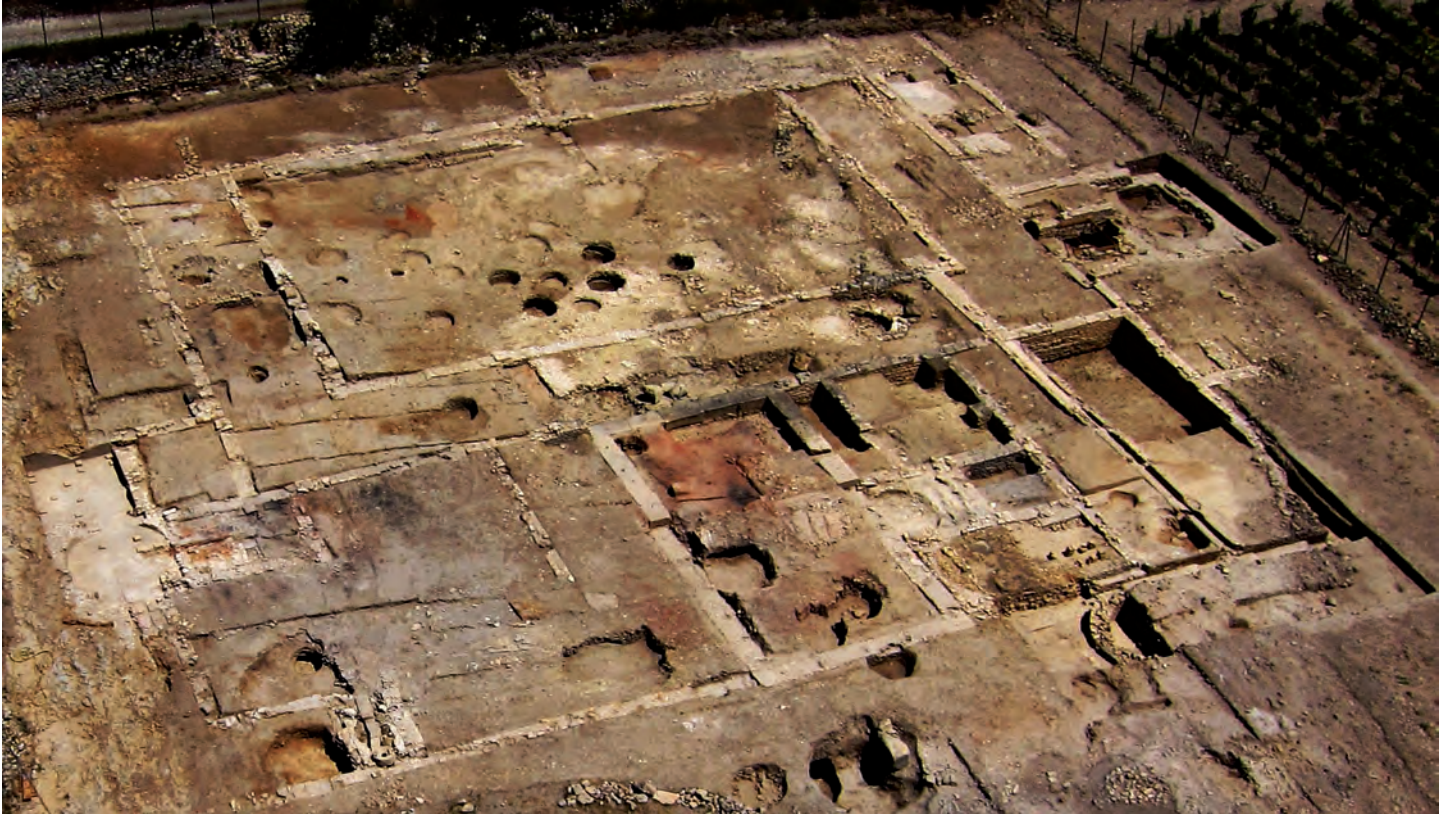
Fig. 3 : Vue aérienne de la fouille à l'issue du décapage, depuis le sud-ouest.

vers le nord, au-delà de la limite actuelle de la parcelle en cours de fouille constituée par le mur antique en élévation MR4095, peut-être en suivant une organisation en terrasses afin de s'adapter au pendage du terrain naturel. En effet, des observations anciennes signalent la présence au nord de ce mur, à l'emplacement de l'actuel chemin, d'un niveau de sol en opus spicatum , situé à une altimétrie bien plus élevée que les vestiges que nous avons mis au jour. Il pourrait témoigner de l'existence d'une plate-forme haute se développant dans la parcelle voisine et englobant peut-être l'aven situé à seulement une trentaine de mètres au nord de notre limite de fouille.