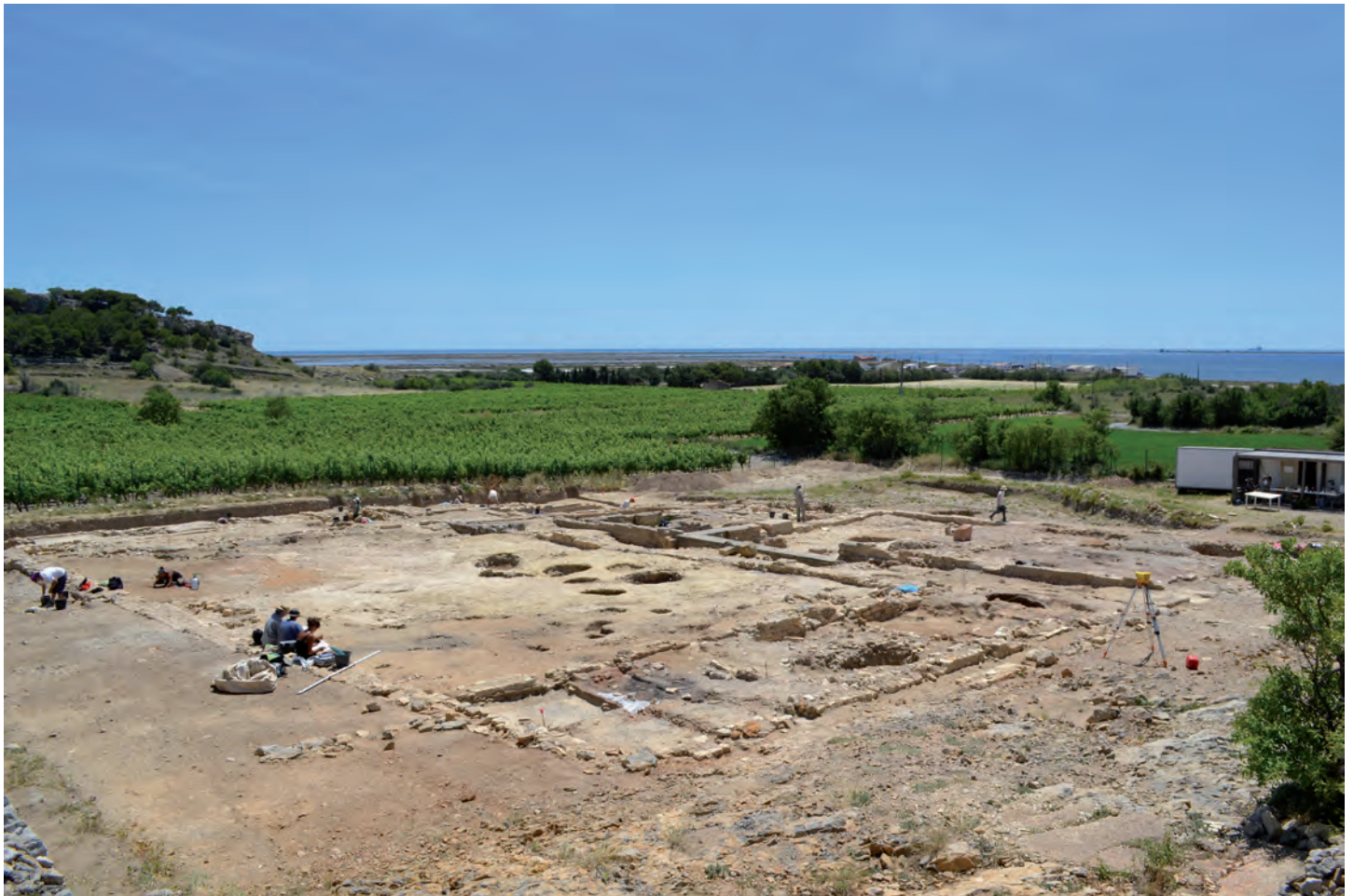
Fig. 9 : Vue générale de la fouille depuis le nord-ouest, avec en arrière-plan l'étang de l'Ayrolle et la mer Méditerranée.

point de vue sur l'étang de L'Ayrolle et la Méditerranée. Les villae maritimes d'époque impériale connues en Italie sont, lorsque les fouilles ou dégagements opérés permettent d'avoir une vue d'ensemble suffisamment large, de grande taille et intègrent souvent des nymphées et autres équipements somptueux (Lafon 2001, 331-473). À Saint-Martin, le plan ramassé des deux balnéaires et l'extrême sobriété de leurs décors témoignent de leur caractère avant tout fonctionnel et pratique. Enfin, la localisation d'une forge dans une petite cour située entre les thermes ouest et l'édifice en grand appareil confirme, s'il en était besoin, que nous ne nous trouvons pas ici dans la pars urbana d'une villa . D'autre part, s'il s'agissait de balnéaires destinés à la main-d'œuvre d'une villa , on serait incapable de les mettre en relation topographique avec une pars rustica qui fait totalement défaut dans l'emprise actuelle de la fouille, et il faudrait alors également expliquer leur proximité avec le bâtiment en grand appareil dont il conviendrait aussi de préciser la fonction à l'intérieur d'un éventuel secteur rustique.