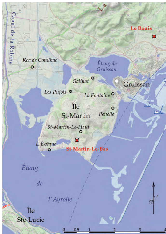
Fig. 2 : Localisation de la parcelle fouillée de 2011 à 2013 (IGN).

d'une occupation continue de l'époque tardo-républicaine jusqu'à la fin de l'Antiquité. Ces résultats constituaient donc un apport majeur à la connaissance de ce site, mais, en raison de l'emprise restreinte de la fouille, la nature exacte des édifices dégagés n'avait pu être précisée. Les données restaient donc insuffisantes pour trancher entre les diverses hypothèses envisageables : établissement portuaire, villa maritime, ou simple habitat littoral, peut-être lié à l'exploitation des ressources locales (Sanchez et al. 2000, 55-56 ; Sanchez 2009, 323 ; Sanchez et al. 2011, 54-56) ?