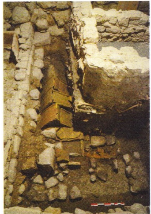
Vue d'une sépulture de l'Antiquité tardive, installée dans un coffrage en tuiles.

puis une fouille programmée s'est concentrée, en 2016 et 2017 sur l'exploration de la partie sud-est du monument. Encore provisoires, ces résultats permettent déjà de retracer assez précisément les principales évolutions du monument.