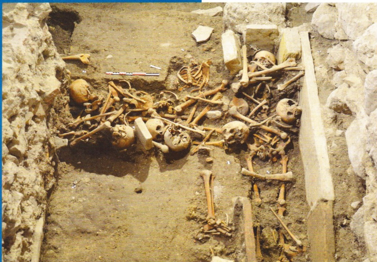
Recouvrements et réductions de sépultures médiévales dans la sacristie.