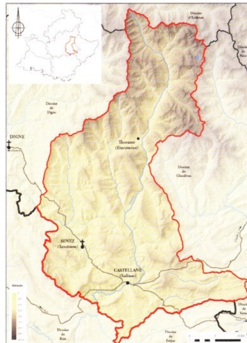
Carte de l'ancien diocèse de Senez à la fin du Moyen Âge.