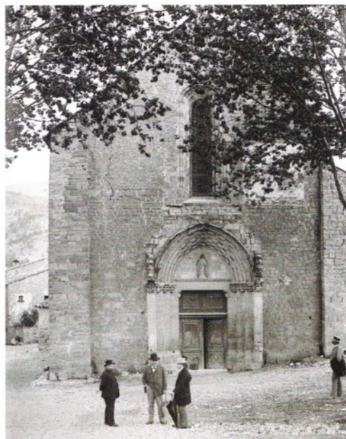
La façade occidentale de la cathédrale vers 1890, par Saint-Marcel-Eysseric.