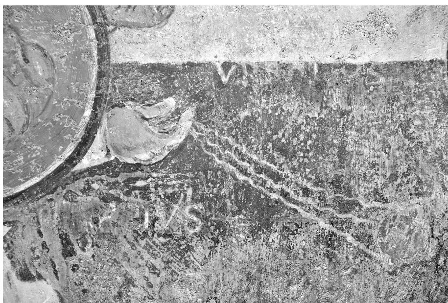
Fig. 3 - Saint-Savin-sur-Gartempe, chapelle axiale, scène d'ensevelissement, inscriptions.

mentionne pas le miracle de céphalophorie, sur lequel les peintures insistent pourtant grandement puisque le saint est représenté dans un geste fondateur, en train de déposer son chef sur une colline (fig. 2).