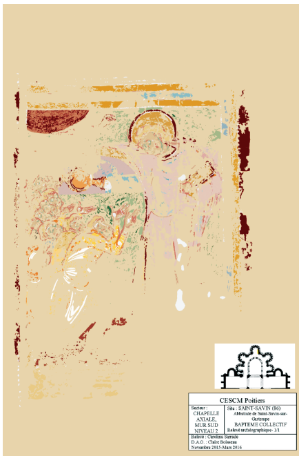
Fig. 5 - Saint-Savin-sur-Gartempe, chapelle axiale, scène de baptême collectif, relevé Carolina Sarrade/ CESC.M.

les deux inscriptions lacunaires de la scène d'ensevelissement, à savoir ... PIUS et URBANUS (fig. 3).