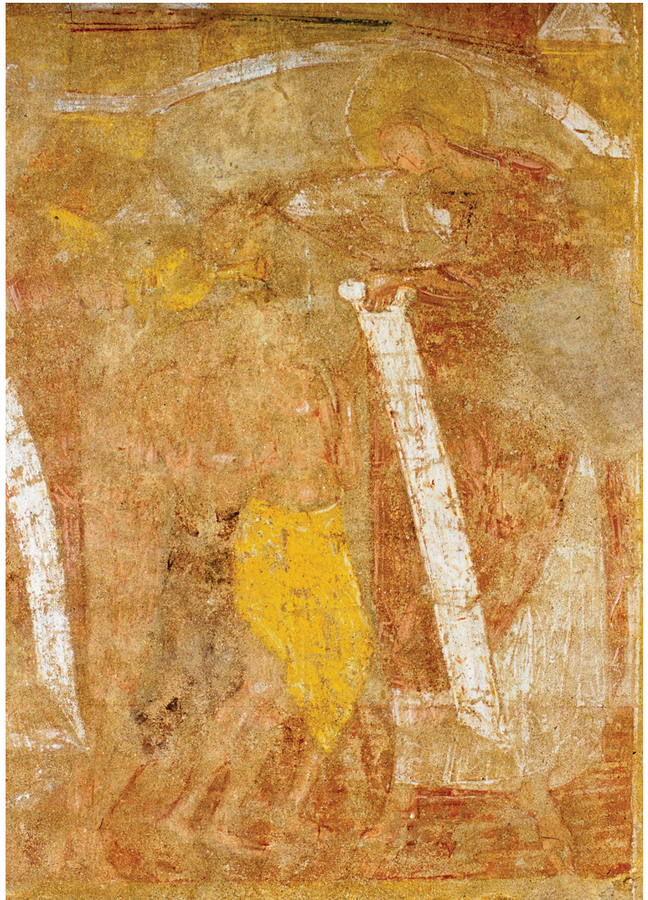
Fig. 6 - Saint-Savin-sur-Gartempe, tribune, baptême de saint Denis par saint Paul

l'édifice, et celui de saint Marin, dans la chapelle axiale, c'est-à-dire à l'extrémité orientale. D'un bout à l'autre de l'édifice un jeu d'écho très net est établi par les thèmes de la céphalophorie et du baptême (fig. 2, 4, 5 et 6). Les similitudes iconographiques entre les scènes de baptême sont particulièrement évidentes puisque dans les deux cas le personnage administrant le baptême (saint Paul