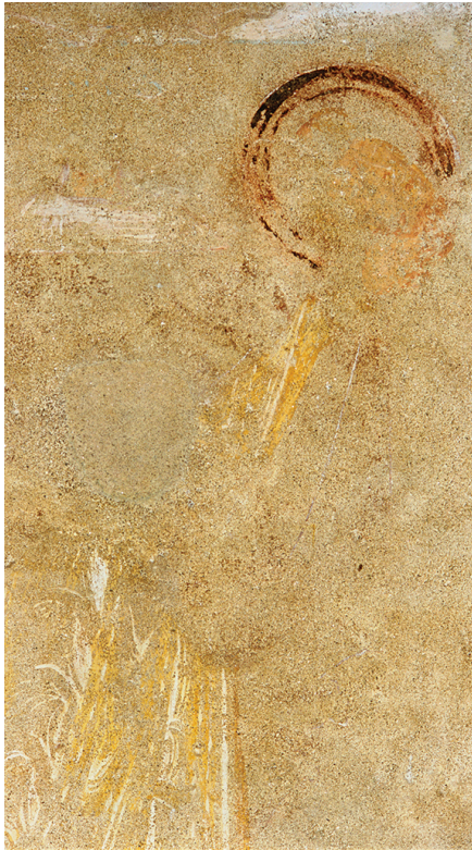
Fig. 4 - Saint-Savin-sur-Gartempe, tribune, céphalophorie de saint Denis, cl. Brouard/ CESC.M.