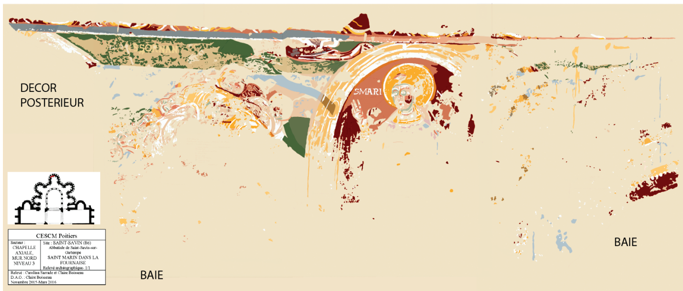
Fig. 1 - Saint-Savin-sur-Gartempe, chapelle axiale, scène de la fournaise, relevé Carolina Sarrade/Claire Boisseau/CESCM.