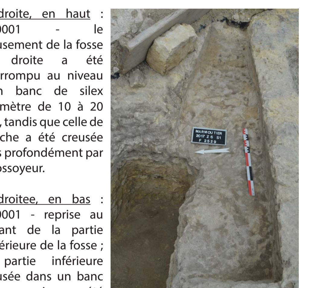
A droite, en haut : 37.0001 - le creusement de la fosse de droite a été interrompu au niveau d'un banc de silex (diamètre de 10 à 20 cm), tandis que celle de gauche a été creusée plus profondément par le fossoyeur.