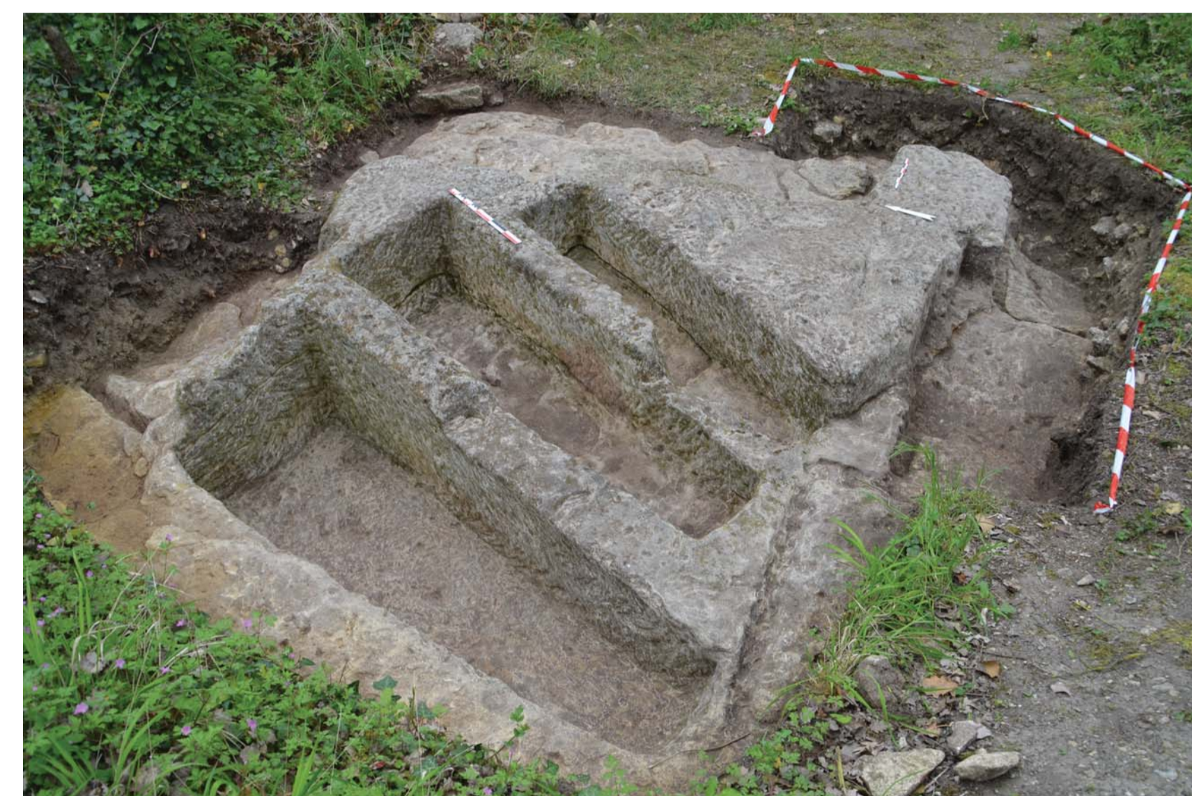
37.0025 - vue générale des tombes de Pont-Goubault dans la vallée de Courtineau (Saint-Epain) creusées sur un replat du rocher artificiel qui est le résultat de l'exploitation d'une carrière de sarcophages trapézoïdaux datable des 6 e -7 e s.

Le creusement se fait principalement au pic : des tranchées délimitent d'abord l'espace à excaver, le centre de la fosse est ensuite creusé sans technique particulière, tandis que le fond de la fosse est nivelé au fur et à mesure de l'excavation parfois à l'aide d'une polka. Dans de rares cas le creusement peut avoir été réalisé exclusivement à l'aide d'une polka et d'un taillant (certaines fosses du site 37.0001). Les parois sont régulièrement reprises au marteau taillant : il s'agit alors moins d'éliminer un gras de taille - les tranchées creusées au pic présentent des bords très réguliers - que d'améliorer sa facture en lui donnant un aspect lisse comme c'est le cas là encore pour les sarcophages de pierre du haut Moyen Âge.