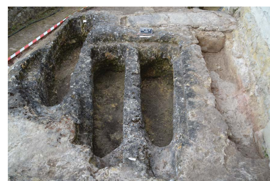
A gauche, en bas : 37.0001 - tombes jumelles partageant un même ressaut périphérique autour desquelles ont été creusées plusieurs fosses dont le positionnement est contraint par la place disponible à l'intérieur de l'oratoire troglodytique du haut Moyen Âge.