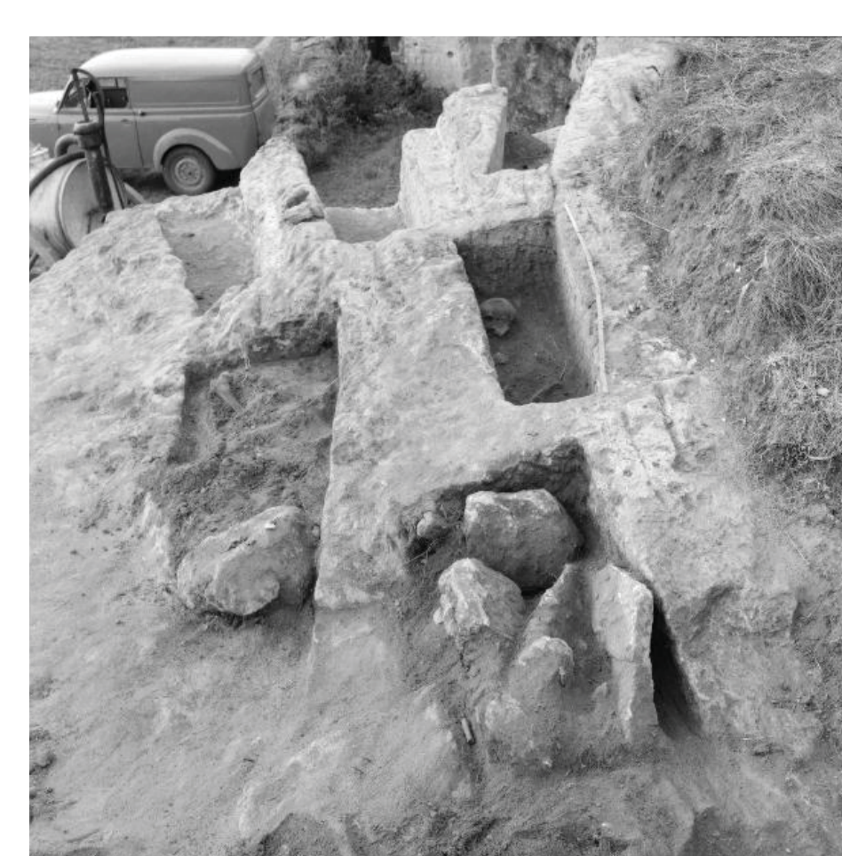
A gauche : 37.0016 - vue partielle de la nécropole contenant encore dans les années 1960 des sépultures en place et des débris de couverture.