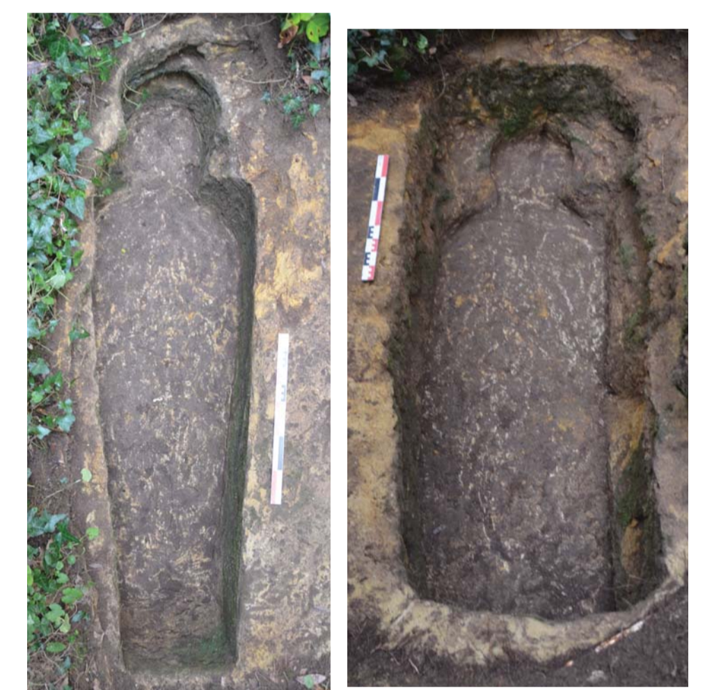
Au-dessus à gauche : 37.0002 - fosse anthropomorphe dans l'angle sud-ouest de la nef méridionale de la chapelle.