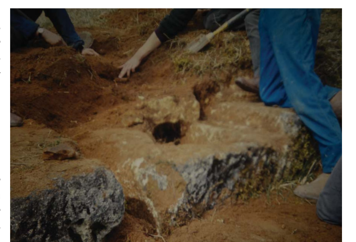
A droite : 37.0014 - tombe en cours de dégagement, dont on remarquera la feuillure périphérique et la dalle de couverture en place.