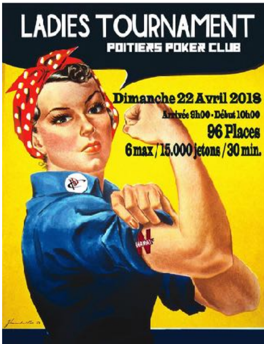
Image issue du site internet du PPC pour le tournoi réservé aux femmes

% d'hommes. Cette spécificité du poker est une réalité qui ne tient pas exclusivement de la pratique de club. L'ARJEL (2013) indique dans son étude que les joueuses de poker représentent 10 % de leur panel et qu'Aymeric Brody (2015) lors de son enquête n'obtient que 7,2 % de femmes. Ici, la surreprésentation des femmes par rapport aux autres enquêtes s'explique par une sensibilité plus grande à l'écrit des femmes (Lahire, p.578, 1995). A cela s'ajoute un faible panel (54 répondants) qui met en avant cette caractéristique de facilité d'écriture. Le fait que l'association organise un tournoi dédié exclusivement aux femmes pour promouvoir le poker auprès de « cette minorité » pousse peut-être aussi ces joueuses à vouloir sortir de l'invisible. Un autre élément qui amène de la visibilité à ces joueuses est la présence de leurs enfants pour une partie d'entre elles. Pourtant, l'échantillon recueilli montre que les joueuses ont proportionnellement moins d'enfants que les joueurs (0,7 enfant par joueuse contre 1,2 enfant par joueur). Cette observation indique le maintien d'une séparation