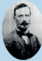
Portrait de Mouchot 14