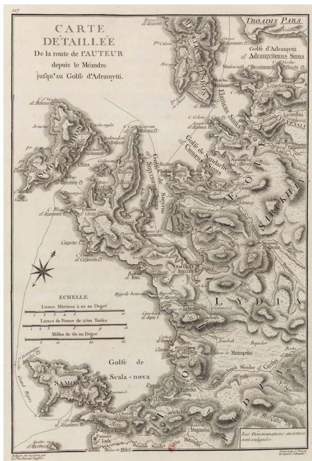
Figure 1. Carte des côtes d'Ionie et d'Éolide réalisée par le comte de Choiseul-Gouffier (Choiseul-Gouffier 1782, pl. 117).