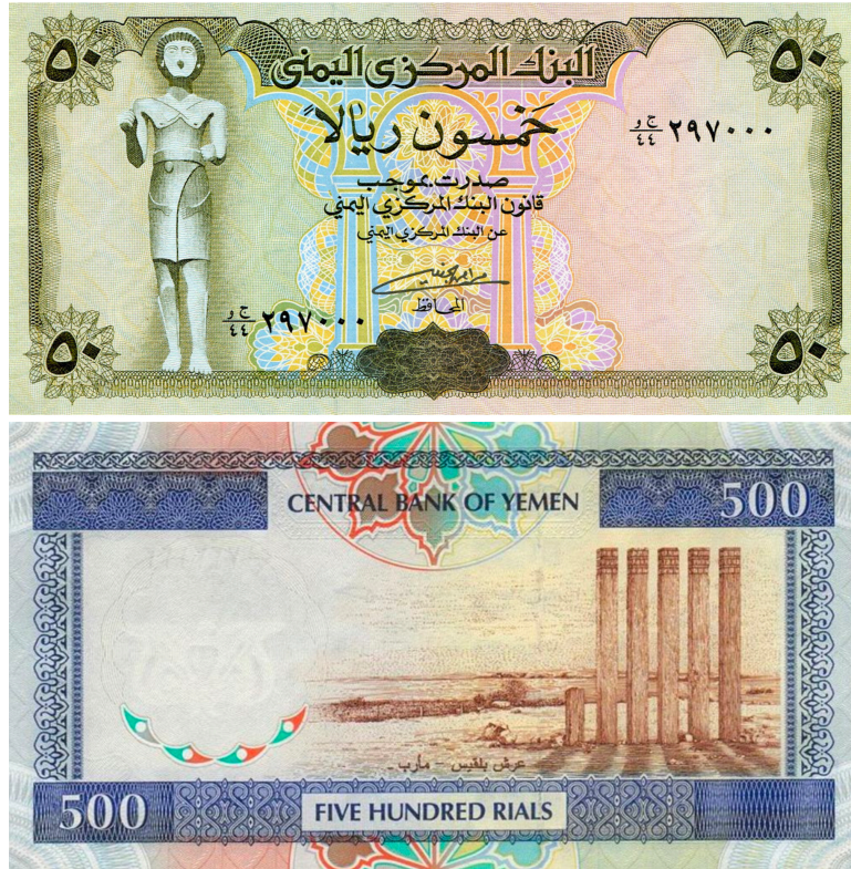
FIG. 13: Billets de banque de 50 et 500 riyals yéménites faisant figurer la statue antique en bronze de Ma'dikarib (haut) et les piliers du portique du temple Bar'an de Ma'rib (bas).