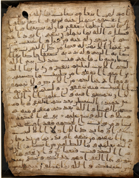
FIG. 7: Manuscrit du Coran (versets 2:265-271) sur palimpseste d'un Coran antérieur à 671, Sanaa (Behnam Sadeghi, Stanford University).