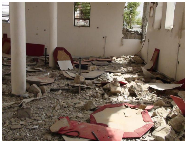
FIG. 22: Zinjibar, musée archéologique saccagé à la suite de la prise de la ville par le groupe islamiste Anṣār al-Sharia en 2011 (GOAM).

Dans les deux cas de figures, à Zinjibar comme à al-Mukalla, la présence de ces groupes islamistes s'est accompagnée de destructions (Table 2) : le musée archéologique récemment édifié à Zinjibar fut totalement saccagé (Figure 22) ; dans les environs d'al-Mukalla, ce sont les mausolées soufis qui furent tantôt dynamités, tantôt rasés au bulldozer (Figure 23). Parallèlement, des opérations localisées visant à détruire des monuments chrétiens ou soufis sont également attribuées à des groupes islamistes (incendie d'églises à Aden, destructions de mausolées à Aden, Lahj et aḍ-Ḍālī').