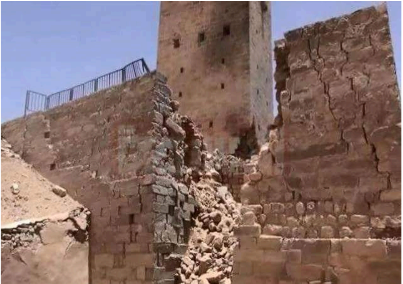
FIG. 20: Ma'rib, prise d'eau septentrionale du barrage antique endommagée par des bombardements aériens.

Certains des sites patrimoniaux détruits par des frappes aériennes sont éminemment symboliques et les raisons avancées de leur destruction — objectifs militaires — laissent parfois sceptique. On le voit ici, le patrimoine, pas plus que les civils, 20 ne compte guère dans ce conflit aux confins de l'Arabie et fermé aux regards extérieurs.