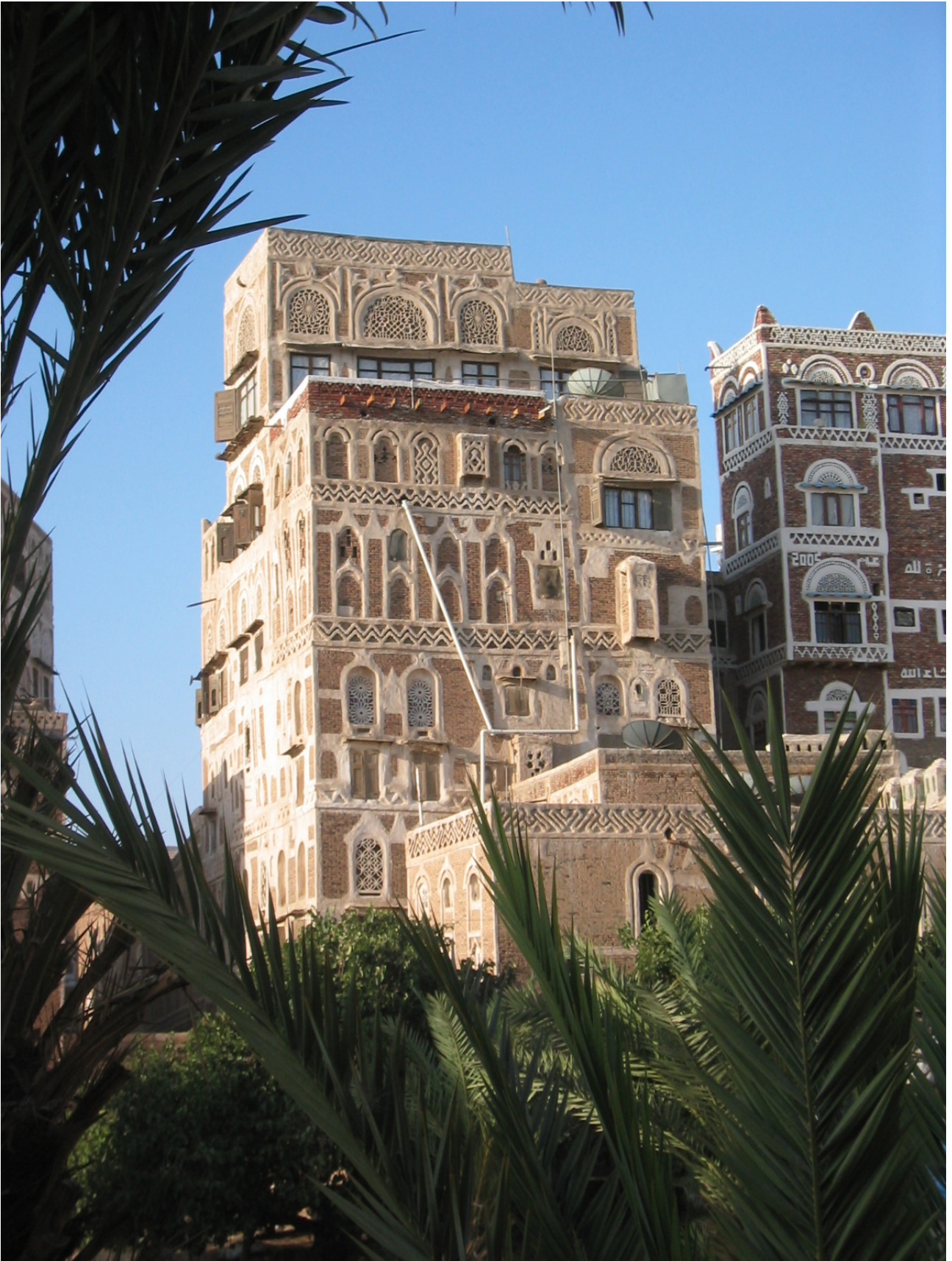
FIG. 11: Sanaa, vieille ville (J. Schiettecatte).