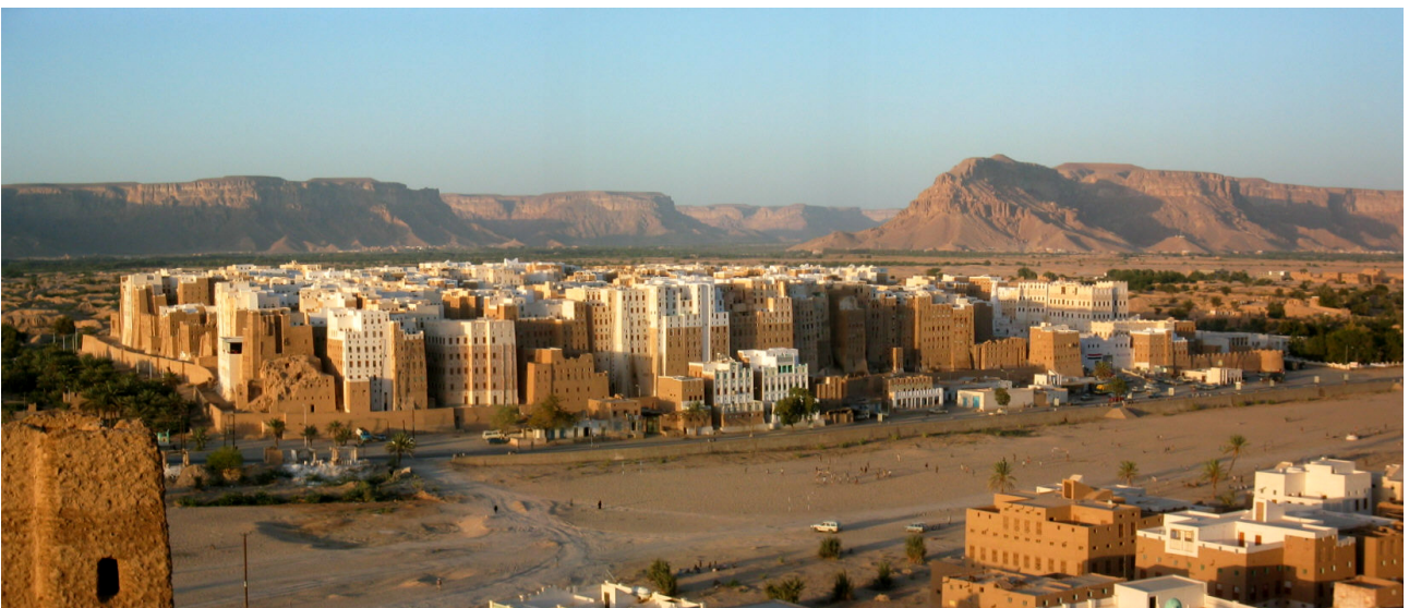
FIG. 10: Shibām, Ḥaḍramawt (J. Schiettecatte).