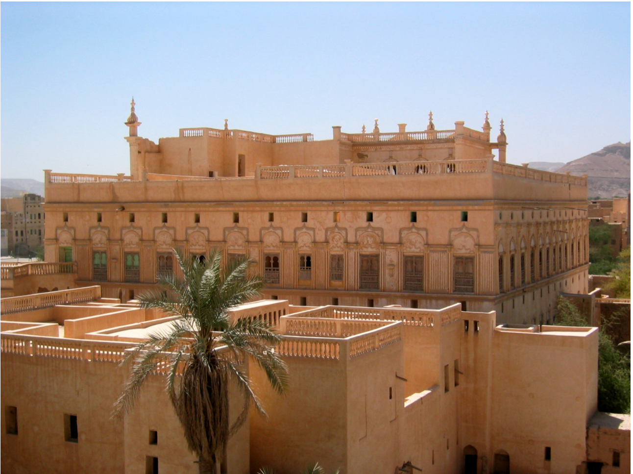
FIG. 9: Tarīm, palais de la famille al-Kāf (J. Schiettecatte).