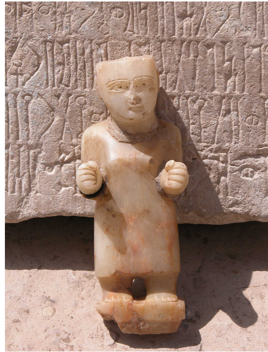
FIG. 5: Statue d'albâtre, musée de Lahj (J. Schiettecatte).