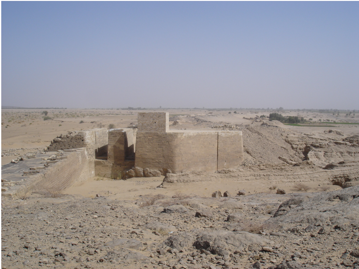
FIG. 3: Ma'rib, prise d'eau septentrionale du barrage antique.