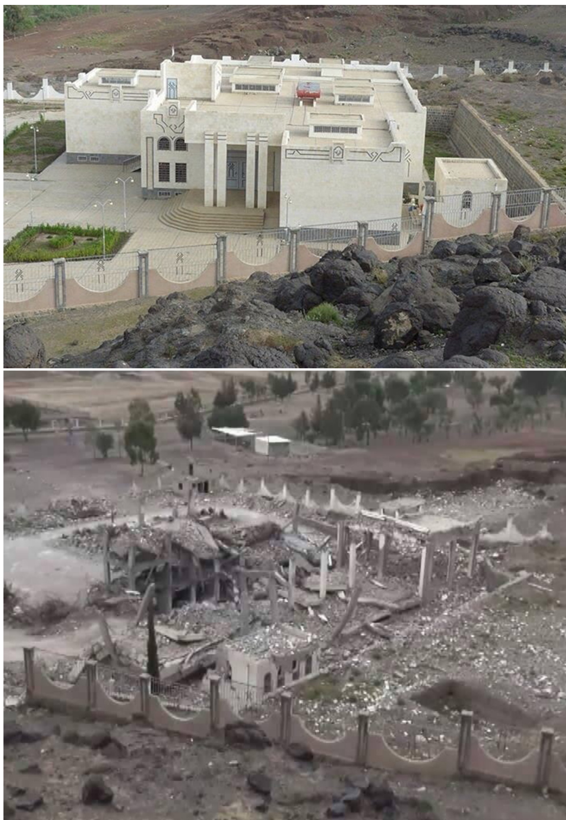
FIG. 19: Dhamār, musée archéologique après achèvement (haut) et après bombardement aérien (bas) (haut : GOAM, bas : Hussain Albukhaiti).