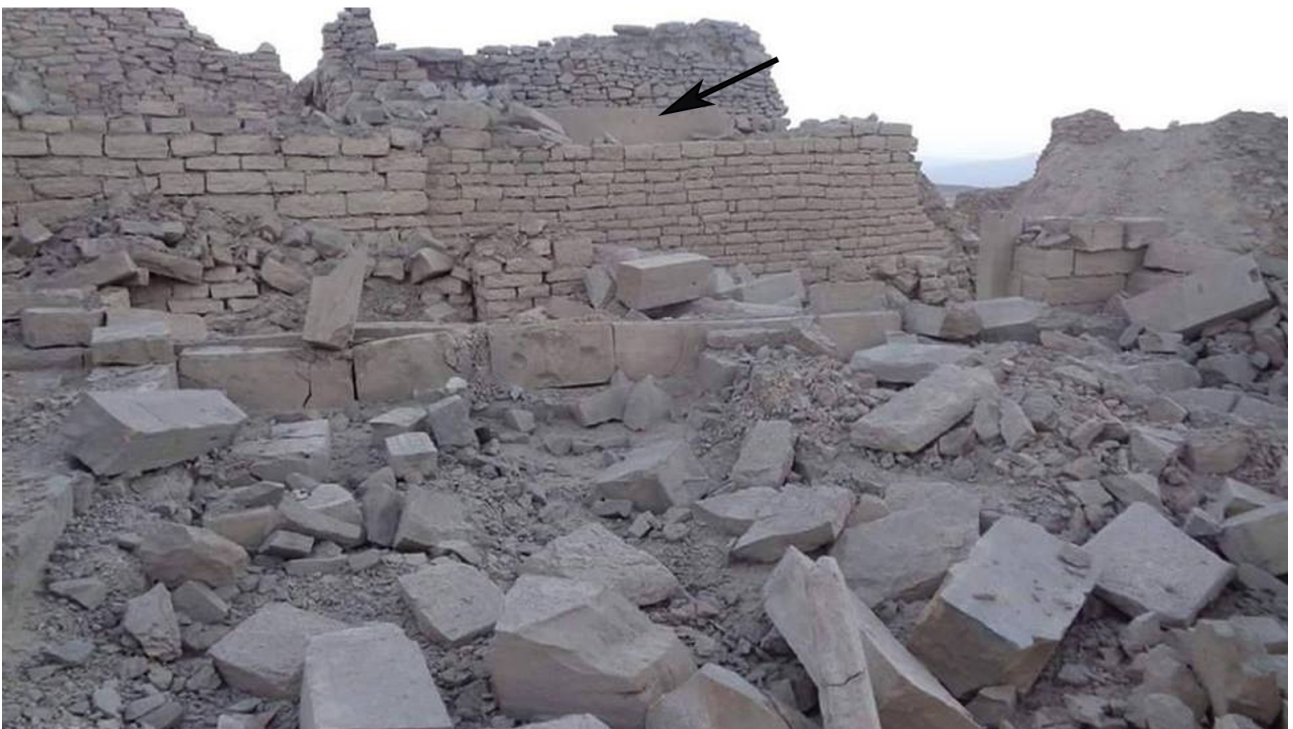
FIG. 21: Barāqish, temple de Nakrah après sa restauration en 2006 (haut) et après bombardement aérien en 2015 (bas). La flèche noire fournit un repère commun aux deux photographies.