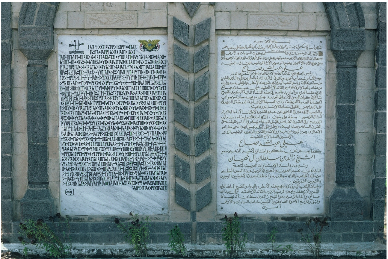
FIG. 14: Ma'rib, barrage moderne. Inscription commémorant la construction rédigée en arabe et en sabéen (Ch. J. Robin).