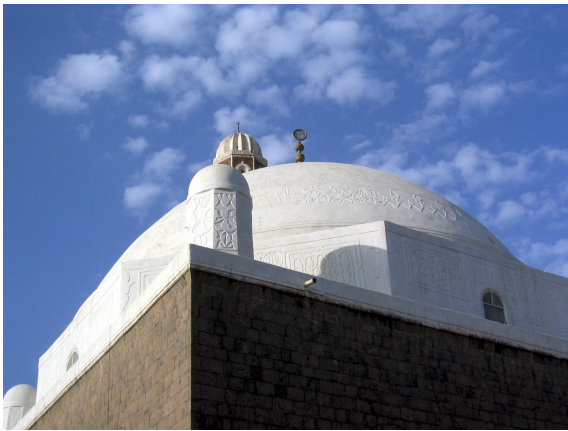
FIG. 8: Sanaa, vieille ville, mosquée 'Umar bin al-Khaṭṭāb.

En dépit des convergences culturelles observées aux différentes périodes et de la particularité géographique de la région au sein de la péninsule Arabique, l'unité du Yémen ne va pas de soi. Et pour cause, la région ne fut réellement politiquement unifiée qu'à trois reprises dans sa longue histoire : à l'apogée du royaume de Ḥimyar (IV e -VI e siècles après J.-C.) 12 puis de 1660 à 1682 sous la dynastie qāsimide 13 et enfin depuis 1990 à la suite de l'unification des République Arabe du Yémen (Nord Yémen) et République Démocratique Populaire du Yémen (Sud Yémen).