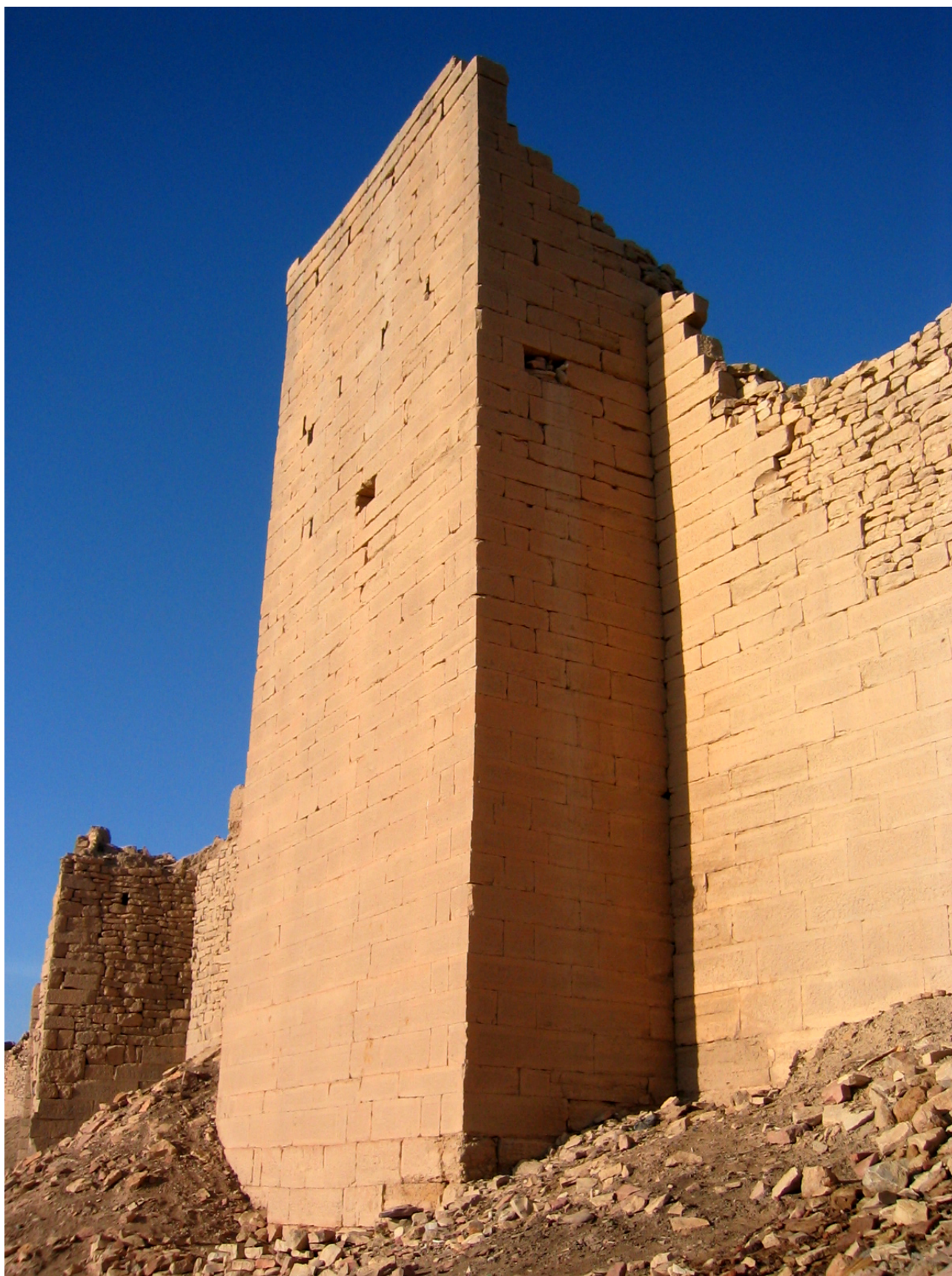
FIG. 2: Barāqish, rempart antique (J. Schiettecatte).