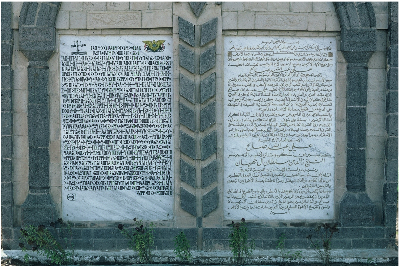
FIG. 14: Ma'rib, barrage moderne. Inscription commémorant la construction rédigée en arabe et en sabéen (Ch. J. Robin).