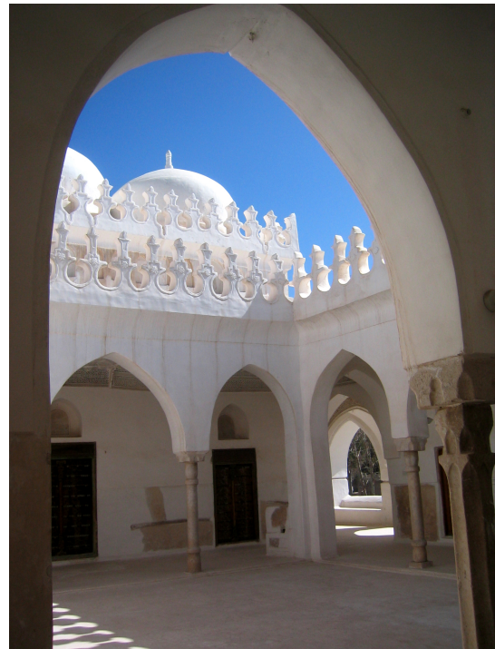
FIG. 6: Rada', cour intérieure de la mosquée dite 'Amriyya (J. Schiettecatte).