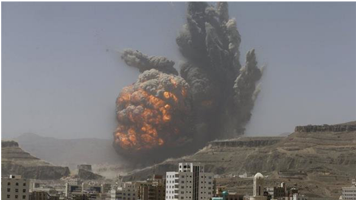
FIG. 18: Sanaa, violente explosion lors du bombardement du village de Fajj 'Attān, à proximité de la capitale.

Dès le mois de mai 2015, une liste de sites à sanctuariser constituée par un groupe d'archéologues français et allemands ayant œuvré au Yémen fut transmise à l'Unesco et remise par la responsable du bureau de Doha au quartier général des opérations militaires de la coalition à Riyad et au prince Sultan bin Salman al-Saoud, président de la Commission saoudienne du tourisme et du patrimoine national. La réponse délivrée en retour fut que toute cible abritant des combattants ou armes serait bombardée, quelle que soit sa nature, en violation de la Convention de La Haye pour la protection des biens culturels en cas de conflit armé à laquelle tous les États de la coalition ont adhéré (à l'exception des E.A.U.) 17 .