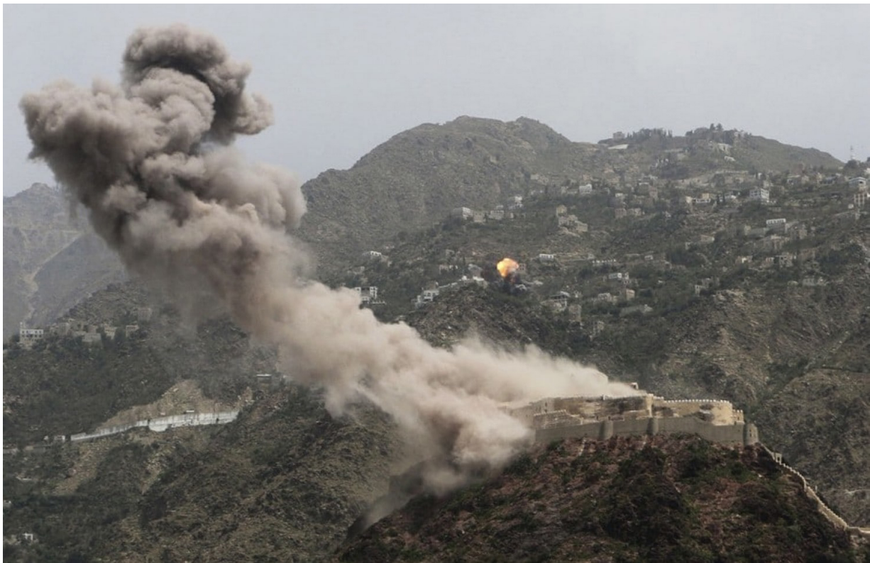
FIG. 15: Ta'izz, la citadelle al-Qāhira sous les bombardements aériens (Abdulnasser Alseddik/AP).

Les sites affectés sont de natures variées, incluant des cités