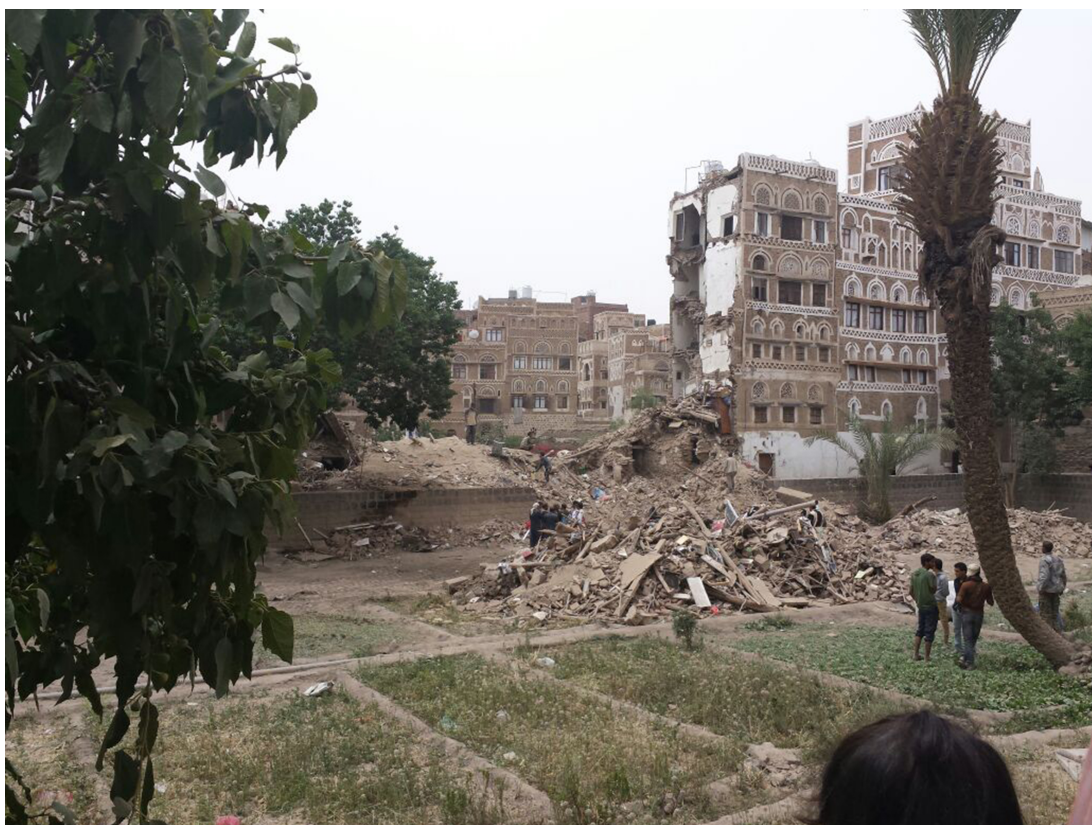
FIG. 16: Sanaa, maisons-tours de la vieille ville détruite par des bombardements aériens.