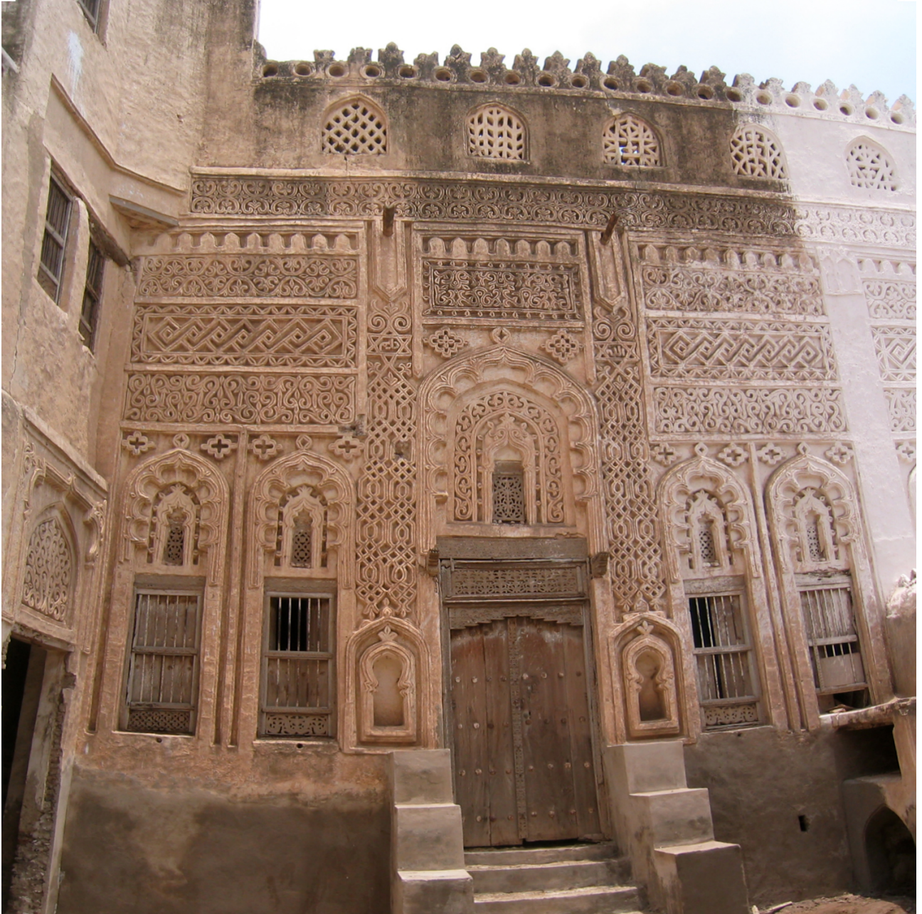
FIG. 12: Zabid, vieille ville (J. Schiettecatte).