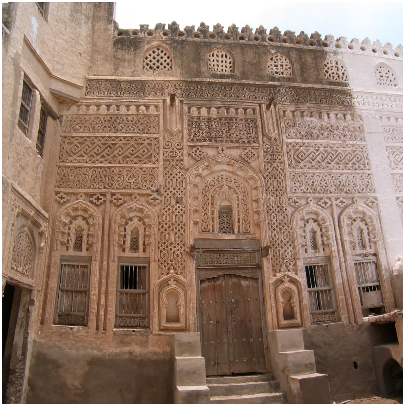
FIG. 12: Zabid, vieille ville (J. Schiettecatte).