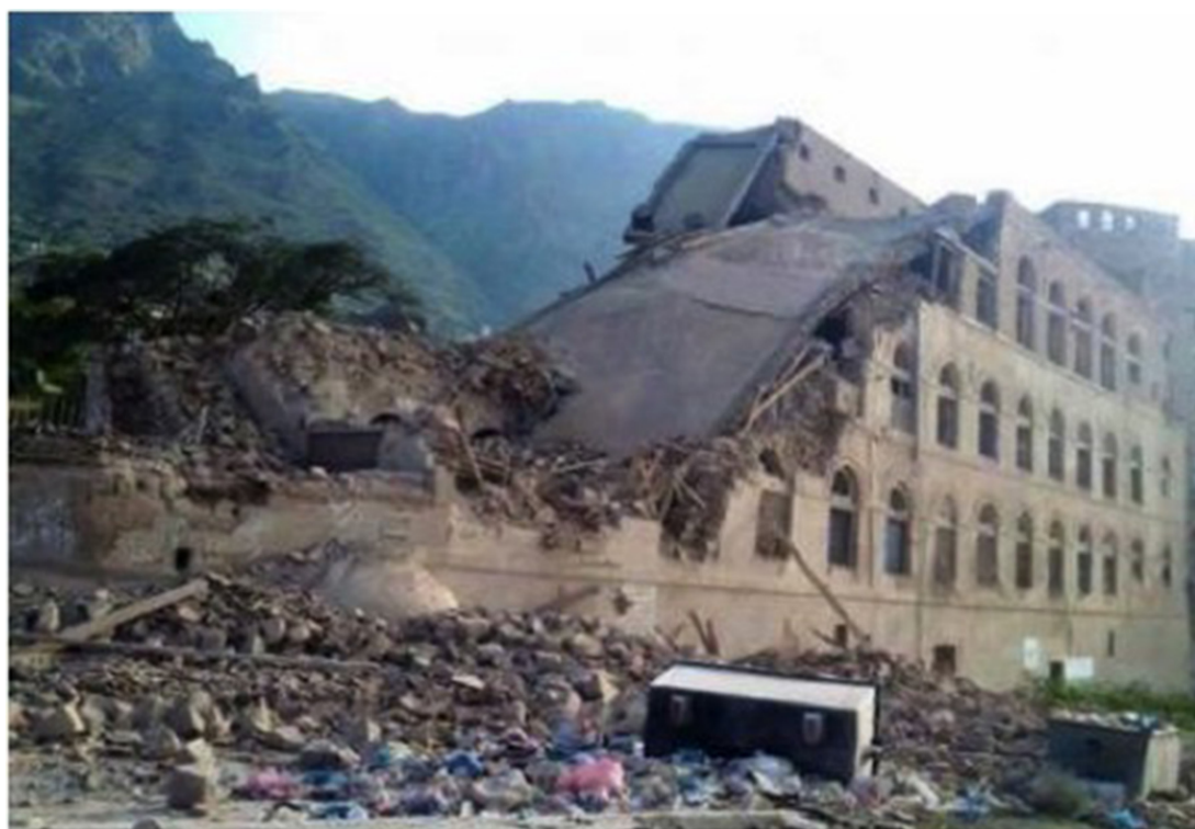
FIG. 17: Ta'izz, palais Sala détruit par des bombardements aériens (GOAM).