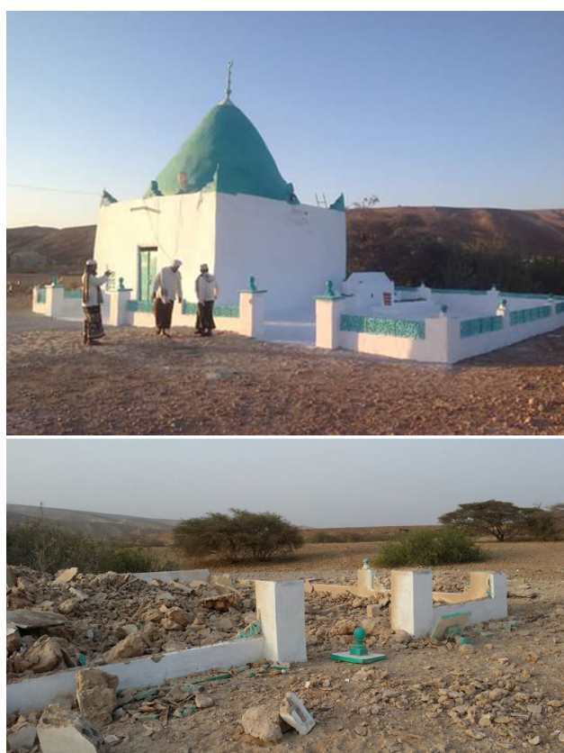
FIG. 23: Région d'al-Mukalla, mausolée soufi avant et après destruction par le groupe islamiste AQPA (GOAM).