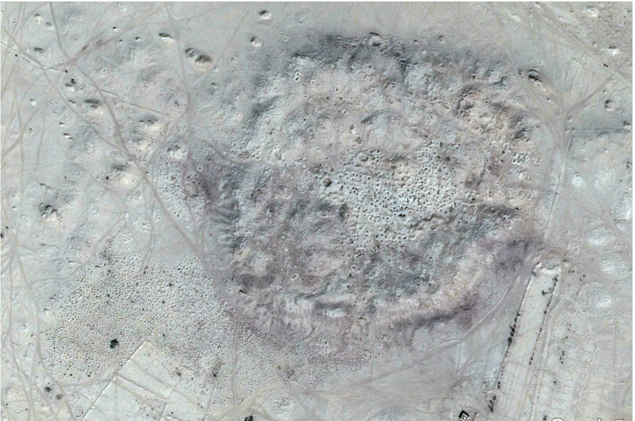
FIG. 24: As-Sawdā', vallée du Jawf, vue satellite du site et des puits de pillage intra et extra muros.