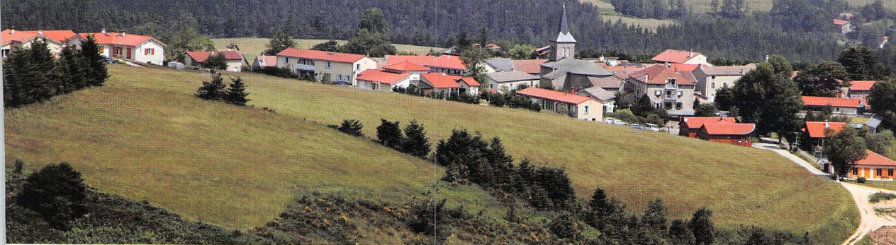
Ci-dessus, le village de Saint-Bonnet-Le-Froid, entre Velay et Vivarais.

mobilité professionnelle souhaitée ou contrainte, des ménages se domicilient sur les marchés de l'emploi les plus larges, ce qui avantage les métropoles. Enfin, la montée de l'espace-monde exige pour les entreprises des connexions multimodales à ce dernier, par exemple par le biais d'aéroports internationaux ou de bandes passantes toujours plus élevées dans les réseaux numériques, ce qui favorise justement les métropoles, où de tels équipements sont rapidement amortissables et donc, rentables.