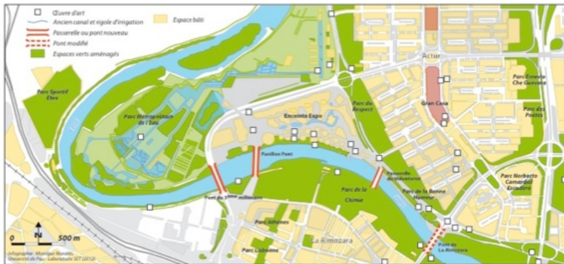
Figure 1 : L'aménagement des berges de l'Ebre, à Saragosse, dans le périmètre du méandre de Ranillas

Elle s'inscrit dans le contexte favorable marqué par la révision du Plan général d'urbanisme (PGOU) de Saragosse de 1986 14 et l'approbation, en 1998, du Plan stratégique pour Saragosse et son aire d'influence 15 . A une autre échelle, l'Etat central prévoit, à travers le Plan directeur d'infrastructures : 1993-2007 (1994), de consolider la fonction logistique de Saragosse en améliorant sa desserte autoroutière et en dotant la ville d'une position de carrefour dans le réseau ferroviaire à grande vitesse (construction de la LGV Madrid / Barcelone). Ces projets vont avoir des conséquences directes sur l'aménagement urbain dans la mesure où ils impliquent la création ou l'adaptation de la gare ferroviaire et une réflexion sur les tracés de la LGV dans et à proximité de la capitale aragonaise. Ils contribuent à légitimer les deux principaux axes stratégiques du projet urbain : « Saragosse, ville logistique et métropole régionale » et « Saragosse, ville attractive et durable ». L'idée d'intégration est déclinée à différentes échelles dans le plan stratégique : intégration à l'espace national grâce à des liaisons rapides, intégration à l'espace régional et métropolitain, intégration des différents quartiers de la ville mais aussi intégration de la ville à son environnement naturel. Concernant ce dernier volet, le