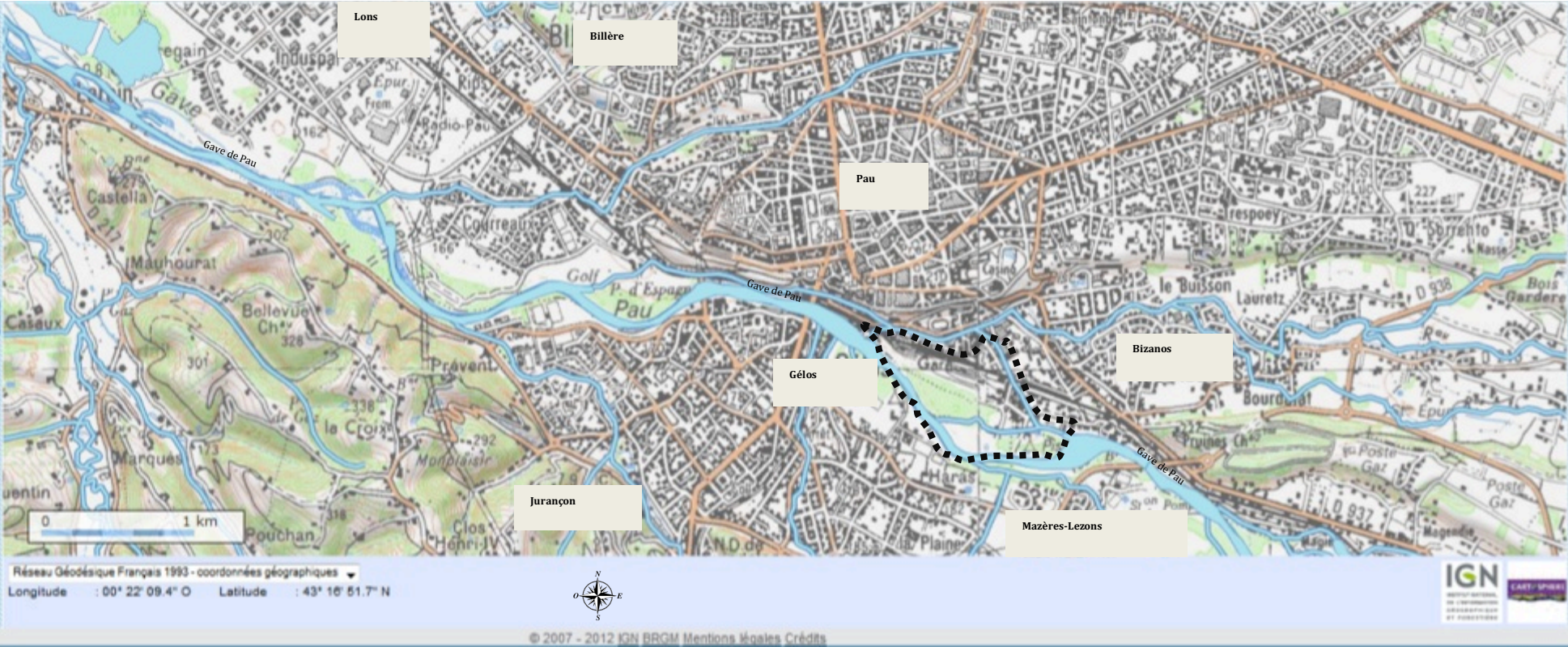
Figure 2 : localisation du projet Portes des Gaves, à Pau