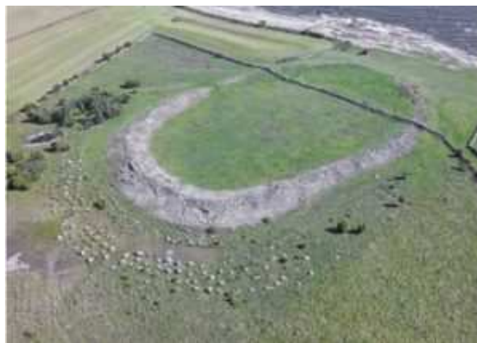
Sandby Borg, état actuel

Ce site de l'île toute proche d'Öland est daté du V e siècle de notre ère, soit l'ère des Migrations ( folkvandringstid ) selon la chronologie de l'âge du fer scandinave. Il est déjà surnommé « le petit Pompéi suédois » par certains ; en effet, les circonstances peu communes de l'abandon de ce site vers l'an 480, mises au jour depuis le début de la fouille en 2010, en font un site exceptionnel à tout point de vue, tant en ce qui concerne les vestiges mis au jour que les méthodes d'études employées et les questionnements historiques, éthiques et méthodologiques qui en découlent. La campagne 2017 a été effectuée entre le 18 septembre et le 14 octobre.