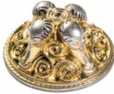
Pommeau d'épée, site de Sandby Borg.