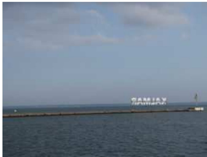
Le port de Kalmar et l'île d'Öland à l'horizon.

La ville de Kalmar, située dans la région historique du Småland au sud de la Suède, est une des plus anciennes villes du royaume. Port de la Baltique, elle possède notamment un château prestigieux où fut signée en 1397 l'union des royaumes de Suède, Norvège et Danemark, ainsi qu'un port industriel faisant face à l'île d'Öland, séparé par le détroit de Kalmar, (Kalmarsund). En tant que chef-lieu de comté ( län ), Kalmar possède également un institut dédié à l'étude, à la conservation et à la valorisation du patrimoine du comté tout entier : le Kalmar Länsmuseum.