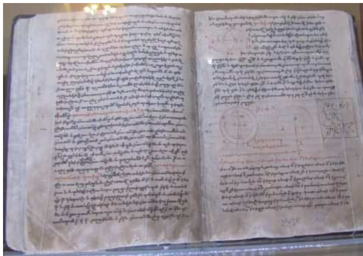
Géométrie d'Euclide, traduction du VII e siècle, manuscrit du XII e siècle.

Les sciences mathématiques, astronomiques et astrologiques sont également bien représentées dans les collections de manuscrits du Matenadaran, notamment les sciences exactes et les mathématiques, dans des traités souvent traduits du grec ou de l'arabe.