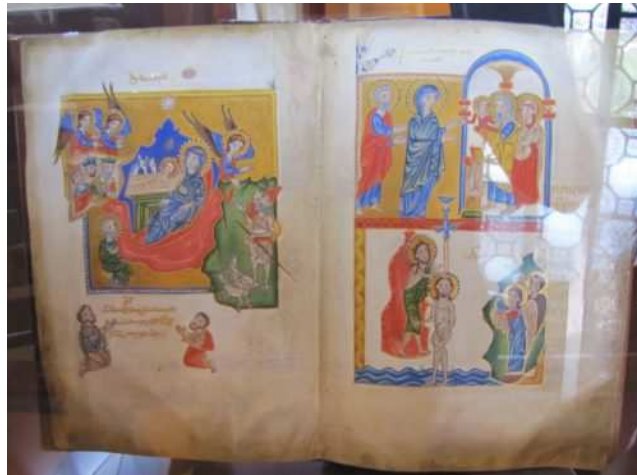
Évangile cilicien, XIII e siècle.

L'activité érudite des monastères arméniens médiévaux ne s'est pas limitée à la copie et à l'enluminure des textes saints. La mise par écrit de la langue arménienne dans son propre alphabet à partir du V e siècle engendre une vaste mouvement de copie et de traduction des œuvres de l'Antiquité classique, de Byzance et de l'Occident latin à partir du XII e siècle. Le Matenadaran présente des exemples de traductions, notamment un très bel exemplaire de l'Histoire d'Alexandre par Eusèbe de Césarée.