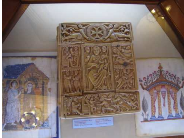
Évangiles d'Etchmiadzine.

Le Matenadaran permet d'ailleurs une plongée dans l'histoire de l'iconographie religieuse des différentes communautés arméniennes médiévales. Cet évangile du Vaspourakan (Վասպուրական), sur le haut-plateau arménien, est daté du XIII e siècle et figure l'entrée de Jésus à Jérusalem.