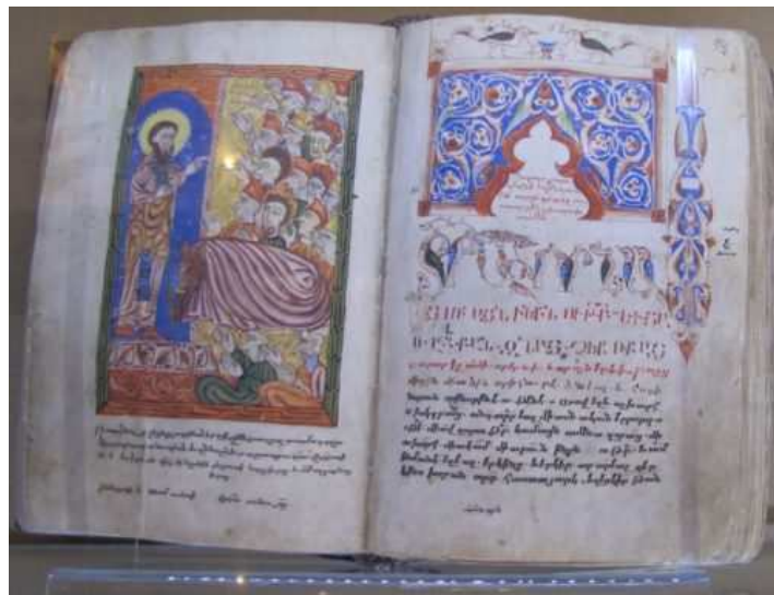
Agathange, histoire de l'Arménie, manuscrit de 1569.

Les œuvres arméniennes sont évidemment les plus représentées dans l'exposition et les collections. L'histoire, genre roi de la littérature arménienne médiévale, est représentée notamment grâce à des manuscrits des œuvres d'Agathange (Ագաթանգեղոս), et Eghiché (Եղիշէ) historiens arméniens du V e siècle. Ces auteurs sont respectivement les historiens de la conversion de l'Arménie au christianisme au IV e siècle et de la bataille d'Avarayr de 451 (Ավարայրի ճակատամարտ), défaite des Arméniens menés par le connétable Vardan Mamikonyan (Վարդան Բ Մամիկոնյան), si sanglante qu'elle dissuada les Perses d'imposer le mazdéisme aux Arméniens chrétiens.