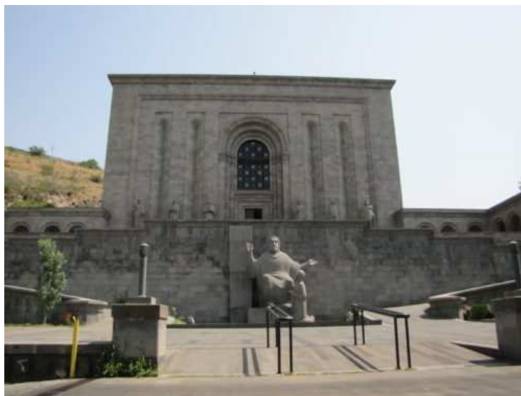
Le bâtiment principal du Matenadaran.

Au nord de la capitale arménienne, Erevan, se trouve un lieu à mi-chemin entre musée et bibliothèque. Et pour cause, le Matenadaran (մատենադարան), c'est à dire le “dépôt de manuscrits” en arménien ancien, relève des deux catégories : il s'agit du sanctuaire où sont conservés et partiellement exposés les trésors manuscrits de l'Arménie. Si le lieu est singulier, il succède pourtant à des dépôts ainsi nommés qui avaient été créés dans les monastères depuis la création de l'écriture arménienne au début du V e siècle de notre ère. Le bâtiment actuel est récent ; l'idée de rassembler les manuscrits en un même lieu date de l'ère soviétique. Le bâtiment de béton, dont l'allure trahit autant l'architecture fonctionnaliste soviétique que la référence aux églises médiévales arméniennes, est achevé en 1957 et inauguré en 1959. Au bout de la grande avenue portant son nom, la statue de Mesrop Machtots, (Մեսրոպ Մաշտոց), inventeur révérend de l'alphabet arménien aux alentours de 405, accueille le visiteur.