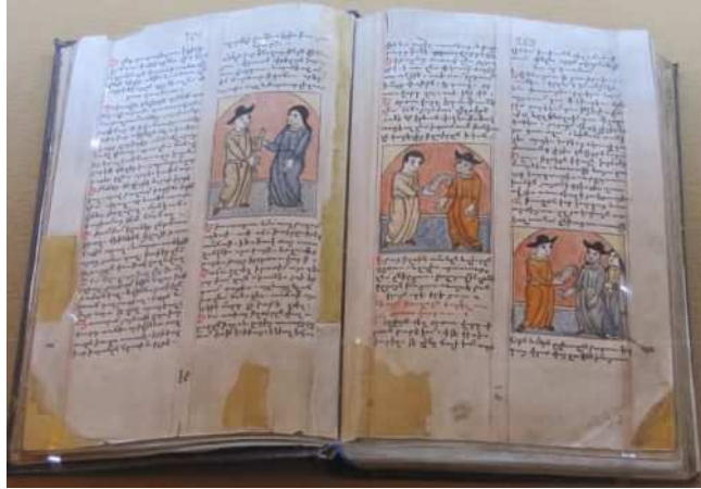
Histoire du chevalier Paris et de la belle Vienne, roman traduit du français en 1578.

Les œuvres arméniennes sont évidemment les plus représentées dans l'exposition et les collections. L'histoire, genre roi de la littérature arménienne médiévale, est représentée notamment grâce à des manuscrits des œuvres d'Agathange (Ագաթանգեղոս), et Eghiché (Եղիշէ) historiens arméniens du V e siècle. Ces auteurs sont respectivement les historiens de la conversion de l'Arménie au christianisme au IV e siècle et de la bataille d'Avarayr de 451 (Ավարայրի ճակատամարտ), défaite des Arméniens menés par le connétable Vardan Mamikonyan (Վարդան Բ Մամիկոնյան), si sanglante qu'elle dissuada les Perses d'imposer le mazdéisme aux Arméniens chrétiens.