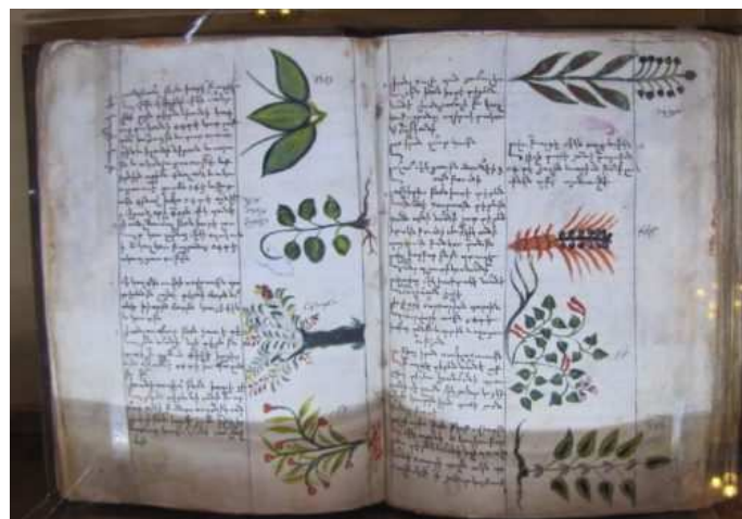
Traité des herbes médicinales, manuscrit du XVIII e siècle.

En définitive, les collections du Matenadaran témoignent de l'exceptionnel dynamisme intellectuel de la culture arménienne médiévale et moderne, culture pourtant fort méconnue en Europe, où les arménologues se font rares. Elle est pourtant fondamentale, tant par sa réception des œuvres antiques, arabes et occidentales que par son apport propre à la science dans de nombreux domaines. En somme, de nombreux manuscrits du Matenadaran attendent encore les chercheurs !