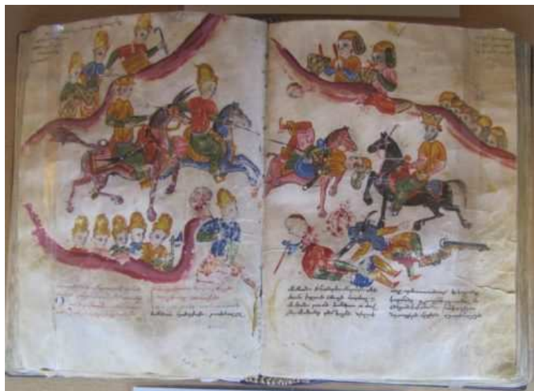
Histoire d'Alexandre. Traduit du grec au Ve siècle, manuscrit du XVII e siècle.

L'activité érudite des monastères arméniens médiévaux ne s'est pas limitée à la copie et à l'enluminure des textes saints. La mise par écrit de la langue arménienne dans son propre alphabet à partir du V e siècle engendre une vaste mouvement de copie et de traduction des œuvres de l'Antiquité classique, de Byzance et de l'Occident latin à partir du XII e siècle. Le Matenadaran présente des exemples de traductions, notamment un très bel exemplaire de l'Histoire d'Alexandre par Eusèbe de Césarée.