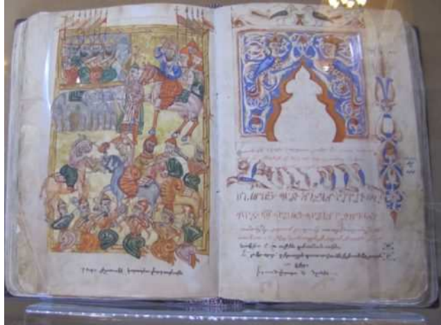
Eghiché, histoire de Vardan Mamikonyan et des guerres arméniennes, manuscrit de 1569.

Les sciences mathématiques, astronomiques et astrologiques sont également bien représentées dans les collections de manuscrits du Matenadaran, notamment les sciences exactes et les mathématiques, dans des traités souvent traduits du grec ou de l'arabe.