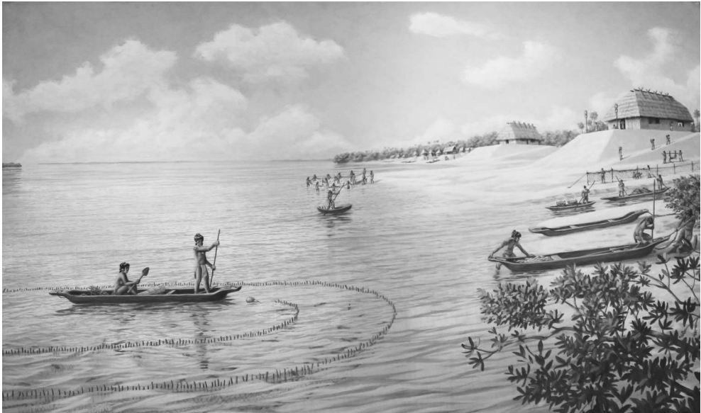
Figure 2. - « Reconstitution d'un village Calusa », dessin de David Meo.

lequel le vassal du Moyen Âge prêtait hommage à son suzerain. Lorsqu'il décédait, certains des subalternes étaient mis à mort à seule fin de l'accompagner dans la tombe, une pratique caractéristique de sociétés non étatiques nettement hiérarchisées 10 . Enfin, entre ce chef et la masse des gens ordinaires, une strate intermédiaire de « nobles » occupait des fonctions politico-religieuses sur lesquelles nous sommes assez mal renseignés. Au bas de l'échelle sociale, se trouvait un groupe de dépendants, captifs de guerre, possiblement esclaves.