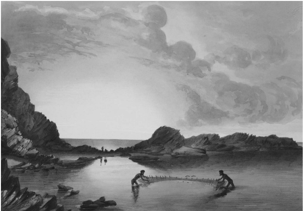
Figure 5. - Aborigènes pêchant au filet à Rapid Bay, Australie du sud (illustration des années 1840).

conservé au South Australian Museum, qui mesure 52 m x 0,8 m, contient environ 350 m d'une corde de 5 mm de diamètre. Sur la base des informations données par W. Roth, son seul tressage nécessitait sans doute trois à quatre semaines de travail collectif. Les filets à oiseaux étaient encore plus exigeants, en raison de la finesse de leurs mailles. Un filet de 18 mètres sur 12, tel que le décrit Eyre 51 , aux mailles de 5 cm, représentait environ 8000 mètres de corde ! Celle-ci provenait de tendons ou de poils animaux, mais surtout de diverses fibres végétales (joncs, kurrajong, hibiscus...) et exigeait un long processus de traitement : il fallait souvent, entre autres, les tremper, les carder à la main ou aux dents, les sécher, les fouler, les peler et les mâcher. L'extraction de la fibre nécessitait parfois une cuisson ou une macération. Le