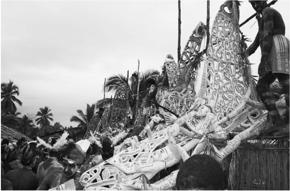
Figure 3. - « Une cérémonie d'inauguration de bisj pole (mâts gravés) », photographie de 2007, Wikipedia.

équation que l'exploit guerrier se voit transformé en capacité à procéder à des distributions massives de nourriture, et par conséquent en pouvoir politique 29 . »