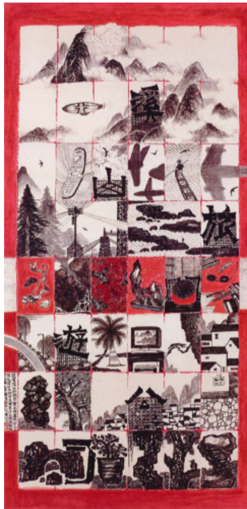
Ill. 1 Hommage à « Voyageurs par monts et rivières » de Fan Kuan n°5 (溪山行旅 Xi shan xing lü)(2000 ; 137 x 69 cm).

Lo Ch'ing nous invite ainsi à reconsidérer la relation entre homme et nature aujourd'hui. Ces aspects de la vie contemporaine nous séparent-ils de la nature ou nous en rapprochent-ils ? En quoi notre expérience diffère-t-elle de celle des montagnards de Fan Kuan? Sans doute l'artiste veut-il opposer la sérénité d'autrefois, qui permettait de s'imprégner et de se ressourcer dans la nature, au chaos contemporain d'une vie fragmentée, entrecoupée. Cette existence trépidante laisse-t-elle le temps de méditer et d'évoluer à son aise (遊 you) dans un paysage ? Peut-on « réactiver sa tension vitale » lorsqu'on se livre à des voyages effrénés (旅遊 lüyou) ? Ces œuvres suggèrent que nous sommes sans cesse en mouvement, et que l'excessive mobilité et le culte de la vitesse propres à notre époque « post-industrialisée » modifient notre perception de la nature et notre rapport au monde.