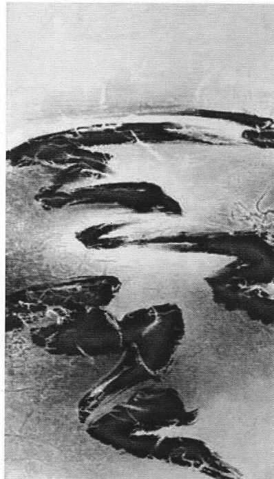
Photo 5 : Liu Kuo-Sung (1932-), Flux rythmique , encre sur papier, 134,8 × 77,5 cm, Musée des beaux-arts de Taipei.