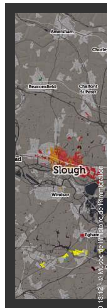
► Tableau : répartition géographique de la population du Royaume Uni en 2017

En 2004, puis en 2007, l'élargissement de l'Union aux pays de l'Europe de l'Est étend le bassin d'origine de l'immigration. La Grande-Bretagne est, avec l'Irlande et la Norvège, l'un des trois pays qui n'imposent pas aux nouveaux entrants une période de transition pour la mise en œuvre effective de la liberté de circulation. Les Polonais en sont les principaux bénéficiaires. La Grande-Bretagne est un pays de destination important pour eux depuis la Seconde Guerre mondiale. De nombreux réfugiés politiques y ont trouvé asile jusque dans les années 1980. La nouvelle vague migratoire est de nature et d'ampleur tout à fait différente puisqu'il s'agit d'une immigration de travail temporaire.