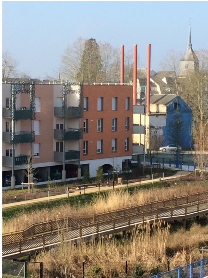
Photographie : Eric Daniel-Lacombe Architecte

Dans le cadre du projet Angers Rives Nouvelles, l'équipe Grether proposait de traiter l'interface entre la ville et la Maine sous forme de plissés grâce à un système de remblai-déblai et à la création d'un grand parc urbain fluvial. Mise hors d'eau du quartier par rehaussement du terrain naturel et ouverture de la ville sur sa rivière pour affirmer la présence sensible de l'eau étaient donc mobilisées conjointement. Au Havre, l'agence Obras a conçu un « jardin fluvial » pour assurer le traitement paysager de l'interface ville-port, là encore afin d'ouvrir la ville sur ses bassins et affirmer cette présence sensible de l'eau. À Romorantin, l'architecte concepteur du quartier fait appel à un paysagiste reconnu, Bernard Lassus, afin de proposer un grand parc public évoquant de manière sensible cette présence de l'eau au cœur même du quartier Matra (Fig. 3).