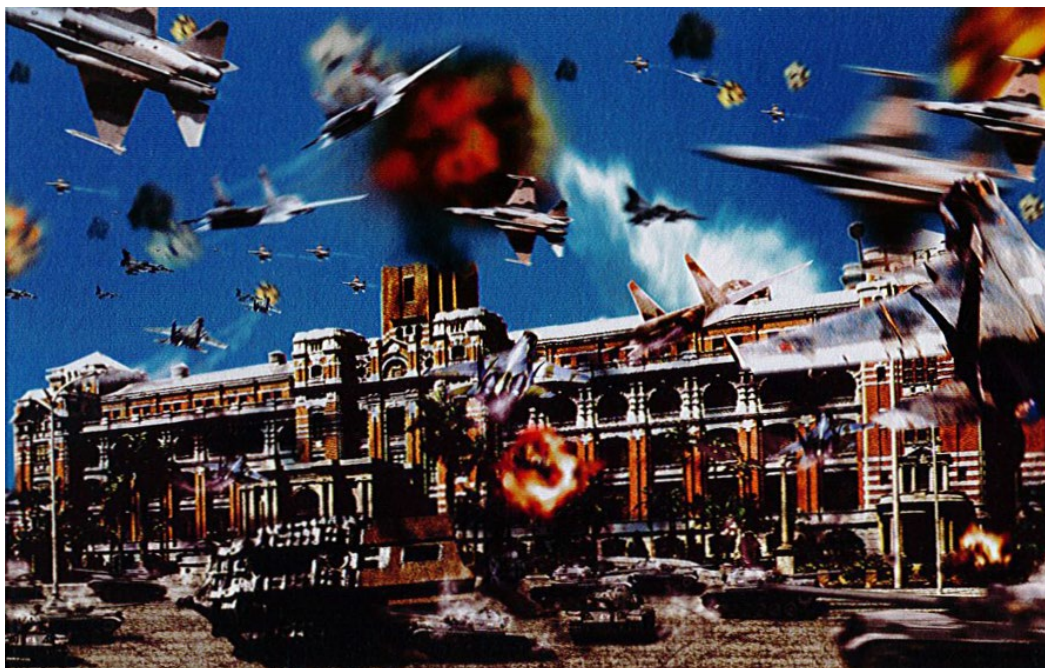
Mei Dean-E Outside-Field Battle II [Presidential palace], image numérique, 90 x 60 x 20 cm, 2002

Mei Dean-E semble ici questionner la politique du président indépendantiste Chen Shuibian, considérée comme provocatrice par la Chine, et qui a conduit celle-ci à renforcer encore la politique très dure qu'elle avait envers son prédécesseur Lee Teng-hui. L'artiste envisage la possibilité d'une guerre de la Chine envers Taiwan en réponse à l'audacieuse déclaration de Chen Shuibian selon laquelle il s'agirait non pas d'une guerre civile, mais d'un conflit entre deux nations. Sans doute l'artiste, en parodiant les films de guerre américains et la presse de reportage, veut-il montrer par cette mise en scène paradoxale du concept de « bataille extra-territoriale » lancé par le président Chen Shuibian la fragilité des relations entre les deux rives. Le titre et les images se contredisent discrètement puisque l'artiste, dans ces visions apocalyptiques, choquantes, situe ironiquement les batailles sur le sol taiwanais. Le pouvoir des images, renforcé par le poids des mots, se manifeste pleinement ici.