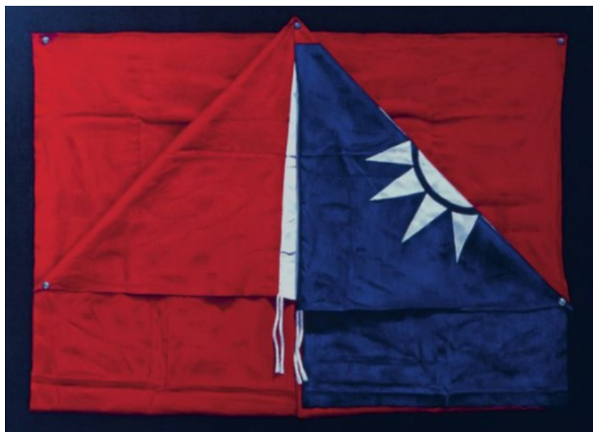
Mei Dean-E, National Flag, huile sur toile, 64 x 84 cm, 1982

grinçant mais jamais vulgaire, et qui ne donne aucune réponse à la question que pose l'artiste par sa provocation. C'est l'œuvre qui nous aura mis sur ses traces, dès 1992.