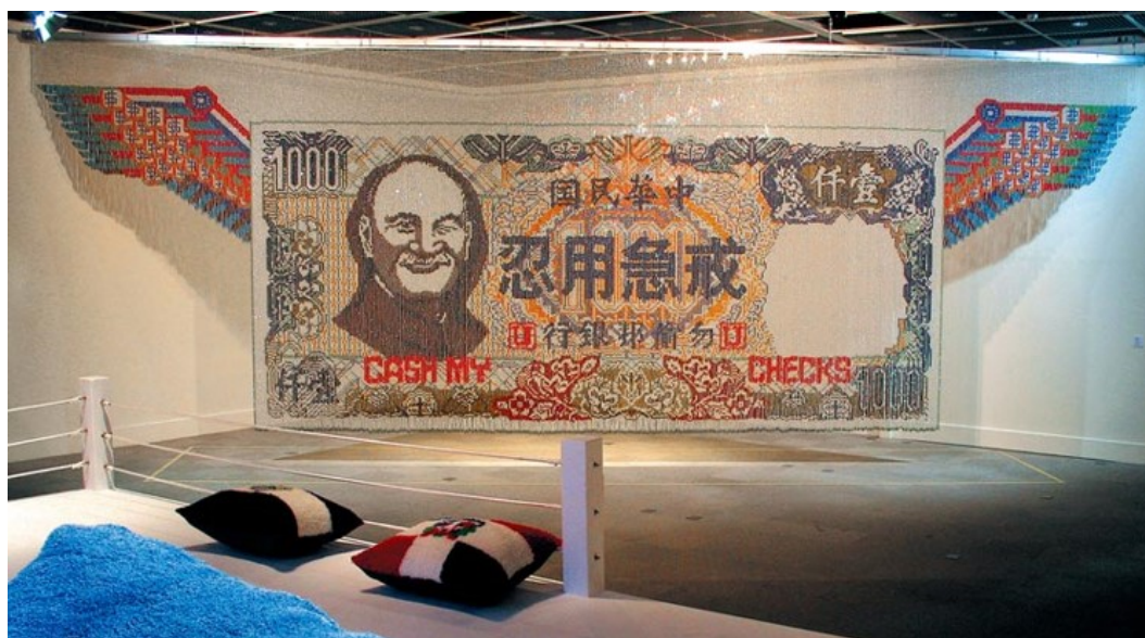
Mei Dean-E Don't Rush, Be Patient , matériaux mixtes, 410 x 1286 x 5 cm, 1998

ivrognes » (小心醉鬼 Xiaoxin zuigui , huile sur toile, triangle d'un mètre de côté, 1993) transforme Johnny Walker, logo de la célèbre marque de whisky écossais, en panneau routier de signalisation de passage pour piétons, jouant sur le sens du nom Walker (« marcheur »). Il fait apparaître la silhouette bien connue sur une peinture dont le titre raille les buveurs d'alcool en les traitant d'ivrognes. Ainsi, dès son séjour aux États-Unis, Mei Dean-E s'intéresse aux icônes de la société consumériste et porte un regard acéré sur la « société du spectacle », dont il s'approprie les instruments pour mieux les mettre en évidence. Par la suite, il collectionnera les objets et produits en tous genres de la période coloniale et de l'après-guerre à Taiwan, dont il fera des ready-mades , témoignant du même intérêt pour le pouvoir des industries commerciales et leur impact sur les goûts et les modes, mêlant en ceci son analyse de la société de consommation à son retour vers le passé de sa jeunesse, dans ses installations (comme ce fut le cas dans la Rétrospective ) aux allures de petits musées d'objets du quotidien d'antan, musées empreints de nostalgie. La dénonciation simultanée de la société de consommation et la nostalgie pour les objets d'autrefois qu'elle a précisément produits ne surprennent guère, elles sont même une dimension du mouvement rétro 37 .