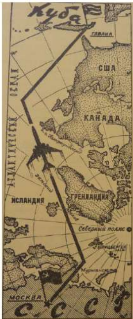
Pravda , 9 janvier 1963.

La ligne Moscou-La Havane fut inaugurée en janvier 1963 en grande pompe. Après une escale à Mourmansk, la ligne suivait une route entre l'Islande et le Groenland qui permettait, en survolant les eaux internationales, de s'affranchir des escales et des espaces aériens souverains. L'exploit technique unanimement salué comme tel dans la presse internationale en faisait la plus longue ligne sans escale du monde. En diminuant le nombre de passagers de 170 à 60, et en embarquant plusieurs réservoirs de fuel en plus, le Tu-114 parvenait à parcourir 10 800 km (pour 11 200 km de rayon maximal) en 14 h. C'est cet exploit géographique que représentait la Pravda le 8 janvier 1963 avec une carte de ce parcours à travers « 120 méridiens et 49 parallèles » qui matérialisait l'état d'avancement de la technologie aéronautique soviétique, sans souligner le choix politique de prendre des risques en termes de sécurité et de rentabilité pour aider Cuba coûte que coûte.