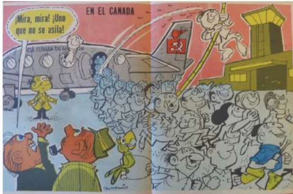
Zig-Zag libre, 7 novembre 1964, n°122, pp. 9-10.

là où il serait le moins facile de quitter l'avion pour demander asile. Toutefois, ce transfert suscita également l'opposition de certains secteurs de l'exil cubain aux États-Unis. Le dirigeant du Movimiento Unidad Revolucionaria , Mario Seiglie Montoro, s'adressa par courrier à Salazar afin de l'avertir des risques que le « castro-communisme et les activités subversives contre le Portugal » faisaient peser aux Açores alors que les fonctionnaires de l'aéroport accueillaient et rendaient service à la Cubana sans broncher 75 .