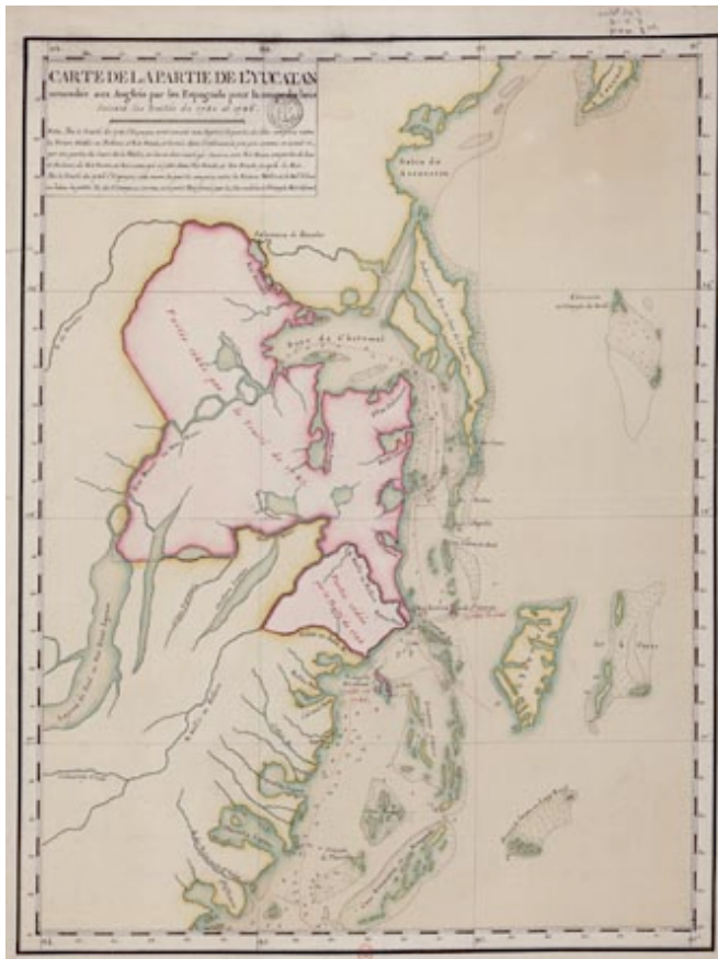
Figure 2, 1790, Carte de la partie de l'Yucatan concédée aux Anglois par les Espagnols pour la coupe des bois, suivant les Traités de 1783 et 1786.

Realizado algunos años antes, un mapa similar en su objetivo (asentar la existencia de Honduras Británica y de los territorios concedidos para el corte de madera) es sin embargo mucho más preciso y de factura diferente (Figura 3). Realizado por el geógrafo británico William Faden 17 (“impreso por William Faden geógrafo para el Rey, Feb.Ist.1787”), el mapa es excepcional por varias razones. Está oficialmente firmado “ Por un Bayman ”, siendo así el primer mapa elaborado – aunque firmado por otro – por una persona que se declara oriundo del lugar. Es un documento complejo que, además del mapa como argumento central, contiene otros elementos que analizaremos a continuación.