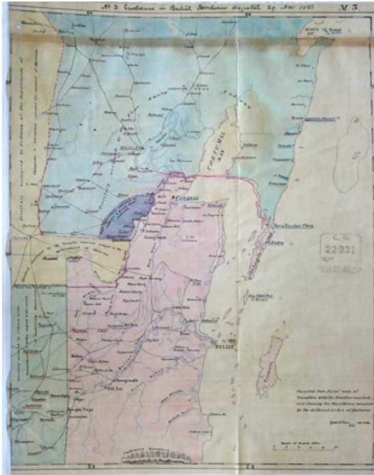
Figura 4a, 1886, British Honduras (now Belize) (...) showing areas in the Yucatan occupied by different native American nations. Compiled (...)by G[ordon] Allen, Surveyor General, , The National Archives, Kew

carta del gobernador. Una mención manuscrita indica que se trata de un mapa “compilado a partir del mapa de Yucatan de Pérez con el trazo de la frontera, mostrando los territorios ocupados por las distintas tribus de indios” 39 . La diferencia de vocabulario entre « Tribus » (en la mención manuscrita) y « Naciones » (en el título) no es explícita. Se nota en todo caso el estatuto eventualmente elevado –aunque no estabilizado– que detentan los “indios” en sus negociaciones con los británicos 40 .