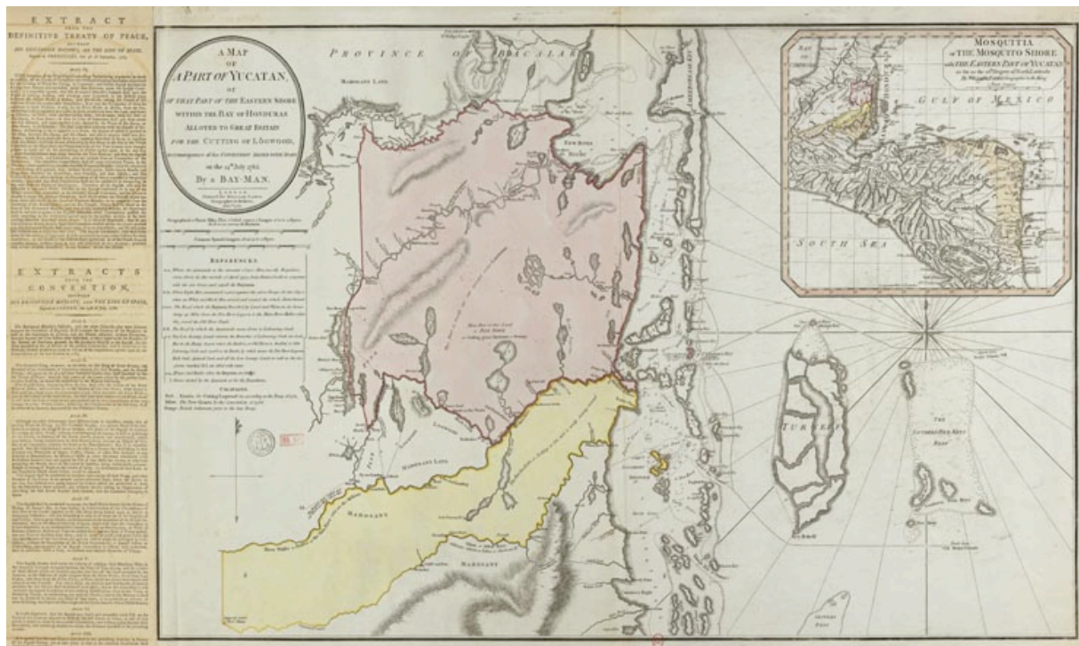
Figura 3, 1787, A map of part of Yucatan...alloted to Great Britain for the cutting of Logwood, by Faden, William., BNF

Sobre una banda vertical a la izquierda, el documento incluye largos extractos del texto del Tratado de 1783 y de la Convención de 1786, explicando por si fuera necesario, el primer objetivo del mapa: legitimar la existencia de un territorio a través de textos oficiales y en consecuencia, aquella de los settlers y de sus actividades. Un código de color refuerza la lectura, marcando con trazos gruesos los límites acordados : en rojo, los “límites para cortar palo de Campeche (logwood) acordados por el Tratado de 1783” ; en amarillo “las nuevas concesiones según la Convención de 1786” y en color naranja “El Settlement británico anterior al último tratado” 18 .