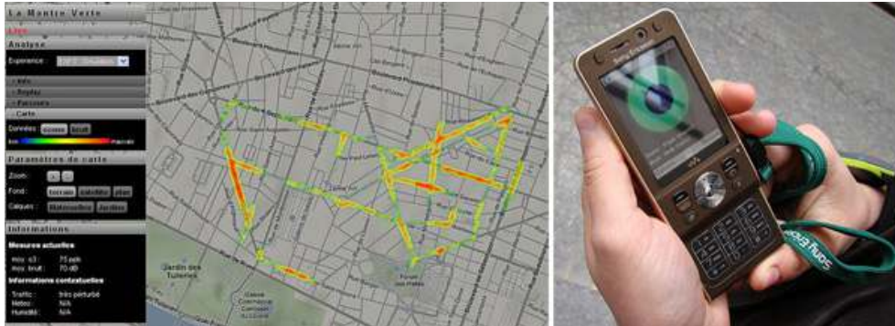
Figure 4 : Interface et dispositif mobile de la montre verte

une carte en ligne, les données géolocalisées des niveaux de pollution à partir des parcours individuels des porteurs de la montre (figure 4).