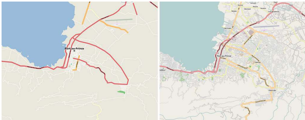
Figure 3 : Couverture de la voirie de la région de Port au Prince dans OSM avant et après le séisme (openstreetmap.org)