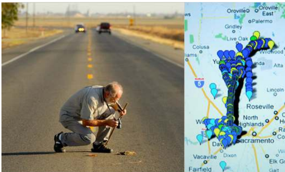
Figure 5 : Illustration du projet Roadkill Observation System (mobilebehavior.com)

mieux connaître la répartition et la chronologie des déplacements des oiseaux (Wiersma, 2010). Dans le même esprit, Whaleforce est un programme de recensement des populations de cétacés. La collecte de données est assurée par des groupes d'amateurs (plaisanciers) intéressés à compter les cétacés lors de leurs sorties en mer. Autre forme originale de programme relatif à la faune, le programme Roadkill Observation System, a pour objectif de répertorier des observations d'animaux écrasés au sein de l'état de Californie. Les volontaires parcourent le réseau routier pour localiser et répertorier les animaux morts sur les routes (figure 5). La collecte de données se fait à l'aide de coordonnées GPS, de photos et d'informations sur les espèces. À partir de ces données et en les recoupant avec d'autres sources, les chercheurs peuvent ainsi identifier les zones les plus meurtrières et les espèces les plus sensibles afin de mettre en place des dispositifs de protection adéquats.