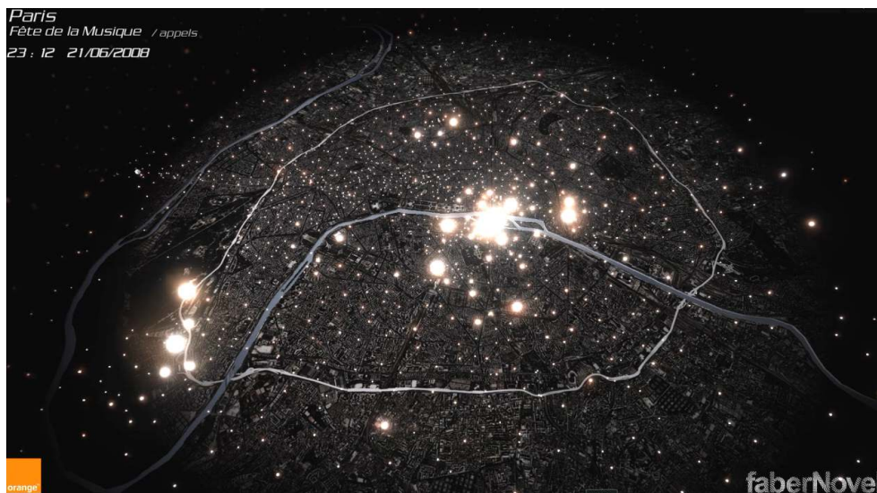
Figure 6 : Visualisation des appels passés par les téléphones mobiles à Paris, le soir de la fête de la musique (urbanmobs.fr)