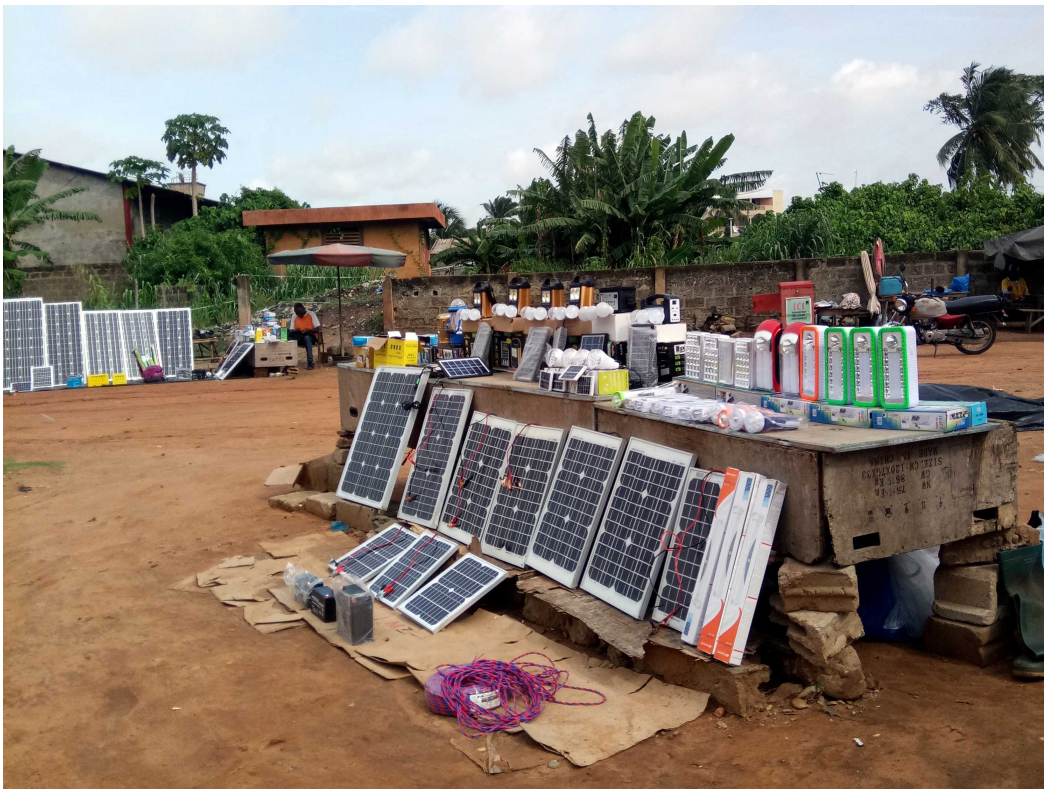
5. Vendeur informel de panneaux photovoltaïques à Cotonou (Bénin) (Rateau, 2018)

Dans les secteurs de l'eau et de l'électricité, des technologies low-cost importées, intégrées dans des dispositifs ingénieux, ont permis des progrès notables de l'accès. Ainsi, les citernes et tuyaux en PEHD (Polyéthylène Haute Densité) entrent dans des dispositifs sociotechniques qui ont transformé les marchés de l'eau à Douala (Nantchop, 2018) comme à Maputo (Dardenne et al. , 2009) et questionnent l'avenir du service en réseau (Vaucelle et Younsa Harouna, 2018). Là où l'expertise technique et les machines importées coûteuses ont longtemps été monopolisées par des entreprises publiques peu efficaces, la démocratisation des filières commerciales et la simplification de maniement des matériels ont permis, à l'initiative de nombreux entrepreneurs locaux, une diversification des dispositifs de fourniture dans lesquels les plastiques sont indispensables (citernes, bidons, tuyaux, bouteilles, sachets). Dans le domaine du photovoltaïque, les modules chinois à bas coût révolutionnent l'accès à l'électricité, tant dans les villages que dans les quartiers urbains pas ou mal desservis (Jaglin, 2019) tandis que les kits solaires génériques en provenance de Chine concurrencent d'autres produits de marque, plus robustes et à durée de vie plus longue mais aussi plus chers à l'achat, avec le risque de multiplier des déchets non recyclables (batteries, composants électroniques) (Grimm et Peters, 2016).