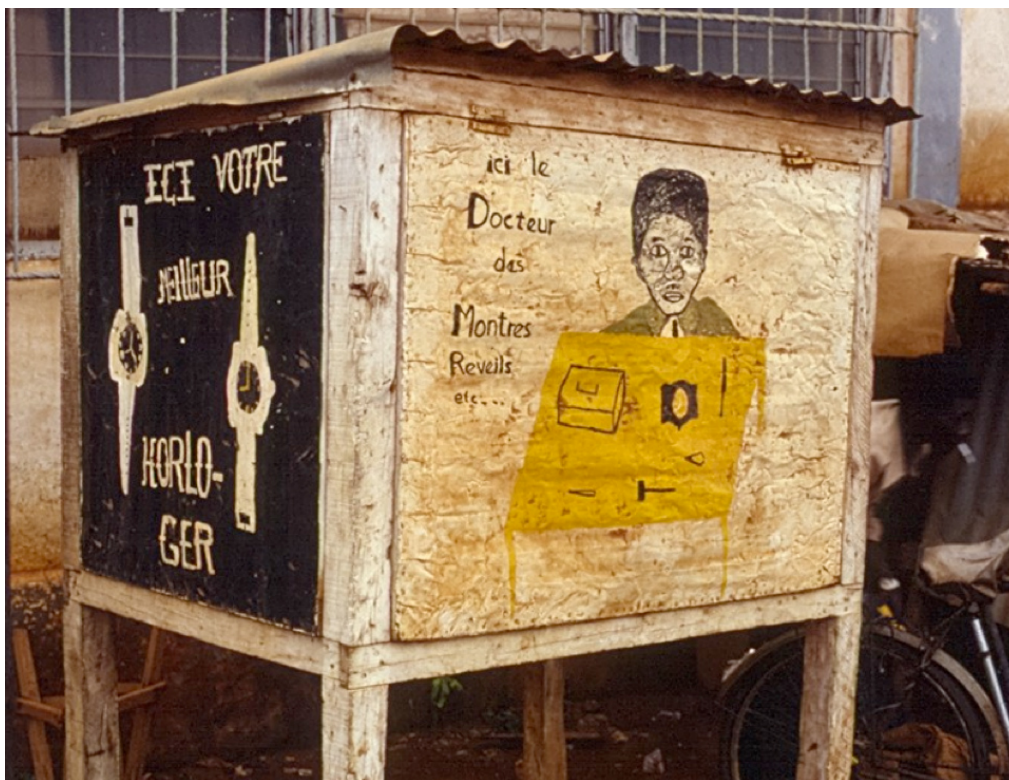
1. Réparateur de montre, Ouagadougou (Jaglin, 1990)

« Bidouiller, bricoler, fabriquer, innover » (Ambrosino et al. , 2018 : 5) : les logiques du « faire » ont toujours été prégnantes dans les villes africaines. Ces activités, passées du bricolage des vieux moteurs d'automobiles aux derniers smartphones chinois, sont omniprésentes. La réparation est partout, sur le bord des routes où les mécaniciens voisinent avec les « docteurs de montre » (figure 1), sur les marchés, où il est toujours possible de bricoler un carburateur, un ordinateur ou un kit solaire, de recoudre ou de transformer un vieux vêtement, de réparer un panier ou unealebasse. Le réemploi est aussi de toutes les pratiques : un même volume d'eau sert plusieurs usages successifs, un vieux moteur ou une ancienne batterie d'automobile sont réutilisés pour de nouveaux usages, les journaux et, de plus en plus, les plastiques emballent tous les produits vendus au détail, réduisant ainsi le gaspillage.