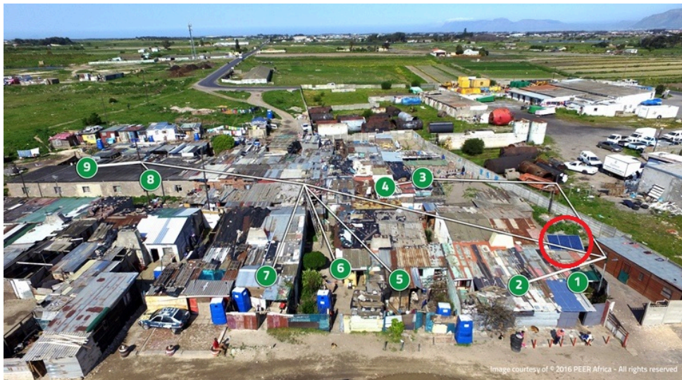
6. Mini-réseau Jabula au Cap, Afrique du Sud

C'est notamment le cas des nouvelles formes d'électrification qui combinent énergie photovoltaïque et téléphonie mobile dans le cadre de solutions collectives comme les mini-réseaux. Le projet Jabula, en phase d'expérimentation au Cap (Afrique du Sud) et conçu pour électrifier des quartiers informels hors réseau, en fournit une illustration (enquêtes de terrain, Le Cap, août 2018).