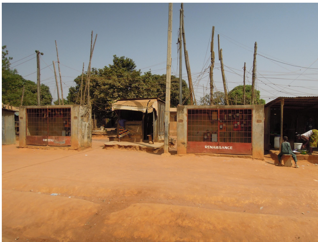
8. Toiles d'araignées électriques à Soussonoubougou (Bouaké, Côte d'Ivoire) (Steck, 2015)

montrent en effet que si l'informel permet de survivre, il n'assure aucun changement structurel (Lautier, 2004). Si, en favorisant le partage du travail, le low-tech présente un attrait dans les sociétés « hyper-industrielles » (Veltz, 2017) où l'on craint la disparition du salariat, il en va différemment dans les sociétés urbaines d'Afrique subsaharienne, où l'informel low-tech est avant tout une nécessité.