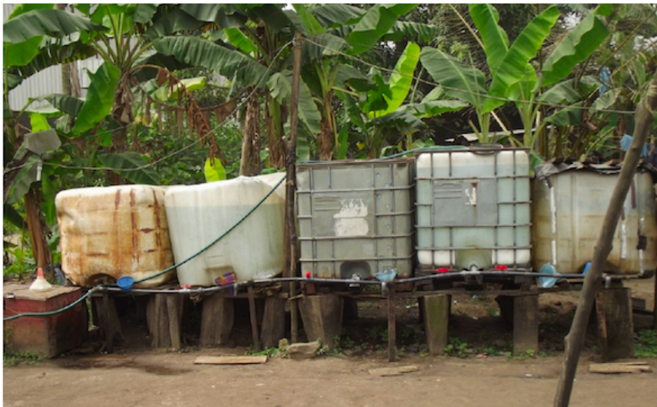
3. Dispositif privé de stockage et de revente informelle d'eau à Mbandaka (Douala, Cameroun) (Nantchop, 2015)

Le low-cost est en effet souvent associé à des produits peu écologiques, comme le plastique, matériau bon marché importé sous des formes diverses et bon à tout : emballages et sacs, ustensiles, petits meubles, chaussures, tapis... Même fabriqués à partir de matières premières secondaires, les plastiques issus de filières de recyclage ne sont guère vertueux d'un point de vue environnemental, tant du fait des pollutions occasionnées sur les lieux de transformation, notamment au Vietnam (Le Meur, 2019), que des longues routes maritimes conteneurisées qu'empruntent les produits finis réexpédiés vers l'Afrique à partir du marché de gros chinois Yiwu 3 ou encore de la pollution par les déchets plastiques en fin de vie dans les villes africaines, en dépit des mesures d'un nombre croissant de municipalités . En outre, les ustensiles et objets en plastique tendent à se substituer à d'autres, issus de l'artisanat et fabriqués à partir de matériaux locaux (les Calebasses, les tabourets en bois, les sacs en toile de jute ou en sisal par exemple).