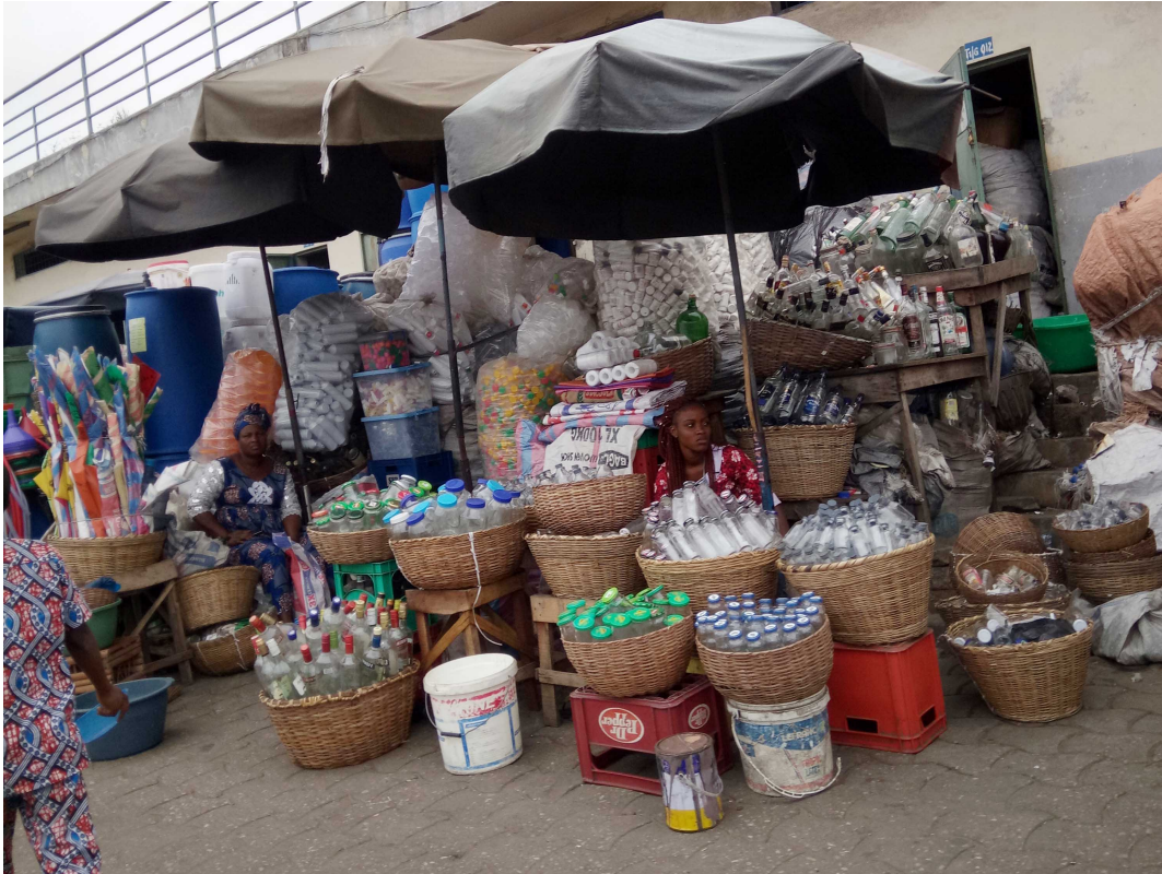
2. Recyclage et vente de contenants usagés à Cotonou