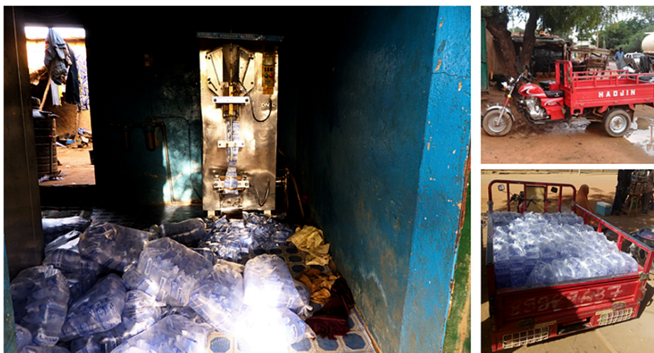
4. Machine de conditionnement d'eau en sachet et véhicule de distribution à Niamey (Niger) (Younsa Harouna, 2017)