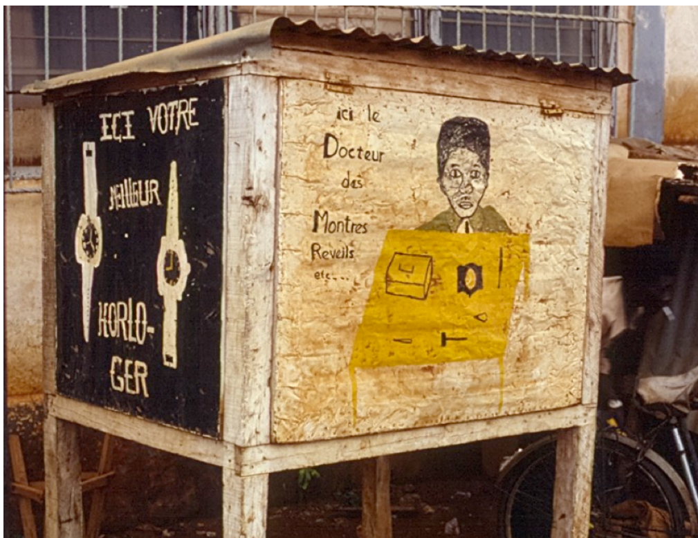
1. Réparateur de montre, Ouagadougou (Jaglin, 1990)

« Bidouiller, bricoler, fabriquer, innover » (Ambrosino et al. , 2018 : 5) : les logiques du « faire » ont toujours été prégnantes dans les villes africaines. Ces activités, passées du bricolage des vieux moteurs d'automobiles aux derniers smartphones chinois, sont omniprésentes. La réparation est partout, sur le bord des routes où les mécaniciens voisinent avec les « docteurs de montre » (figure 1), sur les marchés, où il est toujours possible de bricoler un carburateur, un ordinateur ou un kit solaire, de recoudre ou de transformer un vieux vêtement, de réparer un panier ou unealebasse. Le réemploi est aussi de toutes les pratiques : un même volume d'eau sert plusieurs usages successifs, un vieux moteur ou une ancienne batterie d'automobile sont réutilisés pour de nouveaux usages, les journaux et, de plus en plus, les plastiques emballent tous les produits vendus au détail, réduisant ainsi le gaspillage.