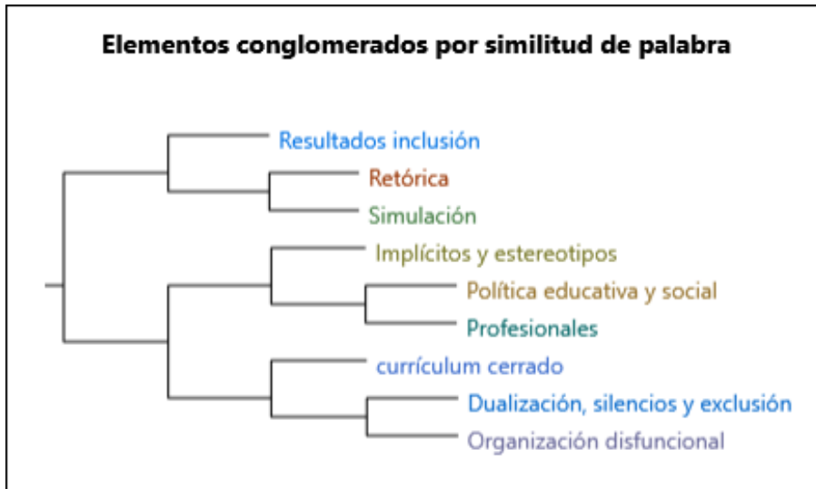
Figura 1. Análisis de conglomerados sobre principales críticas al desarrollo actual de la inclusión

De este modo, convenía reparar en algunas de las múltiples llamadas de atención que han surgido a lo largo del proceso de recogida de evidencias.