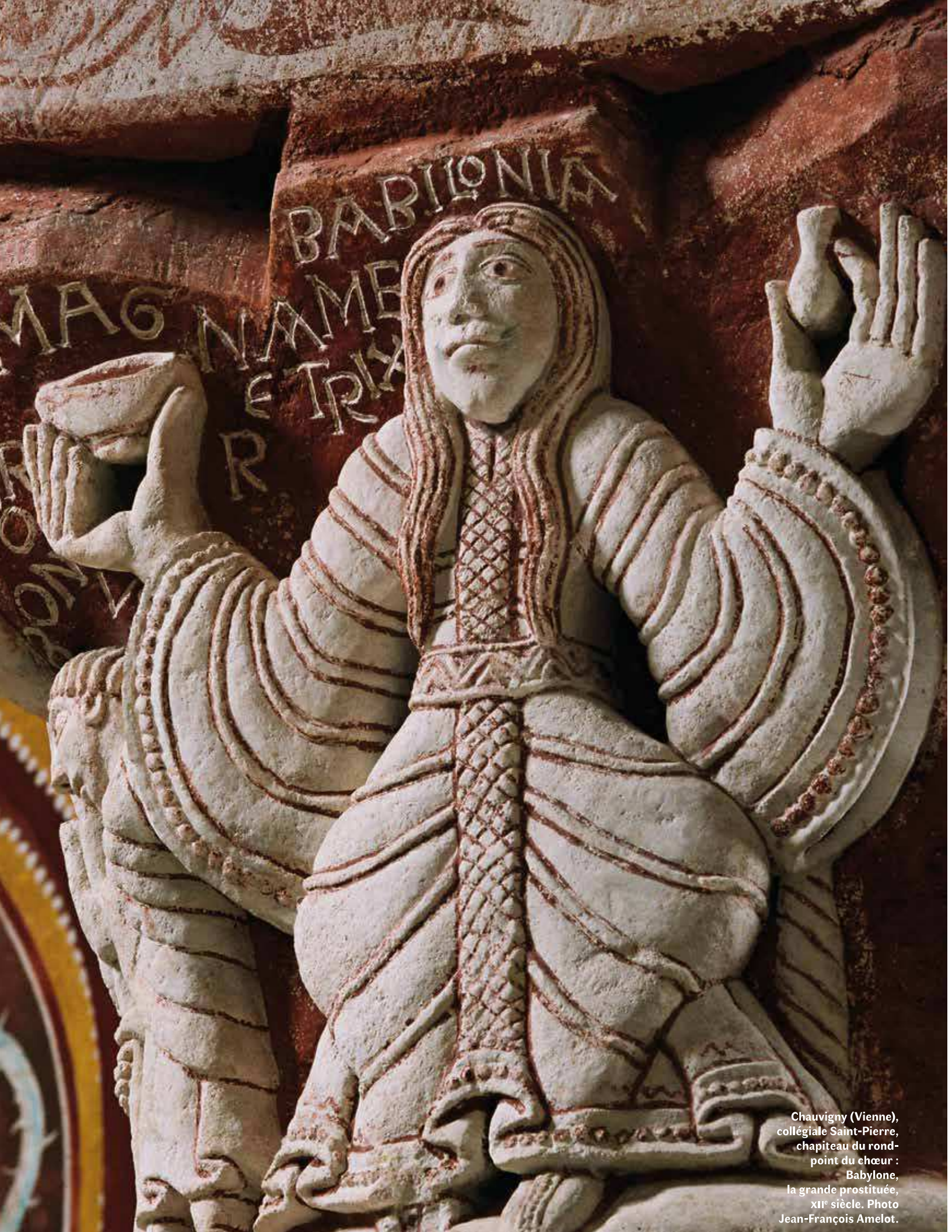
Chauvigny (Vienne), collégiale Saint-Pierre, chapiteau du rond- point du chœur : Babylone, la grande prostituée, XII e siècle.