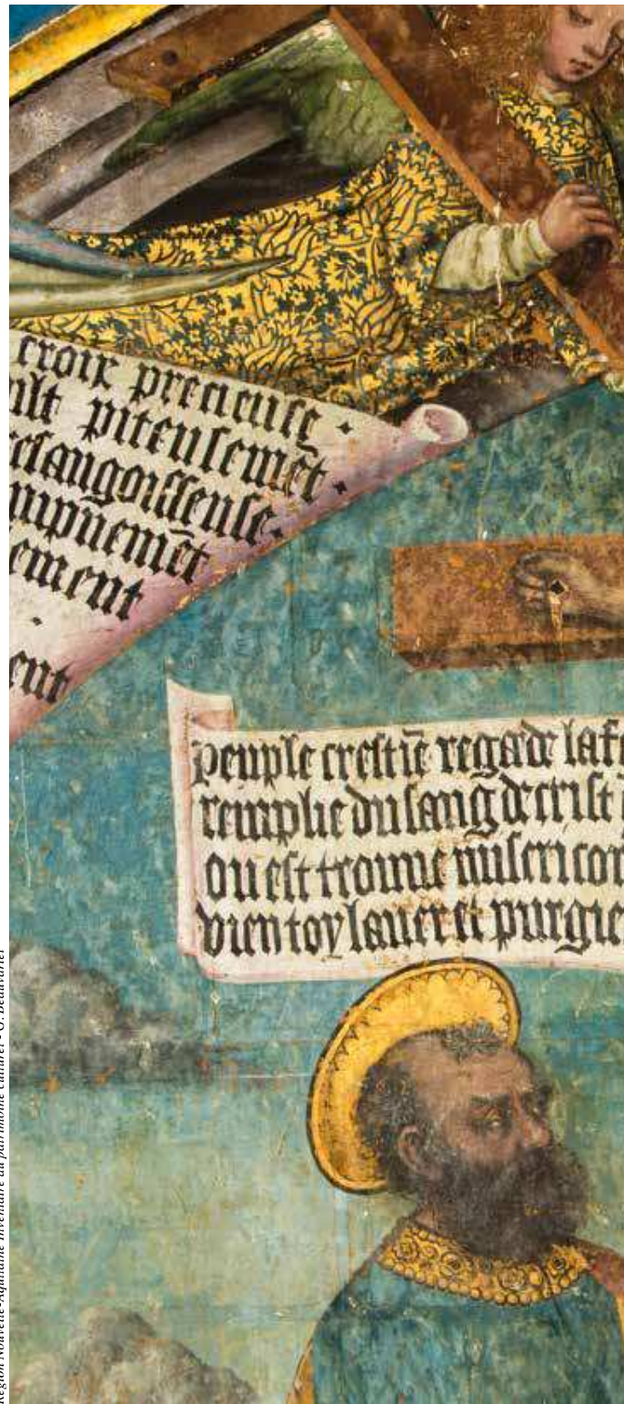
Région Nouvelle-Aquitaine Inventaire du patrimoine culturel - G. Beauvarlet

Ci-dessus, Dissay (Vienne), chapelle du château (construit par Pierre d'Amboise, évêque de Poitiers), fresque de la crucifixion, XV e siècle.