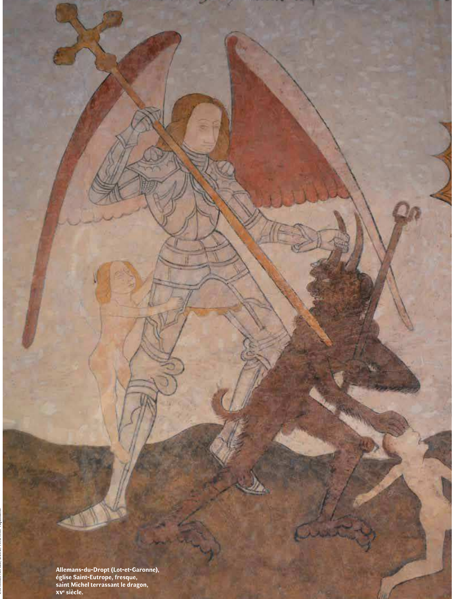
Allemans-du-Dropt (Lot-et-Garonne), église Saint-Eutrope, fresque, saint Michel terrassant le dragon, XV e siècle.