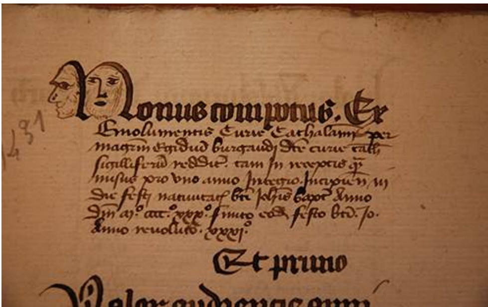
Fig. 3, G 895, fol. 1.