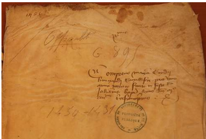
© Archives Départementales de la Marne, G895. Cliché Véronique Beaulande-Barraud