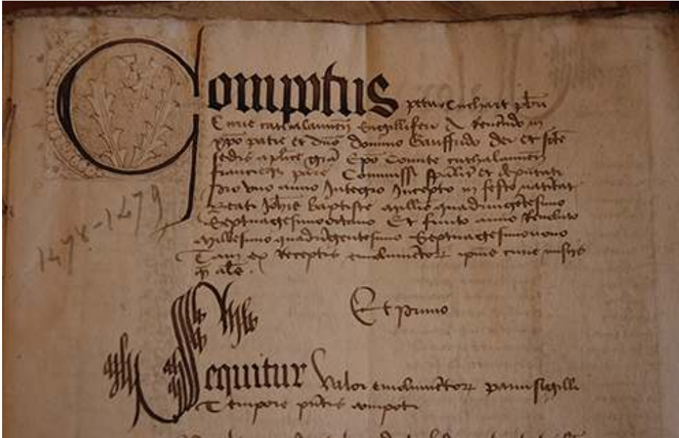
Fig. 2 G 902, fol. 1.