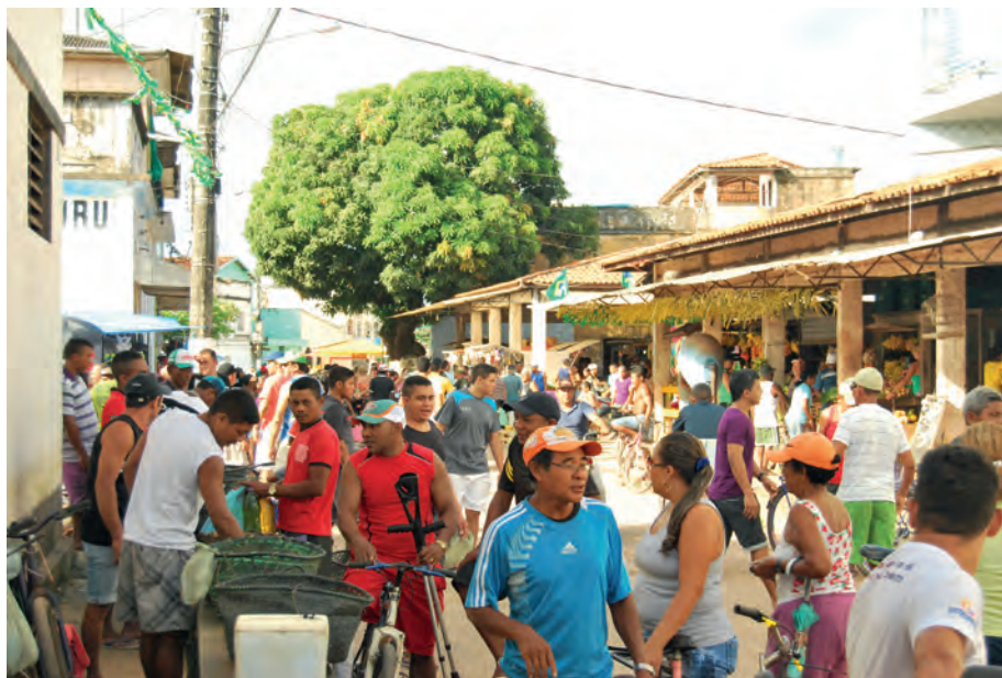
Figura 2: A relação com a cidade é cada vez mais intensa.