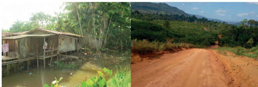
Figura 1: Falta de saneamento e acesso difícil continuam típicos da Amazônia (fotomontagem).