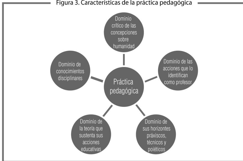
Figura 3. Características de la práctica pedagógica