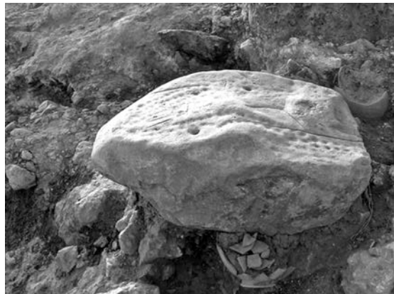
Figure 5. Urne n° 435 écrasée par la pierre à cupules.