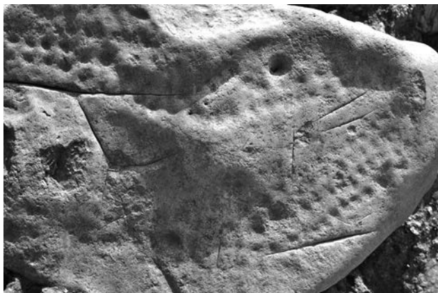
Figure 3. Détail de la surface de la pierre.