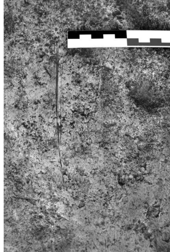
Figure 4. Trace de découpe.