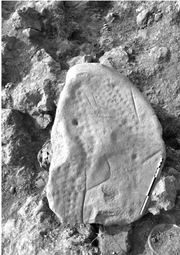
Figure 2. Vue zénithale de la pierre à cupules.