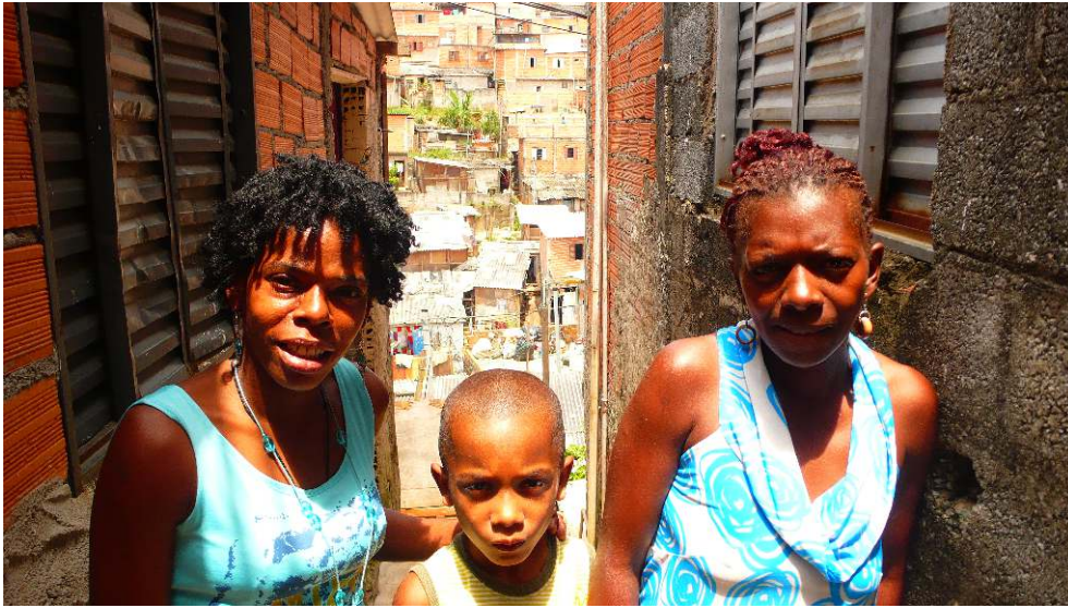
Figure 2 : Favelados

Aujourd'hui encore, la grande majorité des maisons de favelas ne disposent pas de titres de propriété. En dépit de cela, le marché immobilier informel est intense