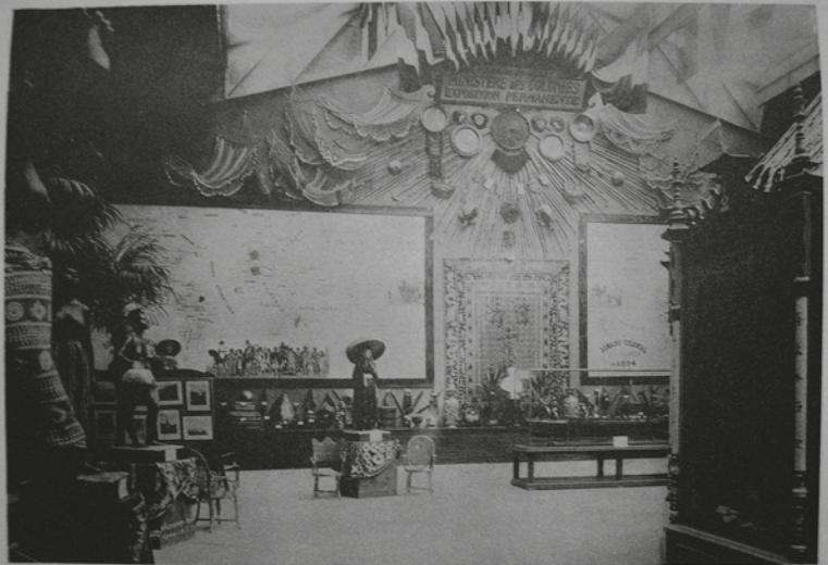
PLANCHE VII EXPOSITION PERMANENTE DES COLONIES (Palais de l'Indo-Chine)