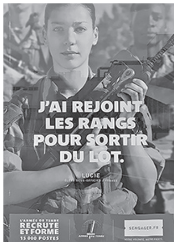
Photo 1. Campagne de recrutement pour l'armée de terre.

À y regarder de plus près, l'oxymore n'est pas dépourvu de sens. Le rapprochement de termes éloignés évoque deux attitudes consubstantielles du programme durkheimien d'éducation (la conformité sociale et l'individualisation) observées lors d'une enquête dans un dispositif d'inspiration militaire pour jeunes sans diplôme. Comment la discipline appuie-t-elle l'autonomie ? Quels sont les effets de la forme militaire sur les jeunes sans diplôme ? L'oxymore est le point de départ de cet article sur la (re)socialisation des jeunes sans diplôme qui font le choix d'un retour en formation en internat d'inspiration militaire 1 .