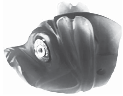
FIG. 11 Kt 95/k 110, tête de cochon en cornaline de 5,5 × 4,3 × 4 cm dans ses dimensions les plus larges. Ville basse, niveau Ib.

Des découvertes similaires ont été faites dans les tombes du niveau Ib. Parmi celles-ci, un collier (ou un bracelet) fait de 10 perles d'or et 6 perles en fritte, comporte une grosse perle en cornaline biconique, l'un des côtés étant taillé en cercles concentriques (Fig. 8). 44 Les dimensions de cette perle de longueur L = 8 cm et de diamètre sur sa partie la plus large D = 2,3 cm permettent d'en calculer sa masse, sachant qu'elle se compose de deux cônes, l'un d'une longueur L/3 et l'autre d'une