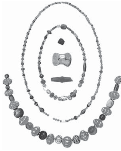
FIG. 2 Colliers et perles exhumés dans la tombe 37 d'Aššur. Ass 20504e, o, t, w, z sont en cornaline ou comportent des perles en cornaline. Début du 2 e millénaire.

liptique allongée, en forme de date et biconique. 36 Un tour du cou comportait deux perles allongées en cornaline encapuchonnées d'or, l'une avec un anneau d'or en son centre, ainsi qu'une douzaine de petites perles sphériques en cornaline (FIG. 1). 37