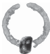
FIG. 7 Kt 84/k 159, anneau en bronze et perle en cornaline, ville basse, niveau II.