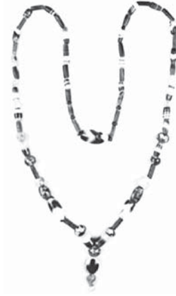
FIG. 4 Ass 12660o, tombe 13.