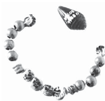
FIG. 8 Kt 88/k 806, collier en or, fritte et cornaline, ville basse, niveau Ib.