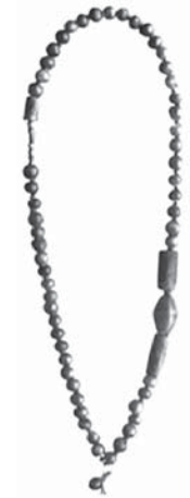
FIG. 5 Collier en or, cornaline et lapis-lazuli, Bronze ancien IIIc.

La tombe 13 (anciennement n°35) comportait un collier fait de perles allongées en agate rubannée, cornaline et lapis-lazuli ; les 24 perles en cornaline sont de forme cylindrique (FIG. 4). 40