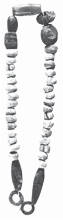
FIG. 9 Kt 83/k 52, collier en fritte, stéatite, or et cornaline, ville basse, niveau Ib.