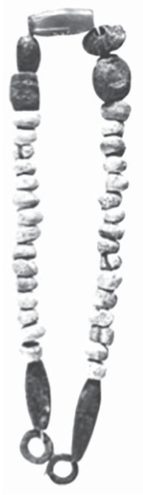
FIG. 9 Kt 83/k 52, collier en fritte, stéatite, or et cornaline, ville basse, niveau Ib.