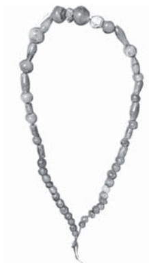
FIG. 6 Kt 85/k 112, collier en cornaline et fritte, ville basse, niveau II.