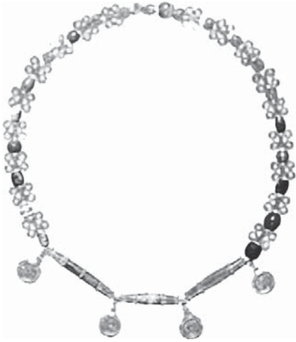
FIG. 1 Tour de cou exhumé dans la tombe 37 d'Aššur. Ass 20504g, h, u, x. Début du 2 e millénaire.