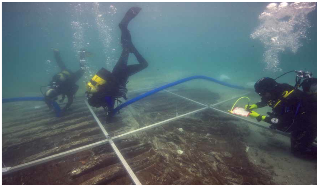
Nettoyage des structures de l'épave de Debeljiak et observations sur les structures