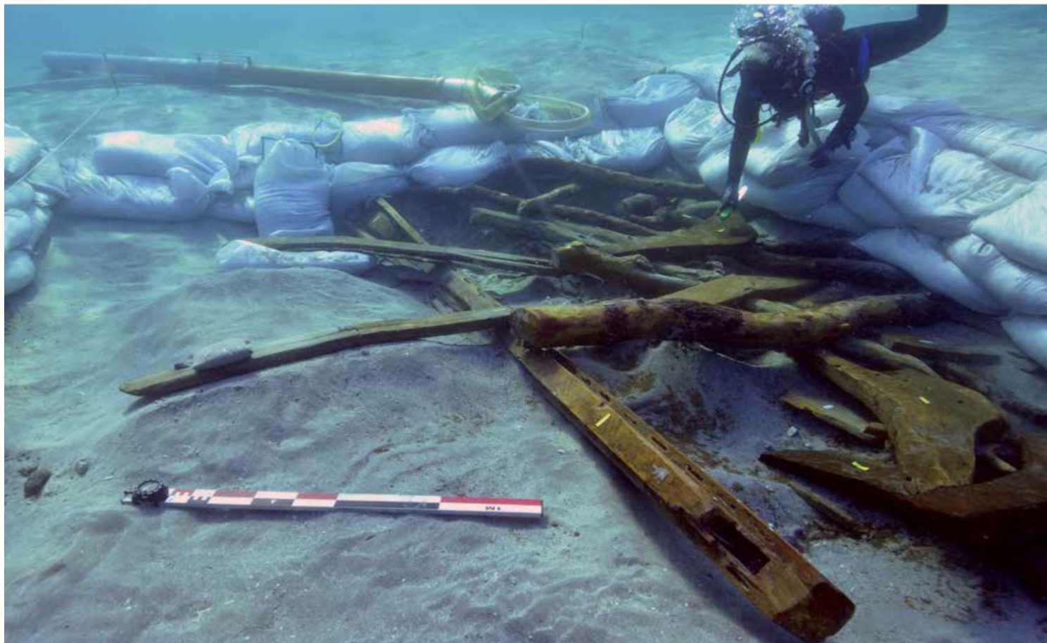
Vue du sondage de fouille réalisé dans la baie de Paržine : parmi les structures du navire disloquées, on note l'extrémité de la quille avec une encoche pour l'étrave et à droite de l'image des varangues

Bronze et le début de l'âge du Fer mis au jour à Zambratija, en Istrie septentrionale. Dépourvue de chargement mais conservée sur sept mètres de longueur, cette épave est tout à fait unique par son état de conservation remarquable et par sa datation qui en fait le plus ancien exemple de bateau entièrement cousu découvert en Méditerranée. L'architecture, la technique d'assemblage des virures du bordé, ainsi que le système d'étanchéité de la coque, n'ont aucun équivalent, non seulement dans l'espace méditerranéen mais aussi en Adriatique, soit un espace géographique où la technique de la ligature a survécu dans la construction navale jusqu'à l'Antiquité tardive, voire jusqu'au Haut Moyen Âge.