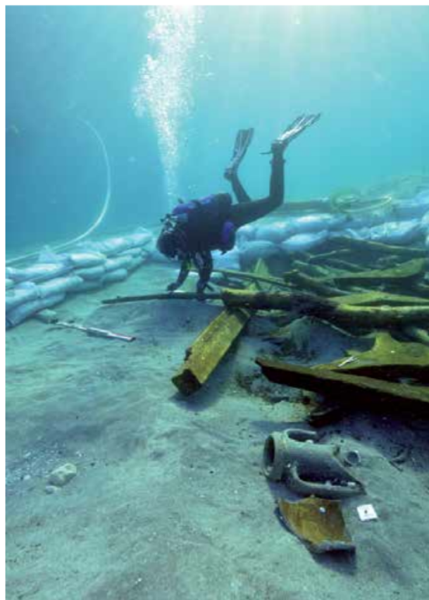
Vue du sondage de fouille réalisé dans la baie de Paržine : parmi les structures disloquées du navire, on note au premier plan un col d'amphore Lamboglia 2 ancienne