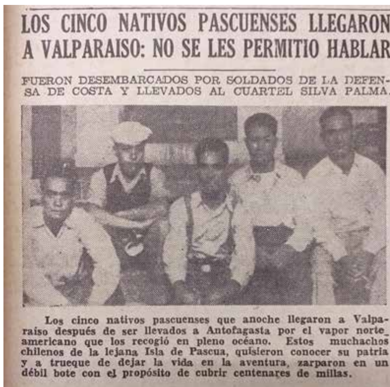
Imagen 3: Los cinco rapanui socorridos en alta mar a su llegada a Valparaíso. El Mercurio de Valparaíso , 4 de marzo de 1944.

¿Cuál es la importancia histórica de esta fuga? Ella mostró al resto de los isleños que era posible dejar Rapa Nui en un bote pequeño.