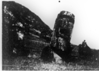
La isla de Pascua es nuestro pequeño "imperio colonial". Pero hemos dejado que, en parte, los extranjeros se llevaran los totemos, monumentos seculares de una civilización desaparecida.

El hecho de que el pascuense Hito hable mejor los idiomas extranjeros y que revele desconfianza hacia sus semejantes "por experiencia", revela que si bien es cierto que esos nativos quieren considerarse chilenos, nuestro país hace muy poco en su papel, altamente serio, de "madre patria" de esa hermosa y distante posesión.