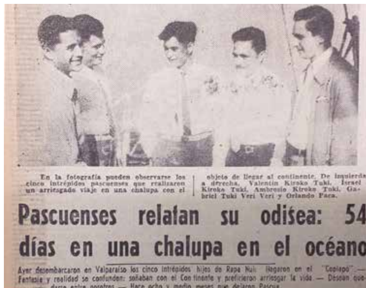
Imagen 6. Los cinco rapanui a su llegada a Valparaíso. El Mercurio de Valparaíso , 11 de junio de 1956.

Una verdadera odisea que el más imaginativo de los novelistas habría deseado poseer para sus obras, cumplieron los cinco pascuenses que llegaron ayer a bordo del vapor ‘Copiapó’ a Valparaíso. La hazaña en síntesis es la siguiente: Con el deseo de conocer el continente, 5 hombres de la Isla de Pascua embarcaron el 5 de octubre del año pasado en una chalupa de 7 metros de largo por dos de ancho, con víveres para 30 días, pero navegaron 54 en medio del océano. Después de recorrer 2.800 millas en esa pequeña embarcación, sufriendo los embates de fuertes temporales y la lluvia, llegaron a las Islas Cook, donde se les hizo un recibimiento magnífico con hermosas nativas que tocaban acordes en melancólicas guitarras mientras los agotados marinos se entregaban al sueño reparador. Después de numerosas peripecias, fueron enviados a Tahiti, desde donde embarcaron a Panamá para llegar por fin al ansiado Valparaíso y exclamar, al ver las dos torres a la entrada de la Aduana: ‘Esto parece un sueño; por fin estamos en nuestra Patria’.