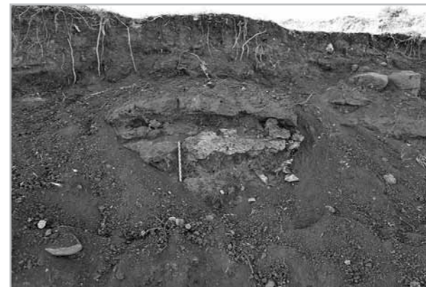
Fig. 3- Exemple de ferriers de type 1; vue des sols métallurgiques indurés superposés dans la partie supérieure du site de Mamboukh.

à quelques fragments céramiques ( Tab. 1 ). Cette datation s'accorde bien à la très bonne préservation des vestiges observés. Tous les autres sites sauf deux indéterminés sont des ferriers ordinaires du type 0. Ces ferriers bouleversés ou ensevelis sont composés d'un tas lâche et dispersé de scories denses coulées davantage concentrées dans la partie haute de la pente, au niveau du point d'injection ( Figs 4 et 5 ). Ici, les scories n'ont pas l'aspect cristallin et les arêtes vives observés dans le type 1. Elles sont aussi plus fractionnées (inférieures à 7/8 cm). Aucune tuyère n'a été observée et on distingue rarement des zones charbonneuses. Des éléments de datation céramiques ont cependant été découverts sur 6 des 15 sites de ce type de ferrier: 3 semblent en lien avec une très large Antiquité et 3 autres à l'époque médiévale ( Tab. 1 ).