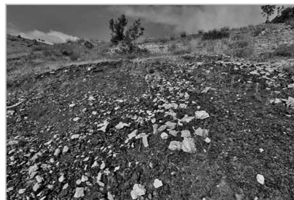
Fig. 2- Exemple de ferriers de type 1; vue générale du site de Nimri_2.