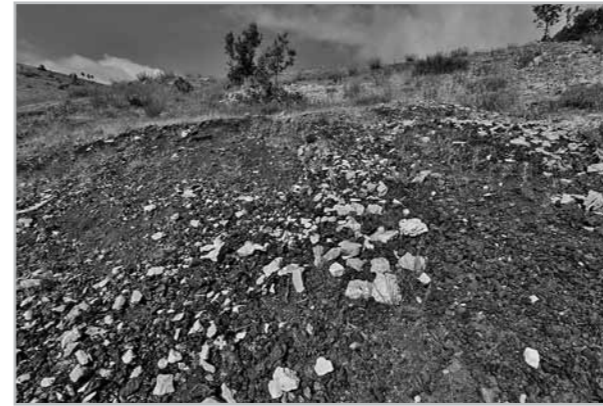
Fig. 2- Exemple de ferriers de type 1; vue générale du site de Nimri_2.