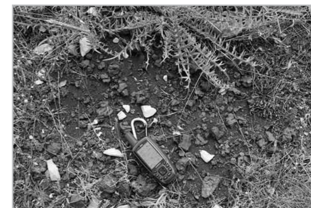
Fig. 5- Exemple de ferriers de type 0; vue de détail du site de JOZ_ss5.