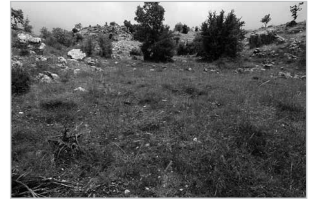
Fig. 4- Exemple de ferriers de type 0; vue générale du site de JOZ_ss5.

à quelques fragments céramiques ( Tab. 1 ). Cette datation s'accorde bien à la très bonne préservation des vestiges observés. Tous les autres sites sauf deux indéterminés sont des ferriers ordinaires du type 0. Ces ferriers bouleversés ou ensevelis sont composés d'un tas lâche et dispersé de scories denses coulées davantage concentrées dans la partie haute de la pente, au niveau du point d'injection ( Figs 4 et 5 ). Ici, les scories n'ont pas l'aspect cristallin et les arêtes vives observés dans le type 1. Elles sont aussi plus fractionnées (inférieures à 7/8 cm). Aucune tuyère n'a été observée et on distingue rarement des zones charbonneuses. Des éléments de datation céramiques ont cependant été découverts sur 6 des 15 sites de ce type de ferrier: 3 semblent en lien avec une très large Antiquité et 3 autres à l'époque médiévale ( Tab. 1 ).