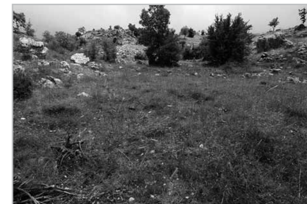
Fig. 4- Exemple de ferriers de type 0; vue générale du site de JOZ_ss5.

à quelques fragments céramiques ( Tab. 1 ). Cette datation s'accorde bien à la très bonne préservation des vestiges observés. Tous les autres sites sauf deux indéterminés sont des ferriers ordinaires du type 0. Ces ferriers bouleversés ou ensevelis sont composés d'un tas lâche et dispersé de scories denses coulées davantage concentrées dans la partie haute de la pente, au niveau du point d'injection ( Figs 4 et 5 ). Ici, les scories n'ont pas l'aspect cristallin et les arêtes vives observés dans le type 1. Elles sont aussi plus fractionnées (inférieures à 7/8 cm). Aucune tuyère n'a été observée et on distingue rarement des zones charbonneuses. Des éléments de datation céramiques ont cependant été découverts sur 6 des 15 sites de ce type de ferrier: 3 semblent en lien avec une très large Antiquité et 3 autres à l'époque médiévale ( Tab. 1 ).