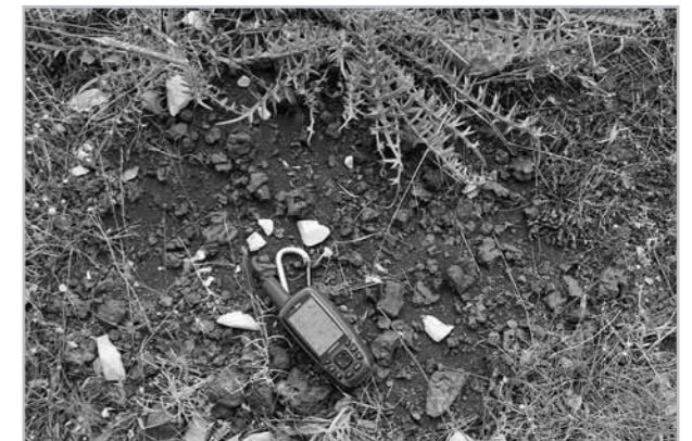
Fig. 5- Exemple de ferriers de type 0; vue de détail du site de JOZ_ss5.