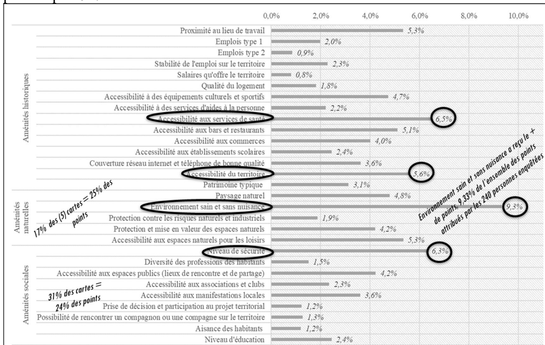
Figure 1 - Les préférences des Lyonnais en matière d'éléments constitutifs du bien-être au printemps 2017

Lecture du graphique en barres groupées : Il s'agit du nombre de points accordés à chacune des 10 cartes ayant reçu le plus de points parmi les 29 cartes présentées aux 240 Lyonnais, exprimé en pourcentage du total des points. Ainsi, la carte « un environnement sain et sans nuisance » a reçu le plus de points, 9,3% de l'ensemble des points attribués par les 240 personnes enquêtées.