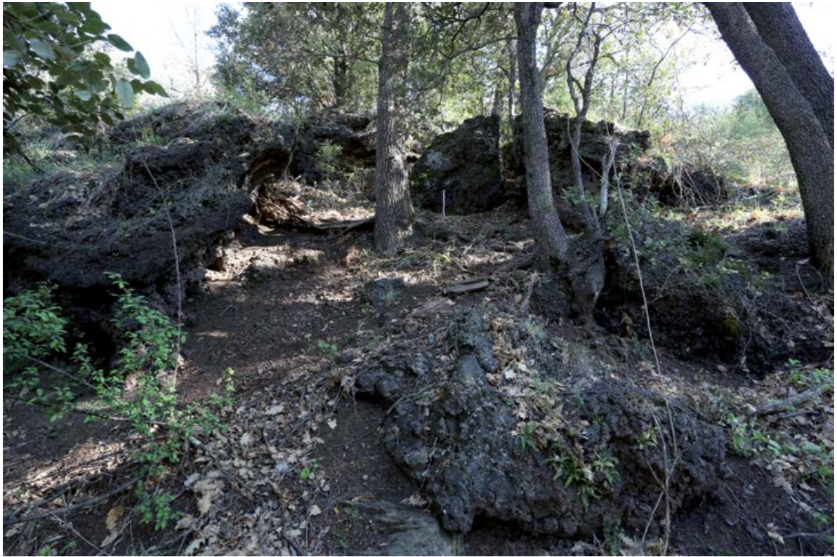
Figure 6. Môle fragmenté dans un versant abrupt (Correch del Carraller, Finestret, 66, France, G. Pagès).

ferriers, il est nécessaire de connaître la forme supérieure du tas : en dôme ou plat. Ce critère apparemment anodin peut aussi témoigner de l'état de conservation.