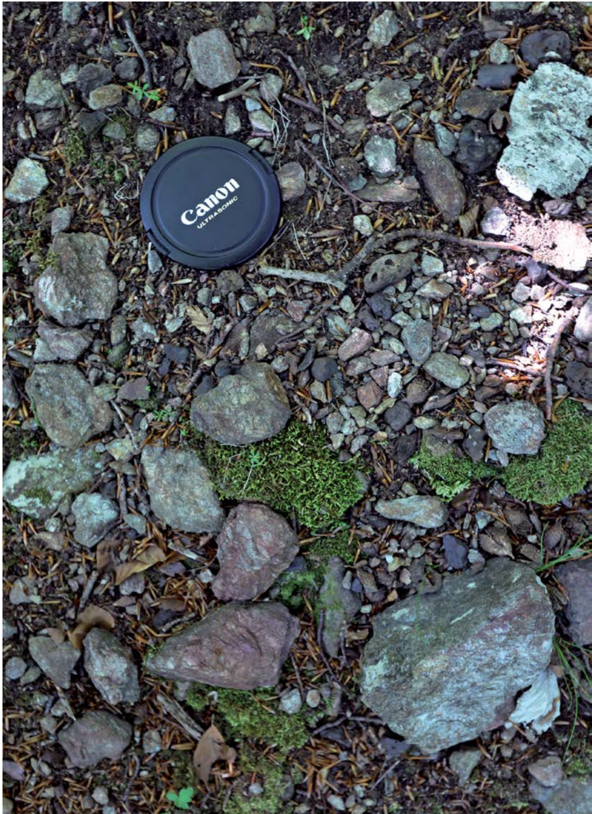
Figure 4. Profils des ouvrages selon la technique employée. A : Ouverture à l'explosif – Les Atiels. B. Ouverture à l'outil – Le Goutil. C. Ouverture au feu – Hautech.