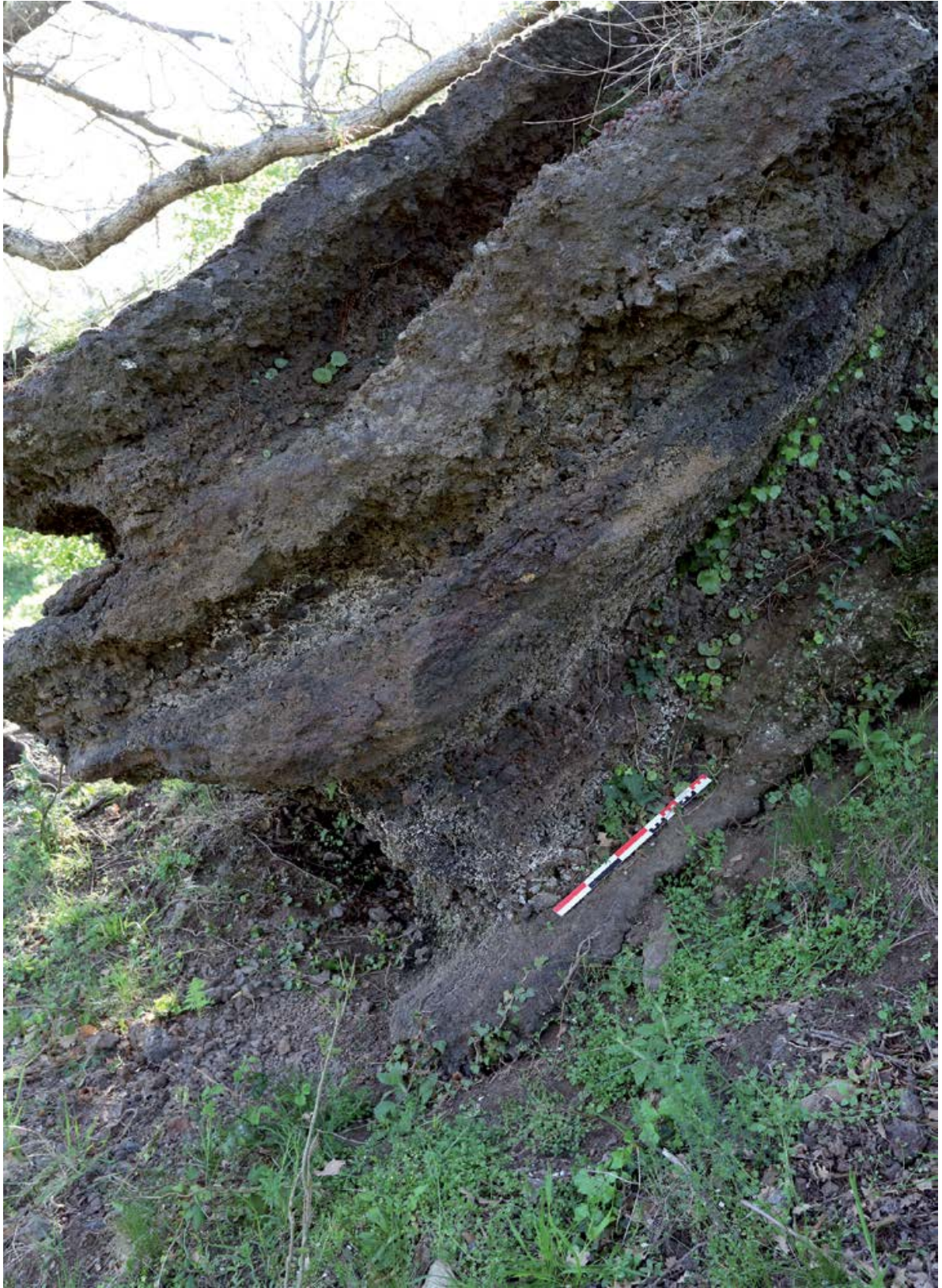
Figure 5. Un fragment de môle de scorie coulée avec une importante stratification (Oratori, Saint-Marsal, 66, France, G. Pagès).