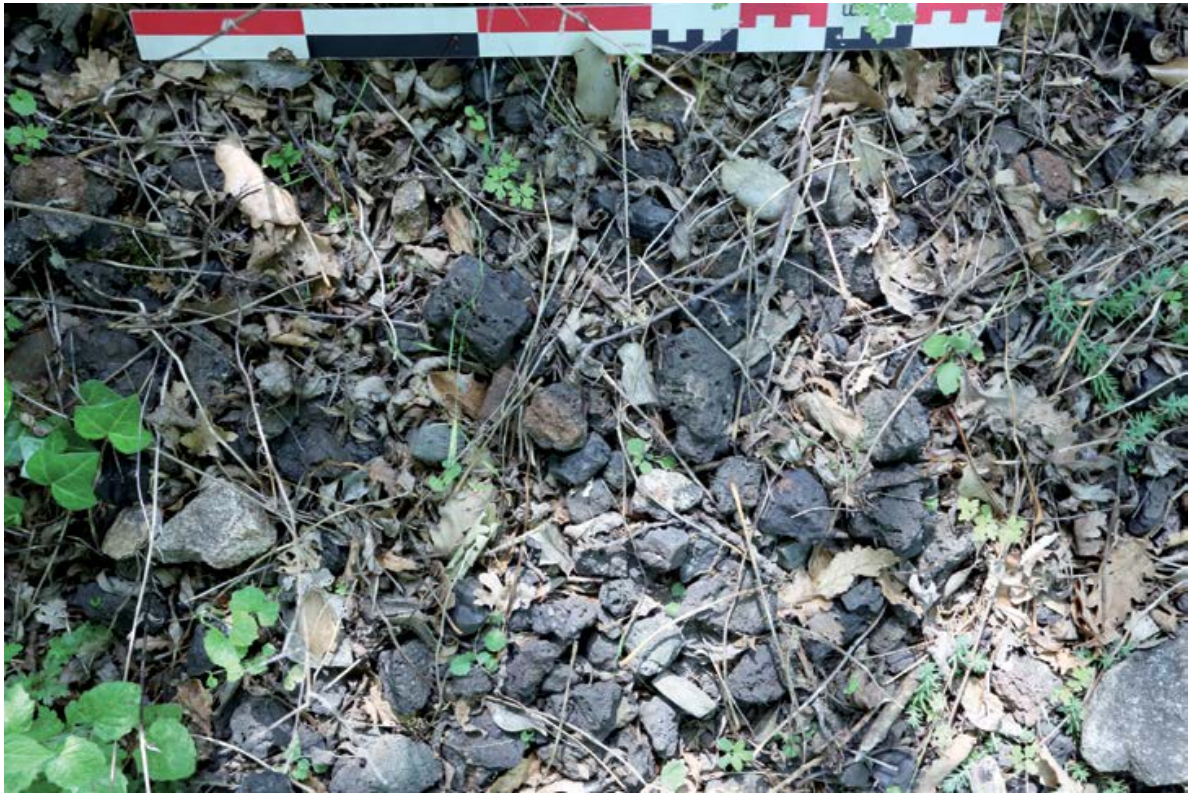
Figure 3. Un exemple d'une surface supérieure d'un ferrier avec une consistance dense (Can Cerda, Montbolo, 66, France, G. Pagès).