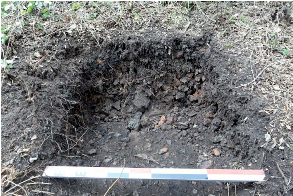
Figure 1. Un exemple d'un ferrier avec une consistance concentrée dans l'emprise d'un sondage (Mas de la Serre, Finestret, 66, France, G. Pagès).