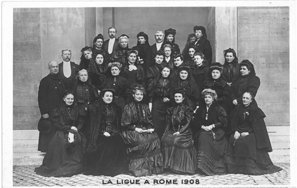
La Ligue à Rome