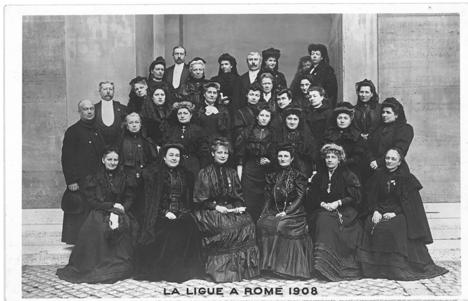
La Ligue à Rome