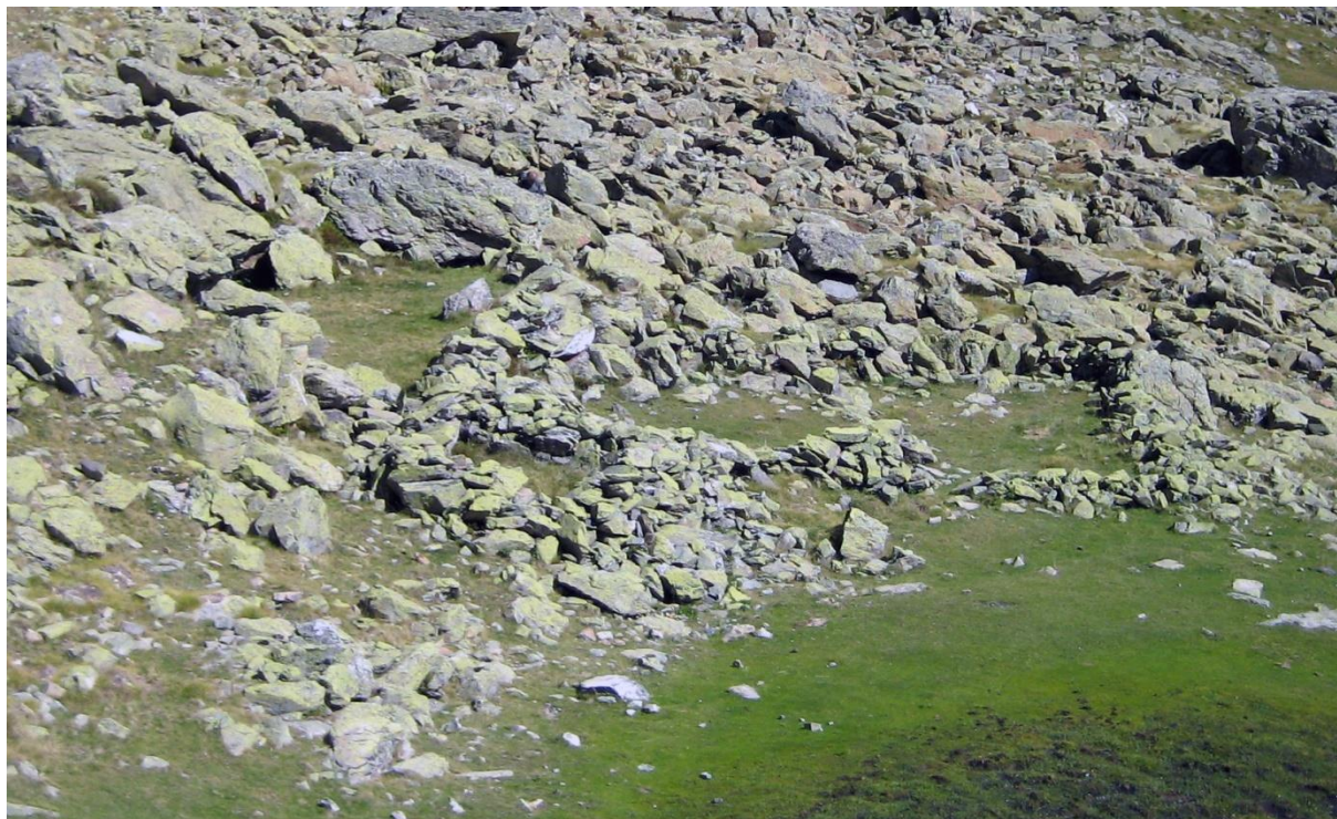
Figure 3: une cabane entourée de trois enclos (Caillaoulat, Estive d'Anéou).

(tentes, abri sous roche, site de plein air) et incluent le couchage, la préparation des repas, le stockage et le travail (fabrication du fromage par exemple). Les secondes constructions servent au parcage, à la protection et au confinement des animaux ; il s'agit des parcs, enclos et abris construits pour les troupeaux.