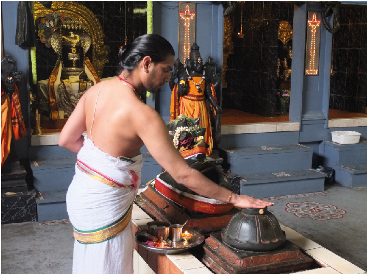
Figure 2 - Prêtre śivācārya indien officiant dans un temple hindou de Toronto (cliché auteur 2014)

originels »). Ces prêtres migrants sont shivaïtes parce que, tout comme au Tamil Nadu et au nord du Sri Lanka, la grande majorité des temples hindous de la diaspora tamoule sont dédiés à des divinités shivaïtes, telles que les dieux Vināyakar et Murugaṅ-Śivasubrahmaṇya, la déesse Ammaṅ, et Śiva dans une moindre mesure car ses temples sont peu nombreux en diaspora. Selon les Āgama, les Śivācārya sont les seuls autorisés à célébrer les rituels de temple publics ( parārtha pūjā ), alors que toutes les castes ( varṇa ) peuvent conduire des rites à des fins individuelles ou familiales dans des lieux privés ( ātmārtha pūjā ). Et bien qu'ils puissent conduire les rituels ( pūjā ; tam. pūcai ) à la fois dans les temples des divinités brahmaniques xiii et dans ceux dédiés à des dieux villageois ( tēvatai ), les Śivācārya ne sont pratiquement jamais recrutés pour travailler dans ce /p.338/ deuxième type de lieux de culte en diaspora (tout du moins tant qu'ils ne sont pas gagnés par les phénomènes conjoints d'agamisation et de brahmanisation). Ce sont en effet plutôt des prêtres locaux non brahmanes ( pūcāri ) qui y officient, comme c'est le cas depuis le XIX e siècle dans les anciennes colonies où se sont installés des travailleurs hindous sous contrat, telles que l'île Maurice (Claveyrolas 2014).