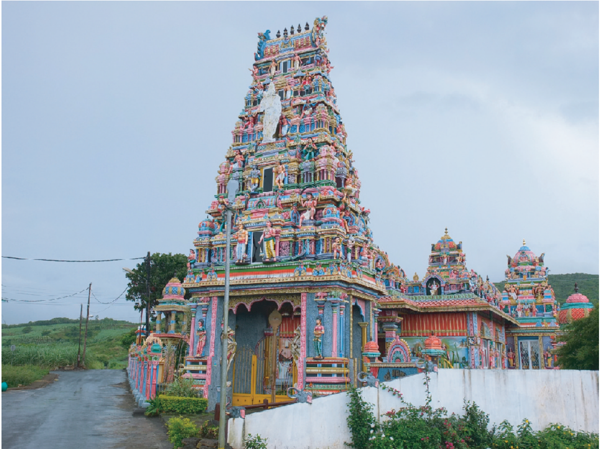
Figure 1 – Temple rénové dans une plantation de canne à sucre à Maurice

prêtres migrants associent la faute de la traversée des mers au fait de travailler « ailleurs » que sur la seule terre de l'hindouisme et surtout au contact de l'Autre, qu'il soit non-brahmane ou non-hindou. Enfin, la dernière section porte sur leurs négociations et considérations – parfois critiques – de leur transgression de cet interdit migratoire.